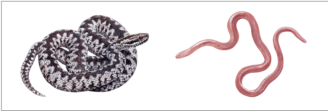
Obr. 2 Ukázka profesionálně vytvořených kreseb hadů a zároveň reprezentanti dvou vybraných skupin, vlevo druhy vzbuzující strach (zde druh Vipera berus ), vpravo druhy vzbuzující znechucení (zde druh Xerotyphlops vermicularis ). Obrázky převzaty z publikace IV (Rádlová et al. 2019), autor kreseb MVDr. Pavel Procházka.