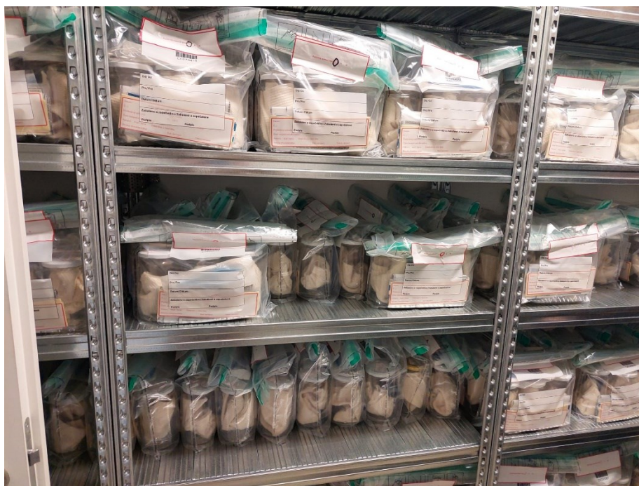
Příloha 7: Fotografie připravených sterilizovaných konzerv a nástrojů