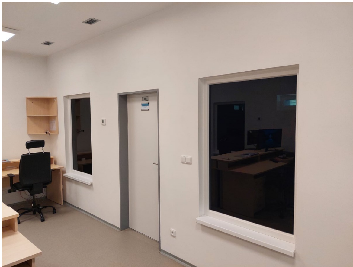
Příloha 3: Fotografie stolu k rozdělování snímačů pachových konzerv