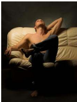
Obrázek č. 6 - Fotografie z úvodní stránky www.metrosexualroku.cz 68