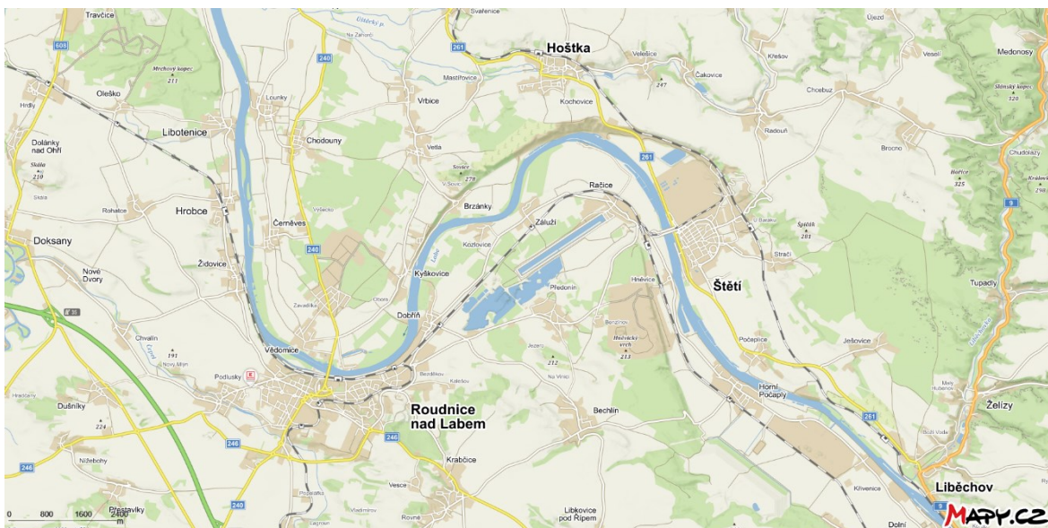
Mapa 1 Aktuální mapa regionu. 258