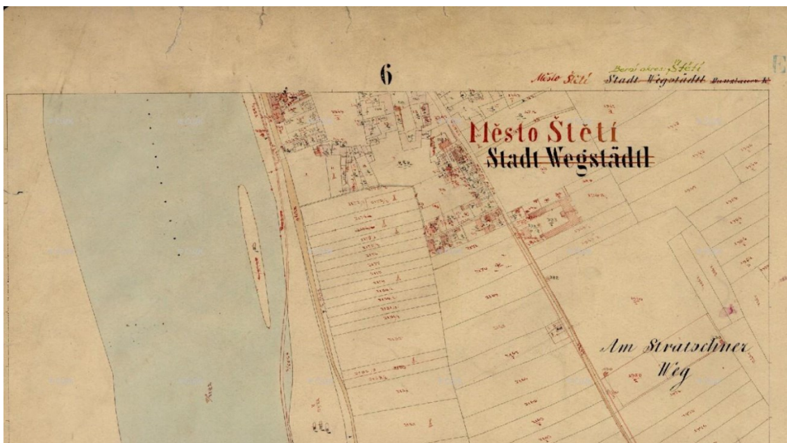
Mapa 5 Mapa Štětí z roku 1876 část 2. 262