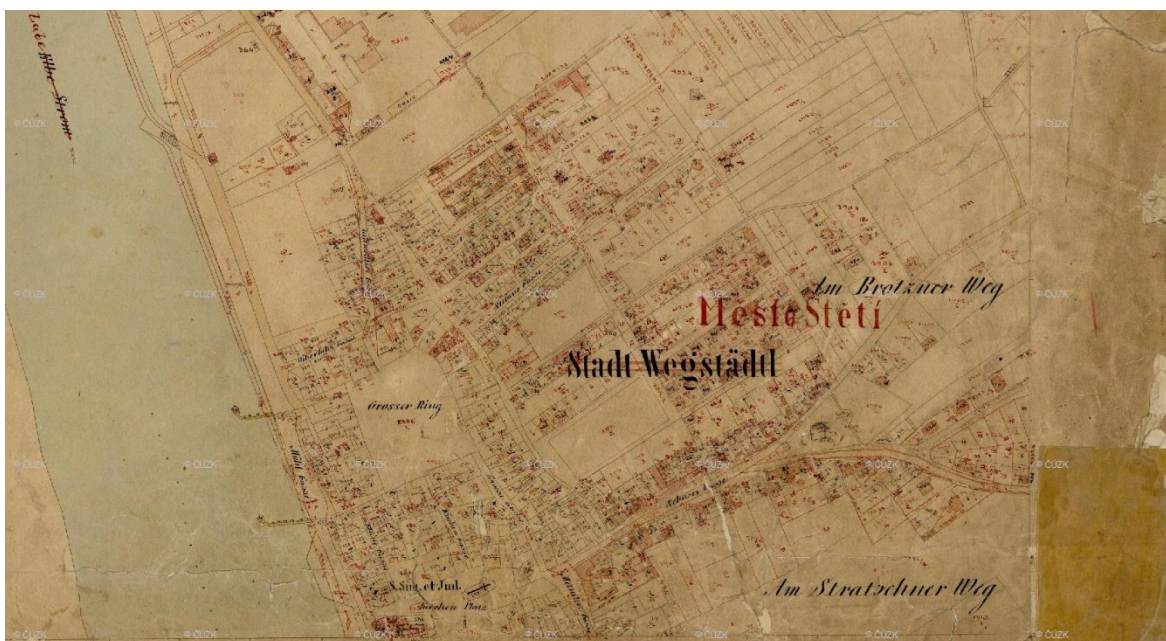
Mapa 4: Mapa Štětí z roku 1876 část 1. 261