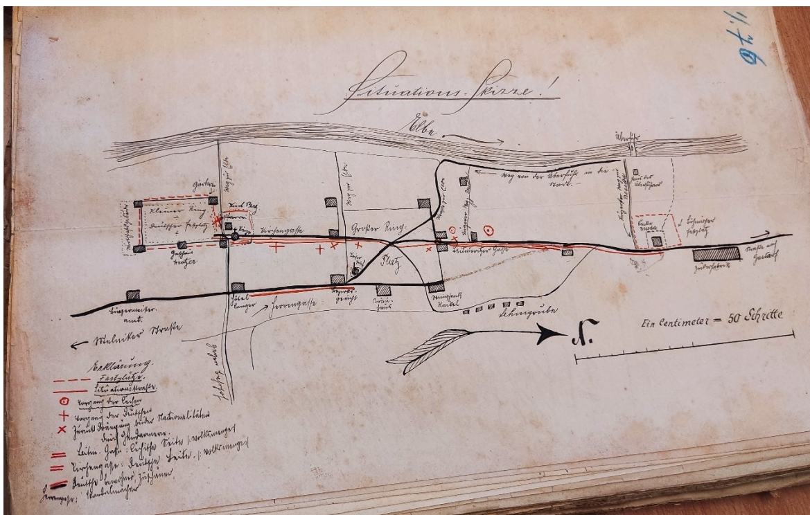
Mapa 6 Mapa z vyšetřování události z 19. července 1896. 263