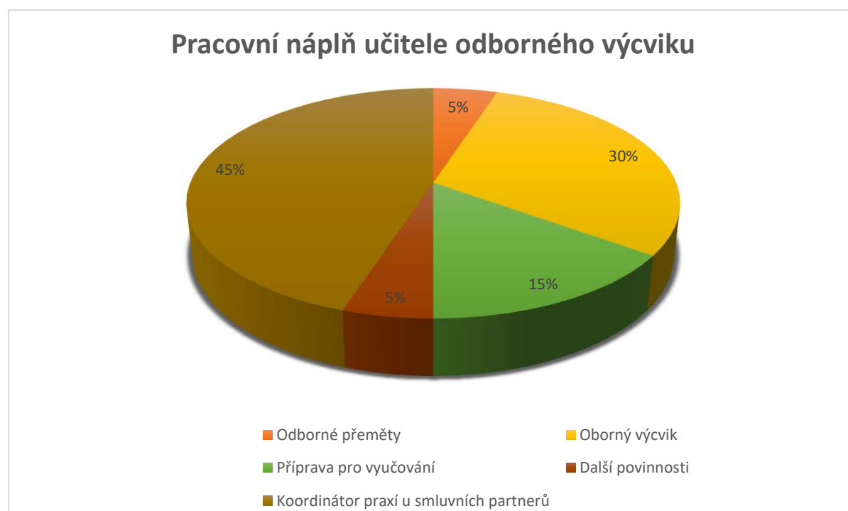
Graf 1 – Učitel odborného výcviku – pracovní náplň, vlastní zpracování

V rámci pedagogických pracovních činností jsem zvolil vlastní profesiogram, kde graf č. 1. konkrétně vyjadřuje v procentech pracovní náplň a tabulka níže vyjádření mé hodinové dotace za týden jako zaměstnance školy. Stručně zde charakterizuji své jednotlivé pracovní povinnosti, které součtem 40 hodin za týden splňují plný úvazek.