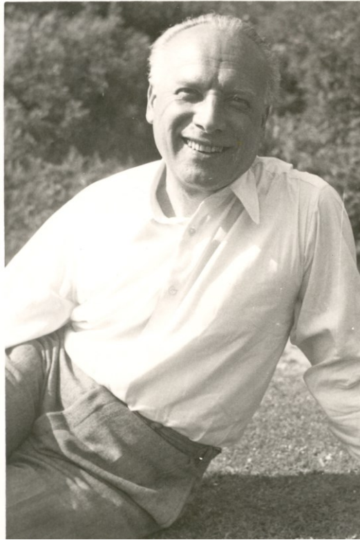
Obrázek 1: Přemysl Pitter, 1952 31