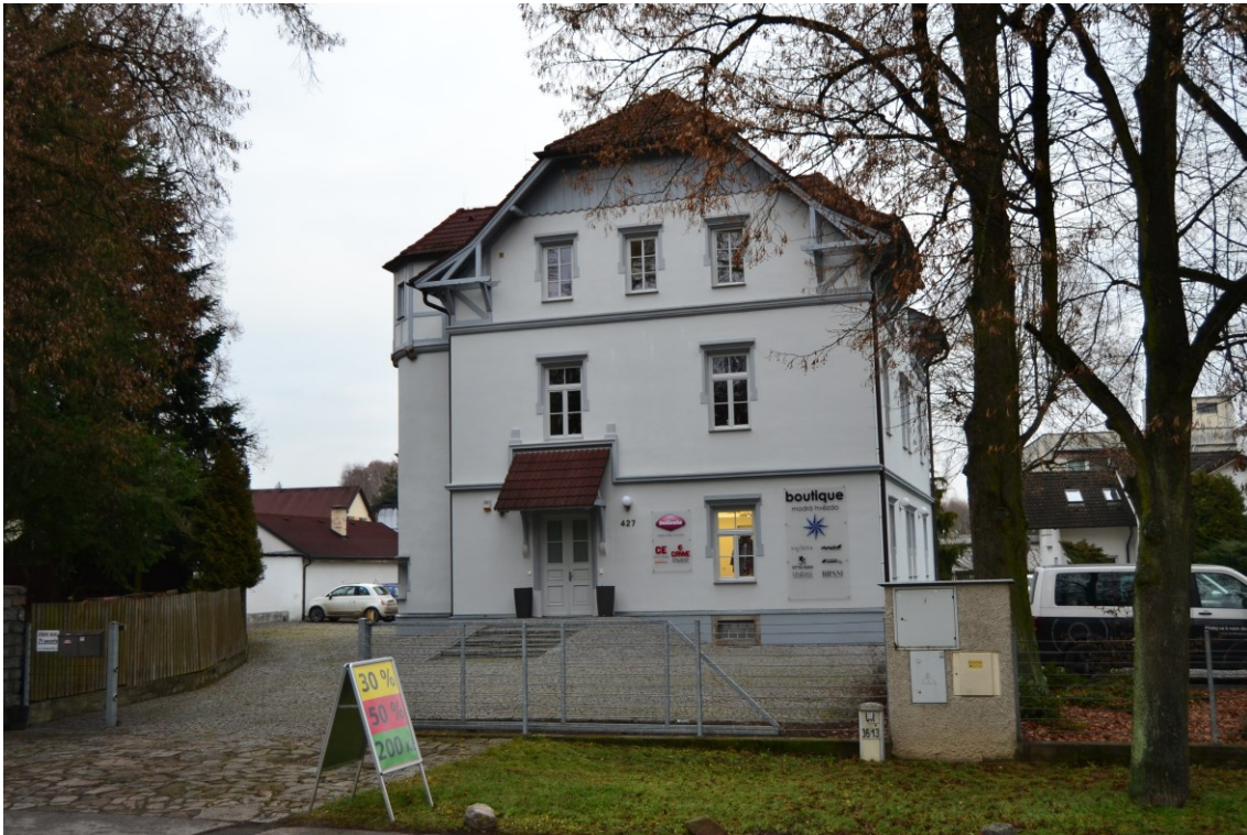
Obrázek 10: Lékařský dům v roce 2016