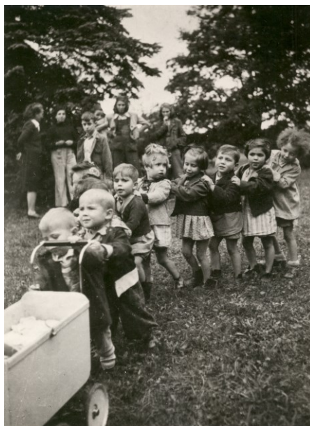
Obrázek 12: Štiřínské děti 210

Veškeré aktivity završovala nedělní shromáždění, toužebně očekávaná dětmi i vychovateli. Právě zde byl prostor k rozpravám a příležitost dětí setkat se s Přemyslem Pittrem. Vzpomínku na ně uchoval ve svých cenných zápiscích i Antonín Moravec: „Byly to chvíle plné radosti, a přece tu byly řešeny nejdůležitější problémy života. Jednou dala slova některé vzácné písně podnět k úvaze, jindy opět otázky chovanců určovaly náměty promluv, spojených s debatami. Chlapci měli zájem o nejrůznější otázky a záhady. Nebylo problému, o němž by se postupně nehovořilo, do poměru člověka k práci, k přírodě, k člověku, až po tajemství života po smrti a hledání a nalézání smyslu života. Nejožehavější problémy mladých mužů a žen, po jejichž vysvětlení hoši toužili, dovedl podat náš ředitel tak prostě a zanítit touhu po čistém životě.“ 209