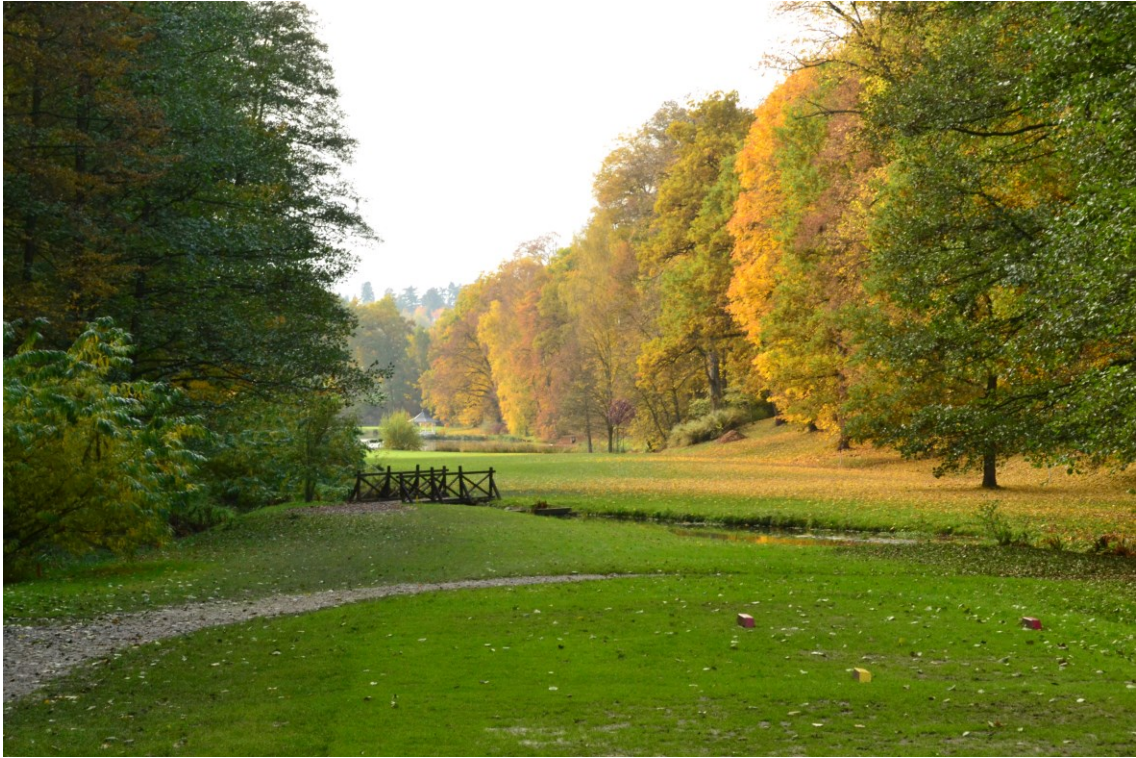
Obrázek 8: Zámecký park ve Štíříně, 2016