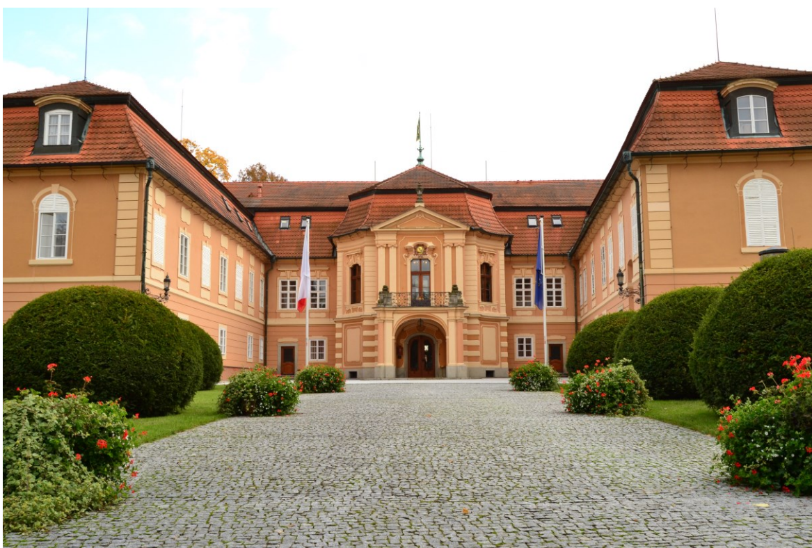
Obrázek 7: Zámek Štířín, 2016