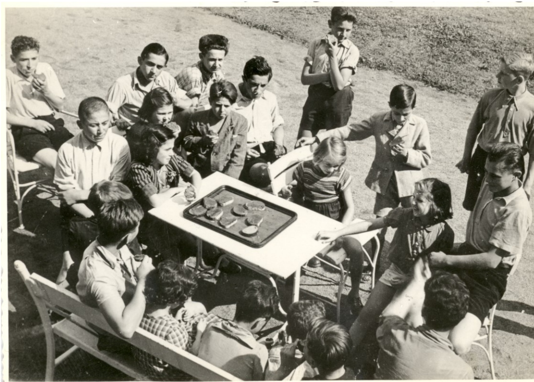
Obrázek 5: Děti z koncentračních táborů. Štířín, 1945 83