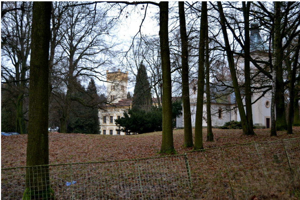
Obrázek 9: Zámek Kamenice skrytý v zámeckém parku, 2016