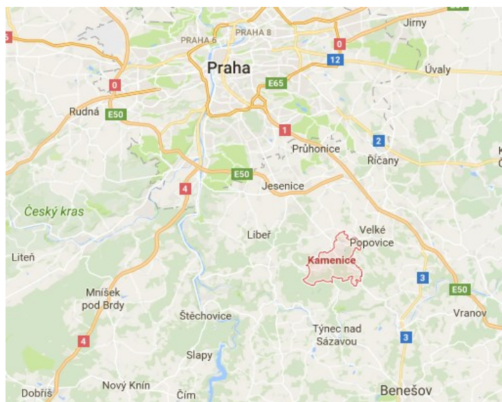
Obrázek 3: Obec Kamenice na mapě 46

Zámky obývalo brzy přes dvě stě dětí, zejména židovských, jejichž rodiče zemřeli v plynových komorách. „Na všech byly znát následky nesmírného tělesného a duševního utrpení. Bedlivá péče a láskyplná výchova dokázaly u nich opravdové znovuzrození.“ 45