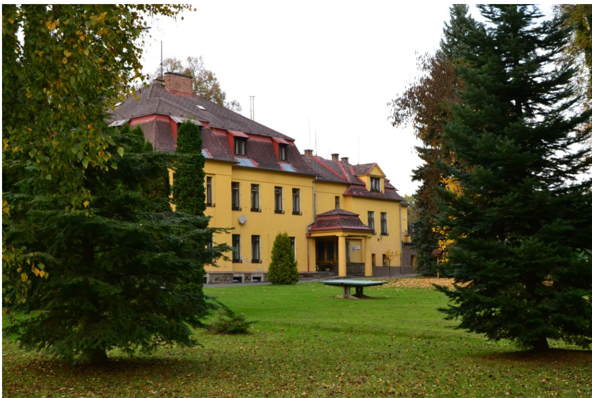
Obrázek 6: Zámek Olešovice, 2016