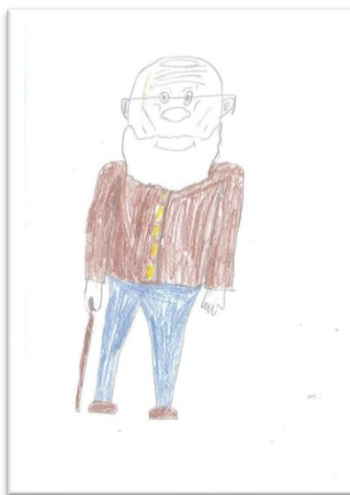
Obrázek 2: Obraz starého člověka dle Mikuláše

Se stářím se dle dětí pojí i mnohé zdravotní potíže, nedostatek energie, nemoci. Téměř polovina namalovala staré osoby s holí, některé děti do popisu zahrnuly i brýle, naslouchátko nebo berle. V odpovědích se objevovaly výrazy jako „ohrblý“ či „okulhaný“. I přes to, že staré osoby ve svém okolí (obvykle své prarodiče) většina označuje jako aktivní lidi, obecně staří jsou dle nich velmi pomalí, ubývají jim síly, nedokážou sportovat, mají křehká těla a chodí shrbení.