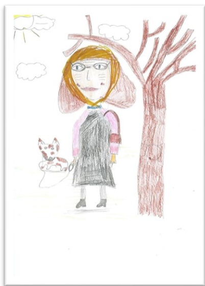
Obrázek 1: Obraz starého člověka dle Mariany

jsou úplně holohlaví. Muži mají vousy a knír, ženy nosí šátky. Dvě děti zodpověděly, že se jim staří zdají být menší, než jsou mladí lidé.