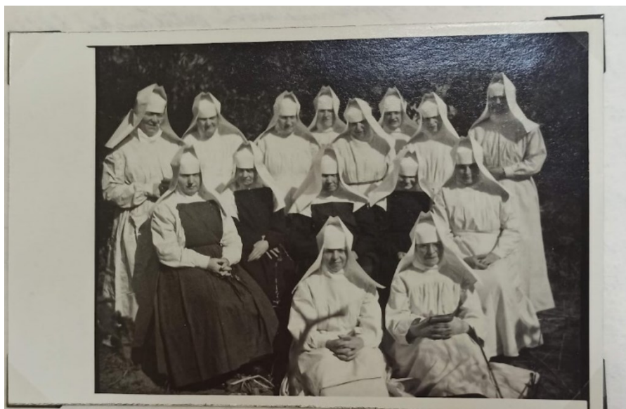
Obrázek 4: Sestry pracující v chorobinci (Kronika Milosrdných sester sv. Vincence, Strážnice)