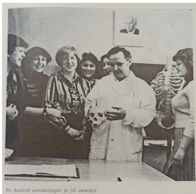
Obrázek 10: Výuka na škole (Melšová, 1983)