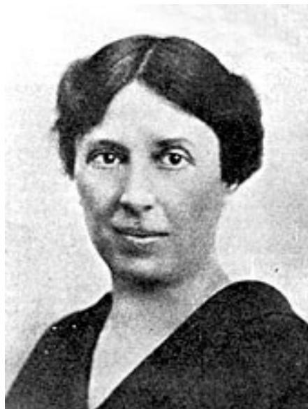
Obrázek 2: Alice Masaryková (Pražský hrad, 2023)