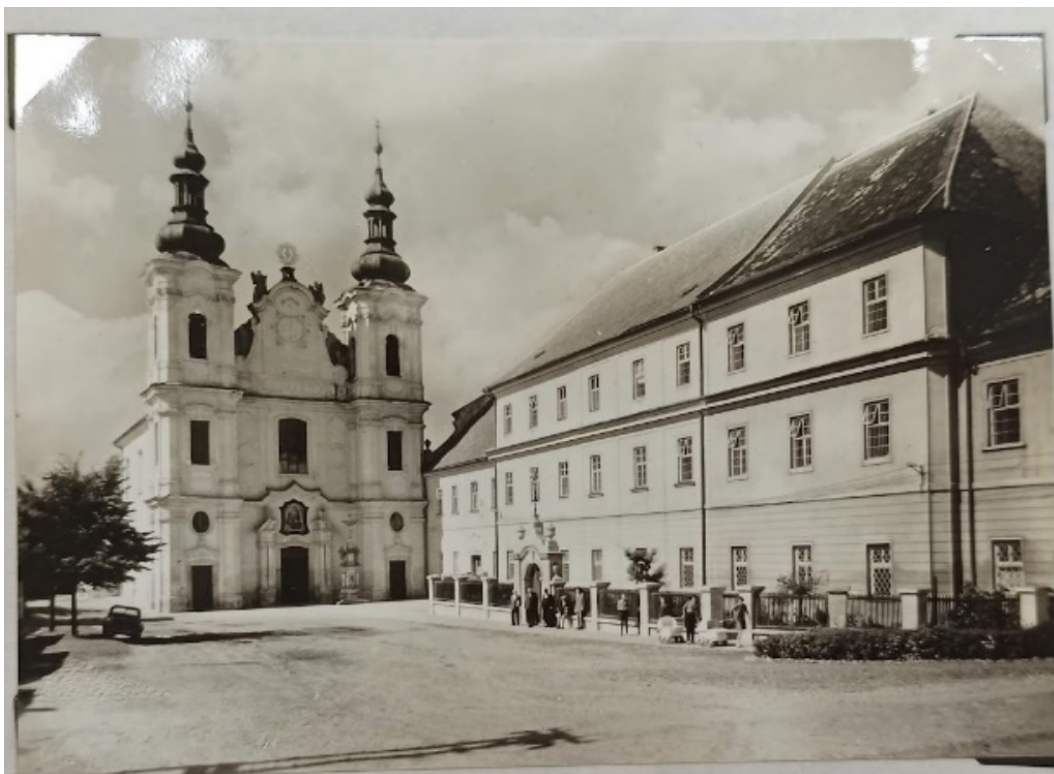
Obrázek 5: Chorobinec a kostel Panny Marie ve Strážnici (Kronika Milosrdných sester sv. Vincence, Strážnice)