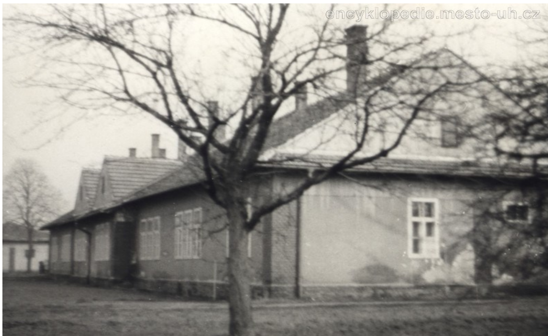
Obrázek 9: Stará budova školy v areálu nemocnice (Střední zdravotnická škola Uherské Hradiště, Purkyňova 49, 2017)