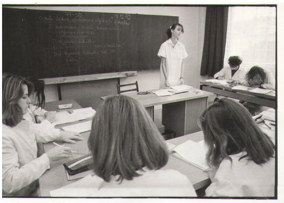
Obrázek 12: Výuka ve škole (Melšová, 1983)