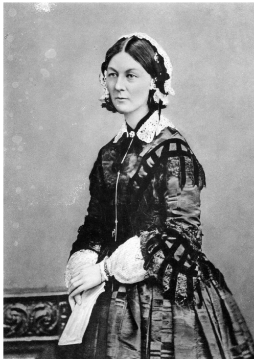
Obrázek 1: Florence Nightingalová (Time, 2020)