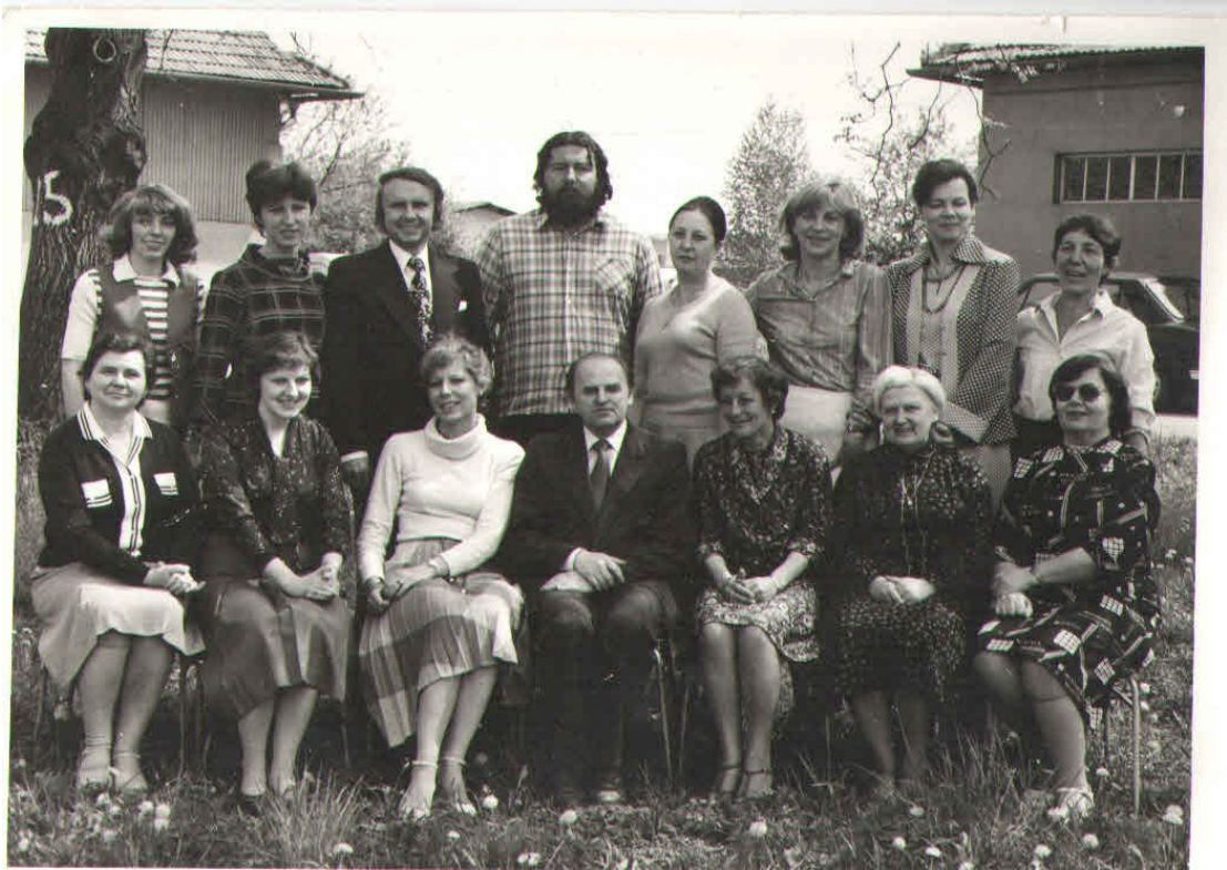
Obrázek 13: Učitelství sbor 1983 (Melšová, 1983)