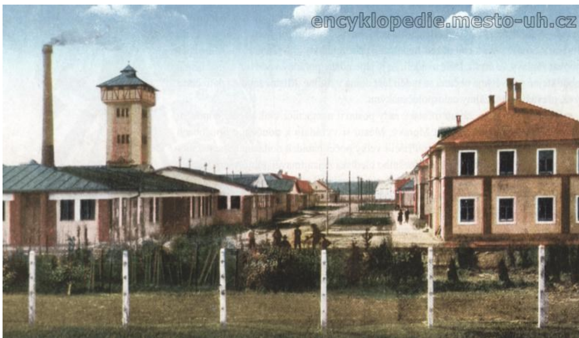
Obrázek 8: Zemská vychovatelna (Encyklopedie města Uherské Hradiště, 2018)