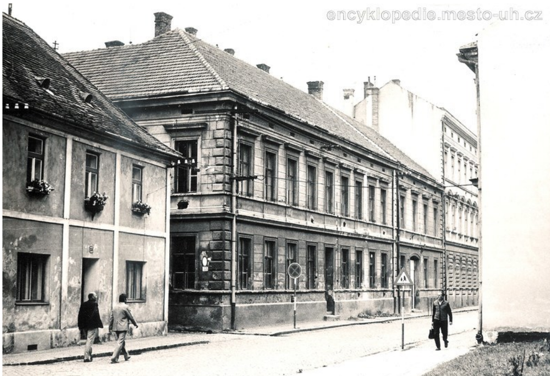
Obrázek 7: První sídlo školy ve Františkánské ulici (Odborná škola pro ženská povolání Uherské Hradiště, 2017)