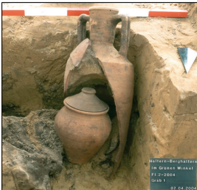
Obr. 3: Římské varné hrnce formy Haltern 57 využité jako cheruské pohřební urny. Nález z římského vojenského tábora Haltern.