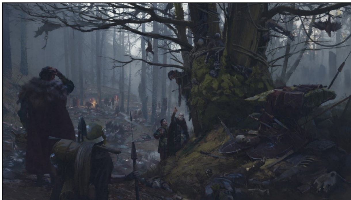
Obr. 13: Digitální umění: Germanicus na dějišti Varovy bitvy v roce 15 po Kr.