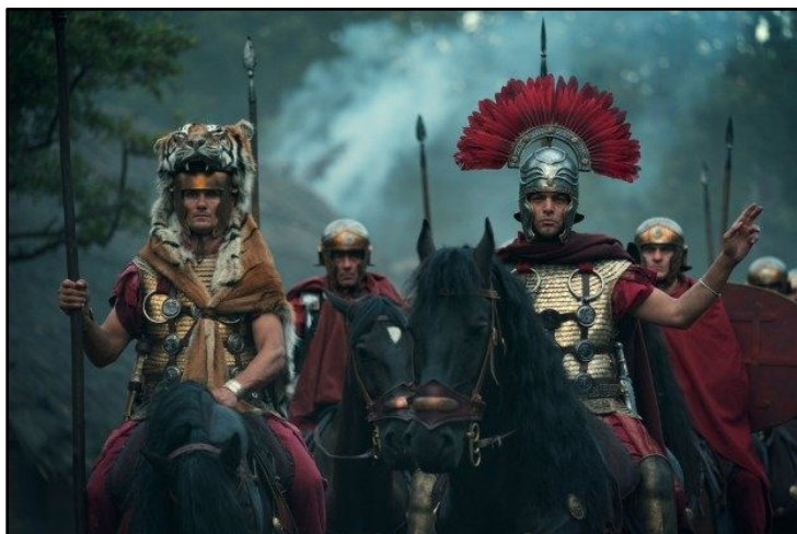
Obr. 8: Arminius jako náčelník kmene Cherusků.