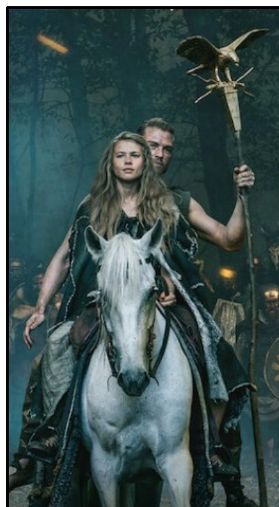
Obr. 12: Thusnelda a germánský bojovník držící ukořistěného orla legie.