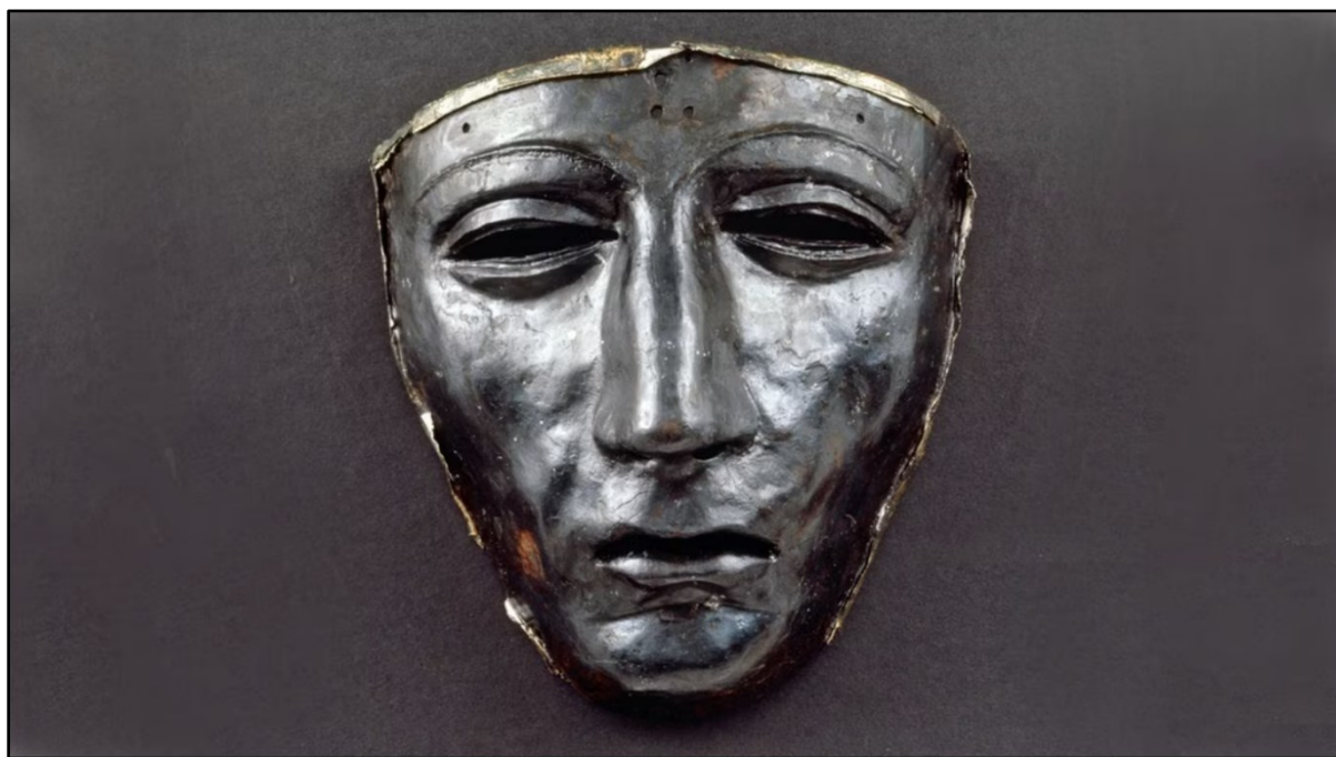
Obr. 4: Jezdecká maska nalezená na archeologickém nalezišti v Kalkriese u Osnabrückeru.