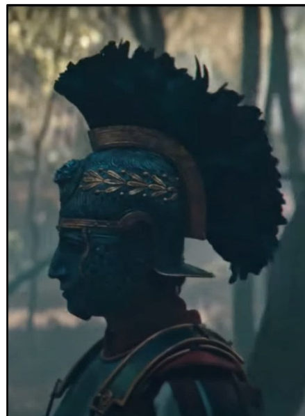
Obr. 6: Arminius v bitvě v Teutoburském lese.