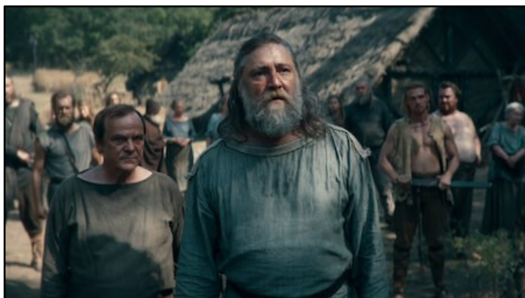
Obr. 11: Príslušníci kmene Cherusků (vlevo) a Brukerů (vpravo).