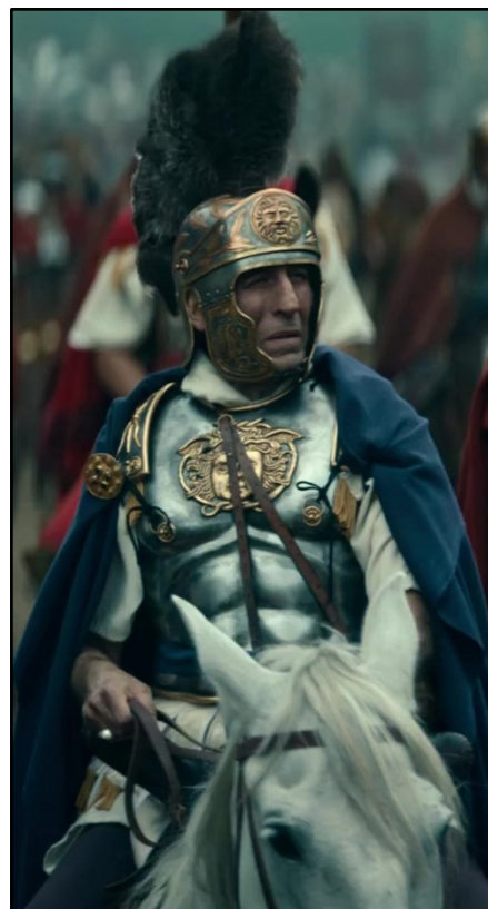
Obr. 9: Publius Quinctilius Varus.