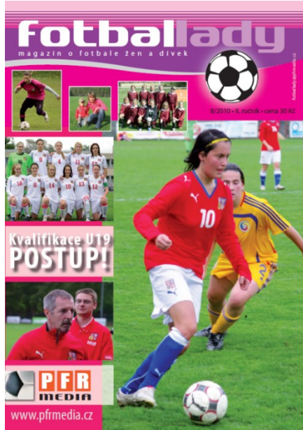
Obrázek 6; Obálka Fotballady 2010

Srpnové vydání časopisu Fotbal lady z roku 2010