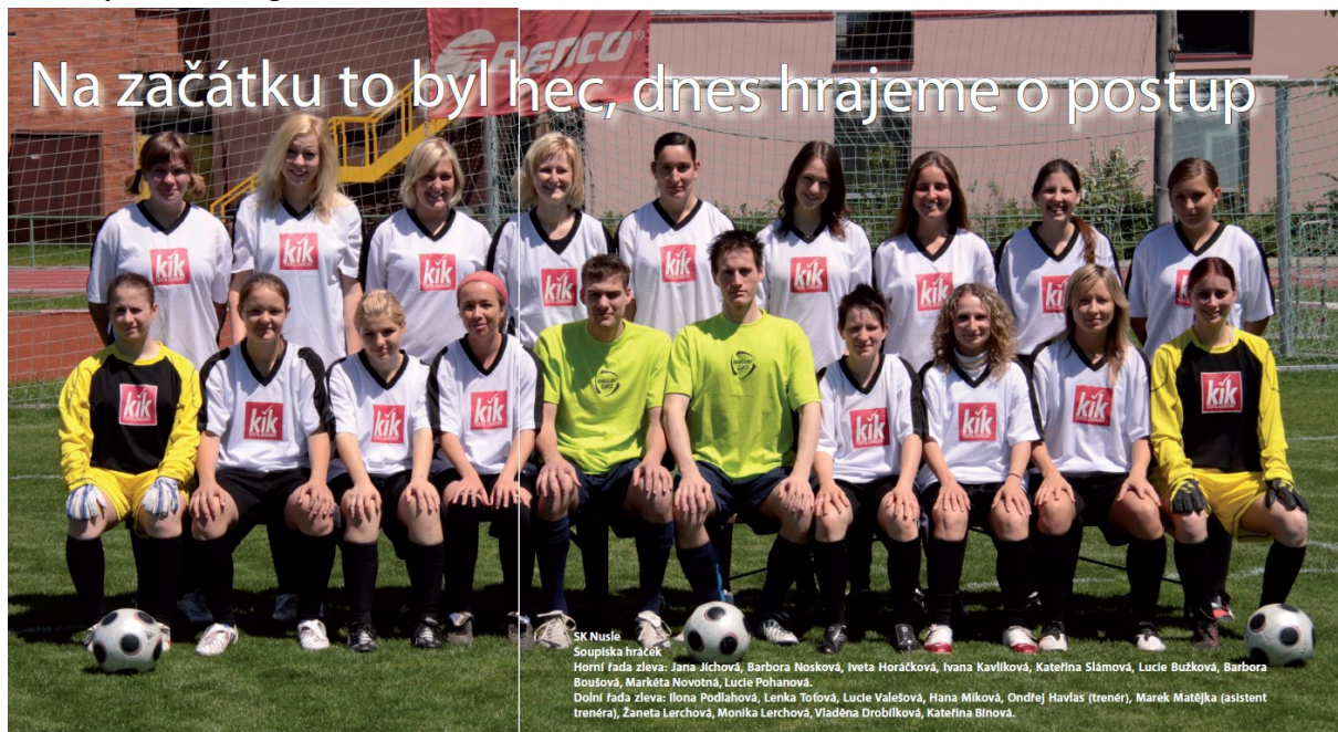
Obrázek 8; SK Nusle