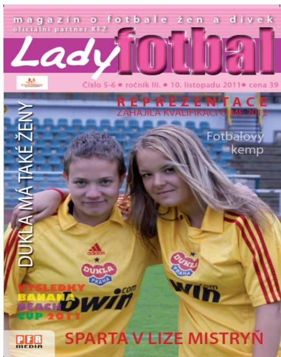
Obrázek 7; obálka LadyFotbal 2011

10.11.2011 obálka časopisu Fotbal lady na hlavní stránce hráčky klubu FK Dukla Praha