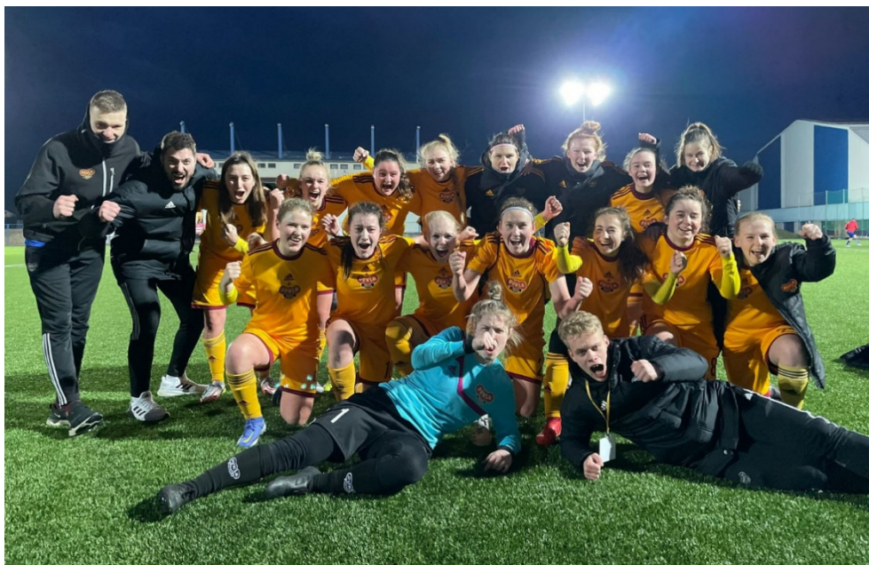
Obrázek 12; Postup do semifinále FKD

1. 3. 2022 Radost z postupu do semifinále poháru žen. Duklačky porazili 1. FC Slovácko v poměru 1:2 a postoupily vůbec poprvé do této fáze soutěže.