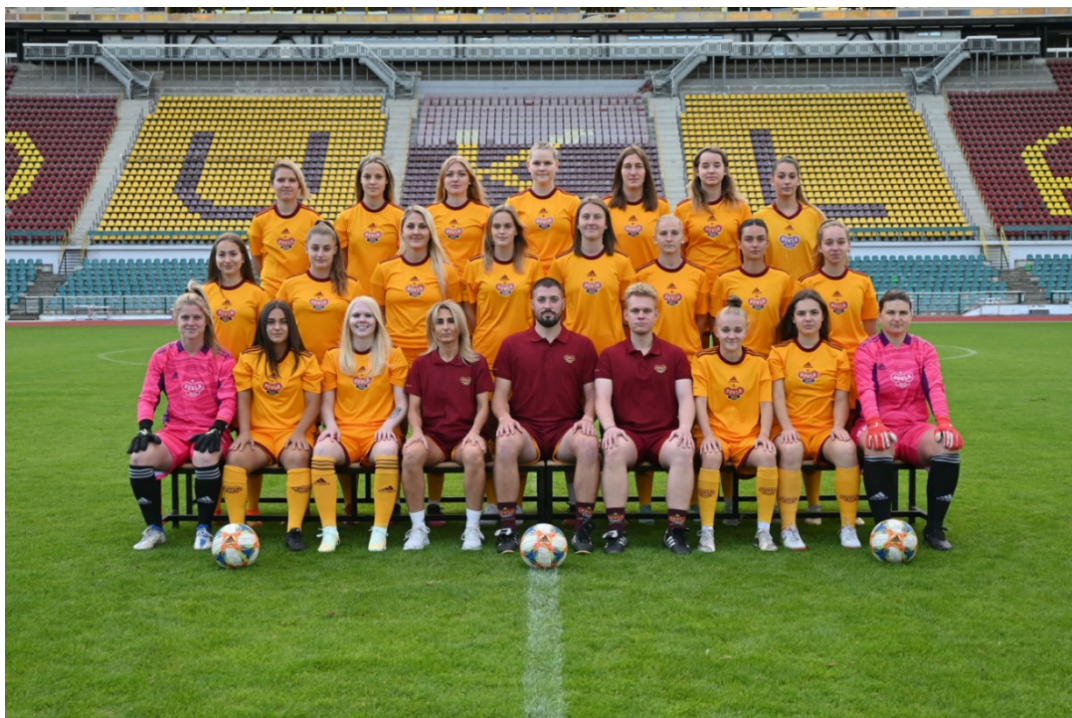
Obrázek 13; Týmová fotografie FKD 2022/23

Poslední týmová fotografie týmu FK Dukla Praha pro sezonu 2022/2023