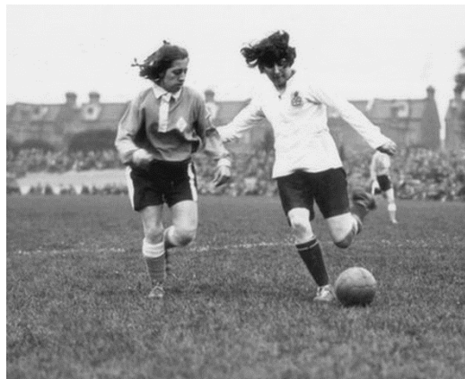
Obrázek 7; Lily Parr

Nejvýznamnější fotbalistka raných začátků ženské kopané se narodila jako čtvrté dítě ze sedmi. Její matka byla na všechno doma sama a otec pracoval v nedaleké sklárně. Už jako dítě odmítala zájmy, které byly tradičně nabízeny malým holčičkám. Více ji zajímaly ty mužské, mezi které patřil i fotbal. (23)