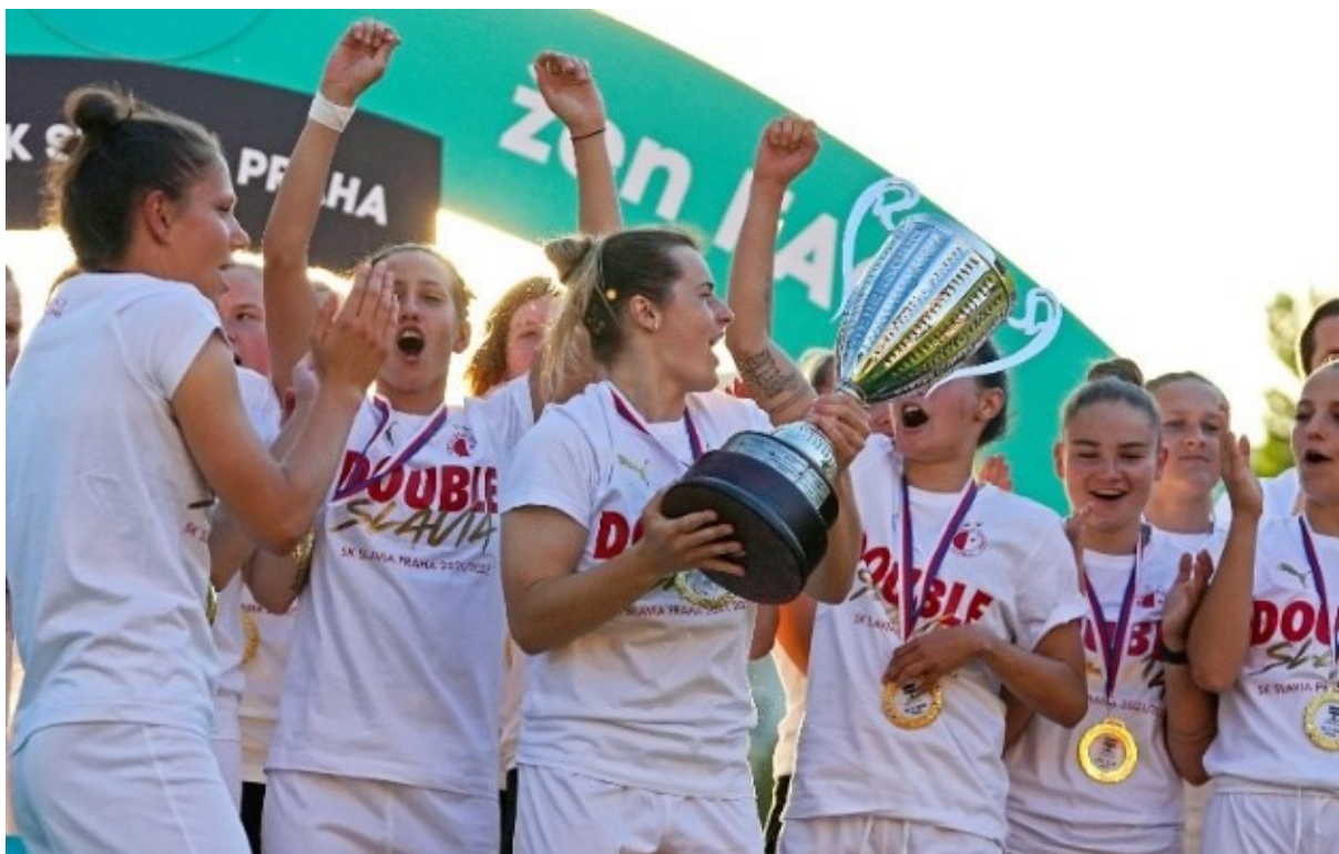
Obrázek 3; oslava výhry v ligovém poháru

Fotbalistky Slavie v letech 1993/1994 získaly v pravidelné ženské soutěži celkem 8 titulů. (21)