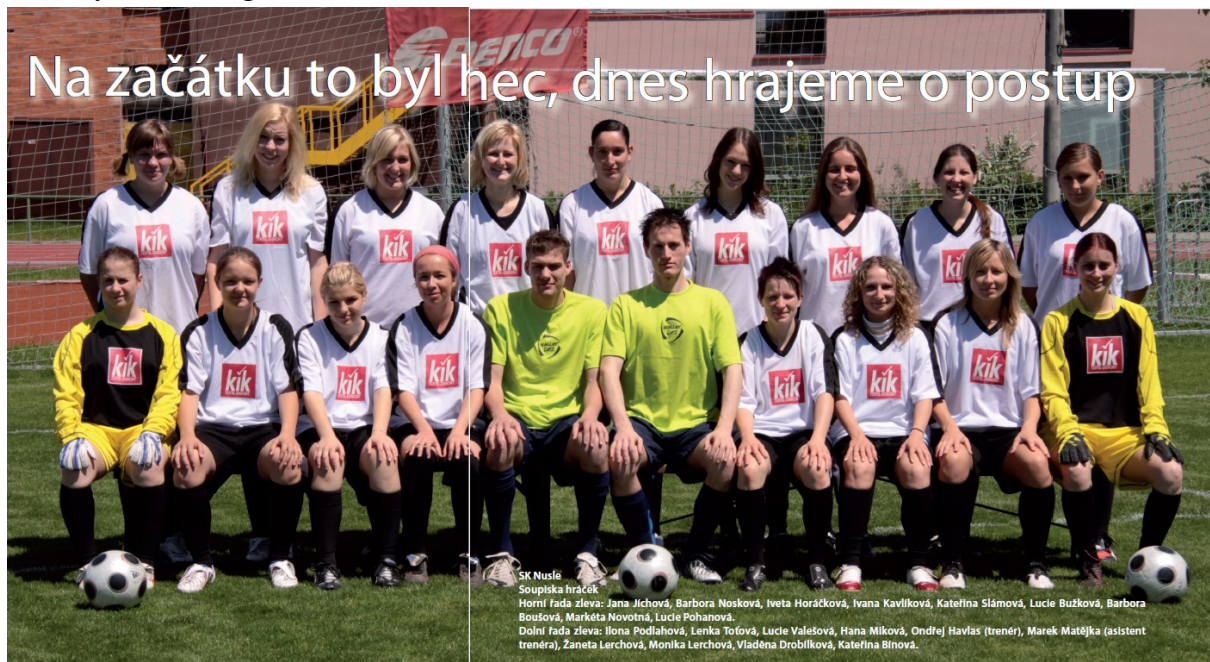
Obrázek 17; SK Nusle; zdroj: časopis Fotballady vyd. 10-11 2010