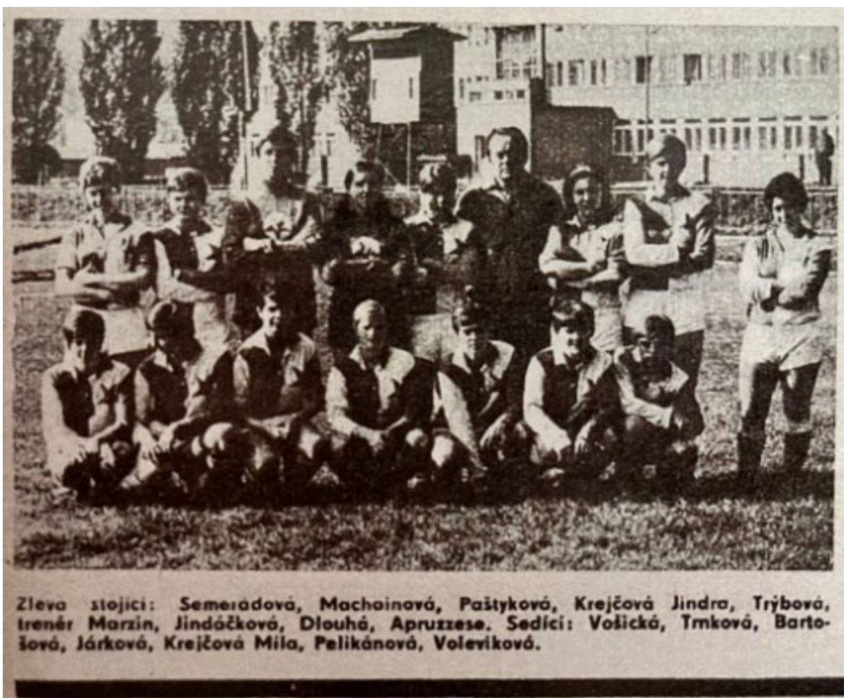
Obrázek 2; Slavia Praha ženy

V novodobé historii slávistky stále patří mezi nejlepší týmy v České republice. V sezóně 2021/2022 vyhrály „double“ 9 . Na double má podíl i bývalý hráček pražské Dukly Michael Kolomazník. Toho střídá v roce 2023 legenda pražské Slávie Karel Piták, který dokázal s ženami postoupit do skupinové fáze Ligy mistryň. Ta patří na pomyslný vrchol klubových fotbalových soutěží.