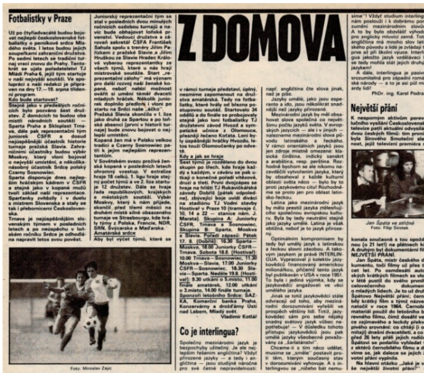
Obrázek 14; Mladý svět č. 33/1990