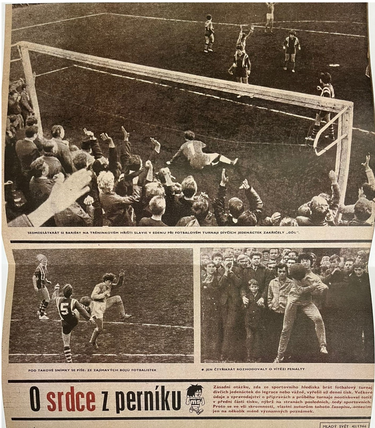
Obrázek 13; Mladý svět 43/1966

Report z prvního turnaje „O perníkové Srdce Mladého světa“ z roku 1966