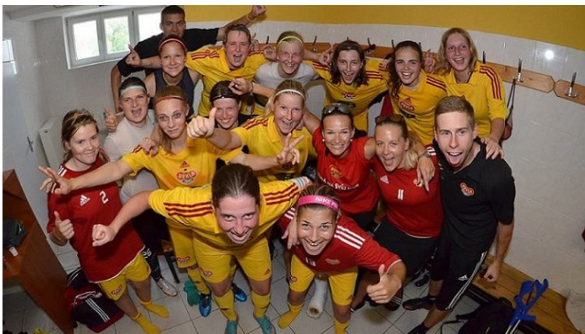
Obrázek 19; Postupová fotografie FKD