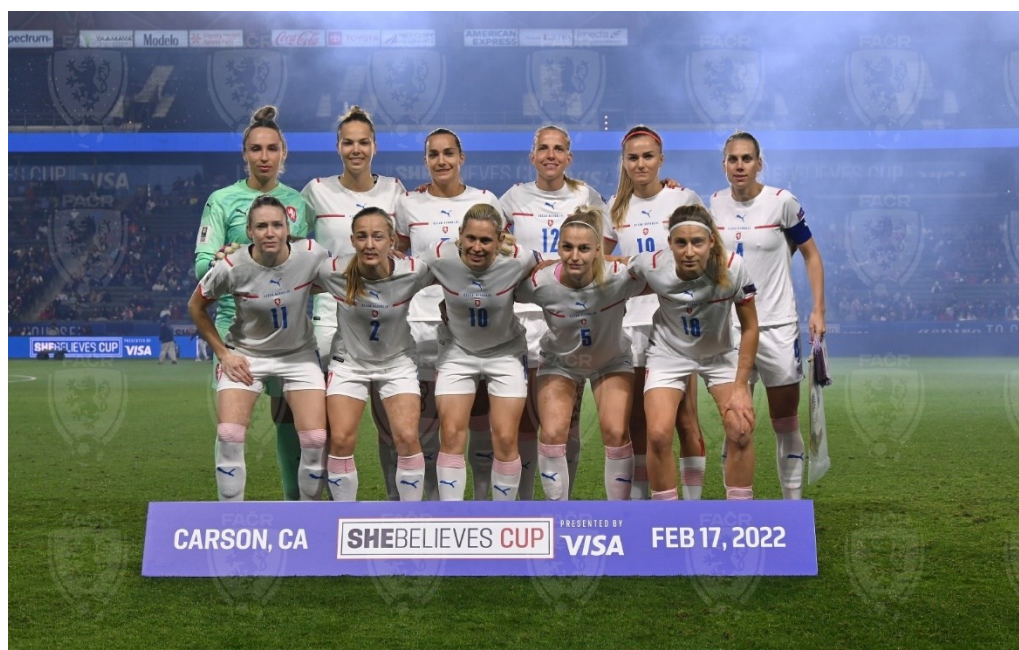
Obrázek 6; Základní sestava proti USA z turnaje SheBelieves Cup 2022