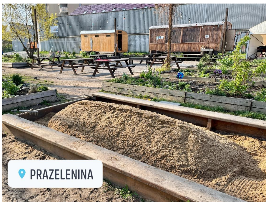
Obrázek 1 Komunitní zahrada Prazelenina 11

„Nevěříte, že máte moc ovlivnit dění kolem nás? Odhodlejte se namísto pasivní kritiky velkého světa k aktivní účasti na dění kolem nás“.