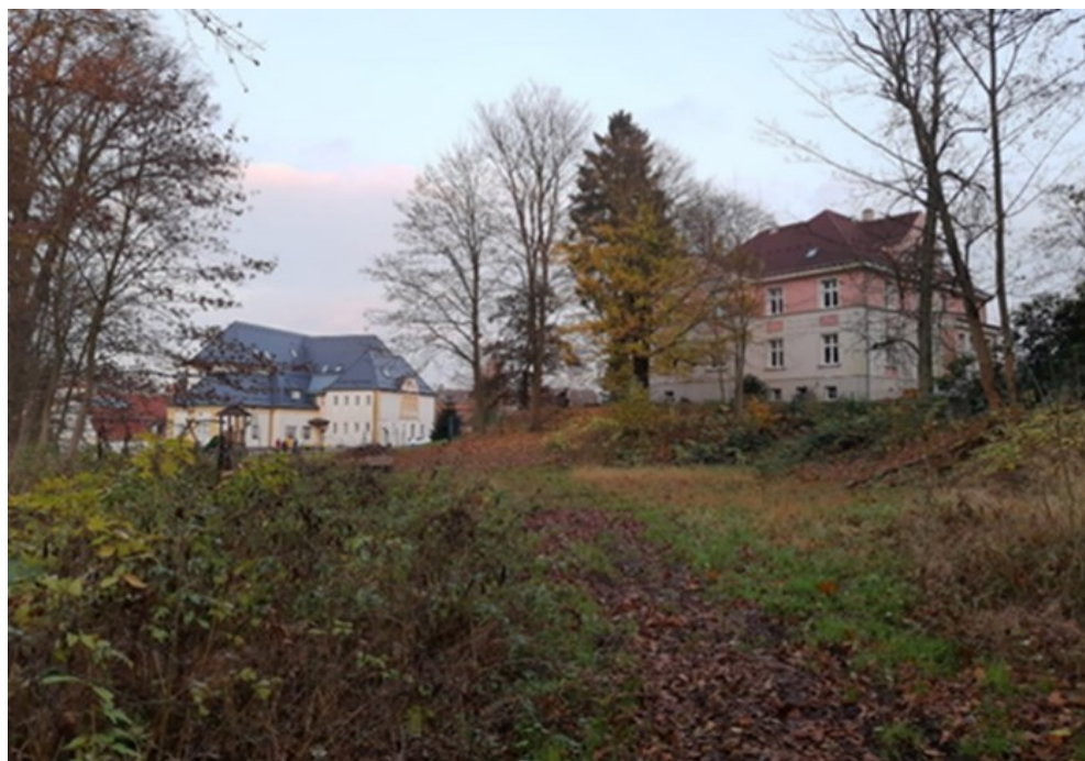
Obrázek 7 KZ při počáteční realizaci 31