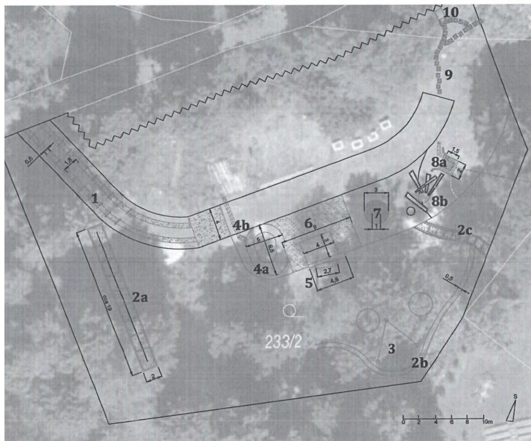
Obrázek 12 Návrh úprav zahrady