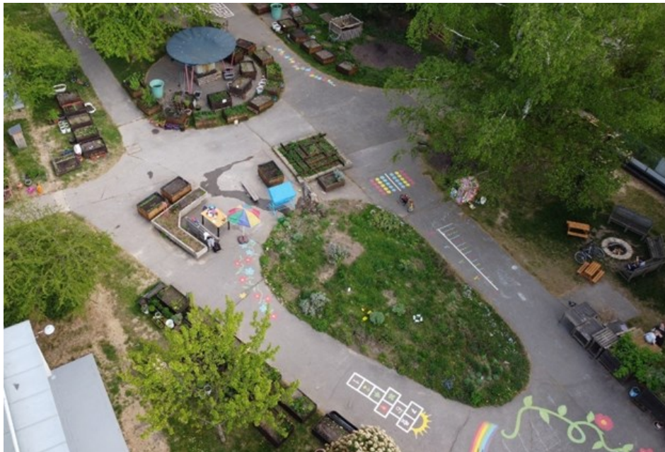
Obrázek 2 Komunitní zahrada Vidimova