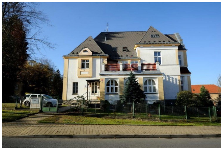
Obrázek 4 DD Krásná Lípa 28

Dětský domov Krásná Lípa je příspěvkovou organizací Ústeckého kraje a nachází se ve šluknovském výběžku s datem působení již od roku 1963. Celý název organizace zní Dětský domov a Školní jídelna Krásná Lípa. Základním posláním domova je zabezpečení péče o děti dle zákona č. 109/2002 Sb. o školských zařízeních pro výkon ústavní výchovy a ochranné výchovy. Děti navštěvují mateřskou školu a základní školu ve městě. Ředitelkou domova je PhDr. Mgr. Sofie Wernerová Dimitrovová. V domově se nachází 24 dětí, kooperujících ve třech rodinných skupinách. Domov se nachází v již zmíněné budově vilového typu, která leží v blízkosti centra Krásné Lípy a zároveň se za budovami rozprostírá městský park. Část parku byla právě využita k založení komunitní zahrady. Domov působí rodinným dojmem (viz. obrázek číslo 4).