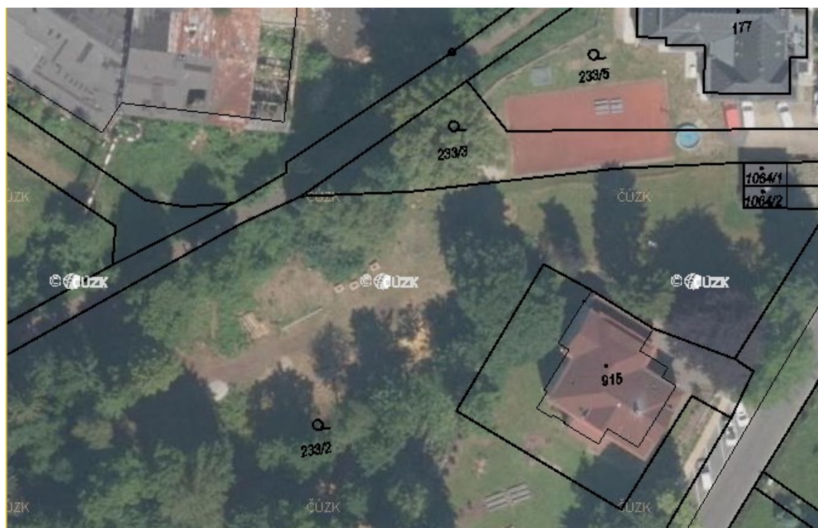
Obrázek 5 KZ na parcele číslo 233/2

Myšlenka KZ DivyZná vznikala postupně. Hlavním výchozím bodem bylo dobré umístění domova vedle parku. Zanedbávaný kout městského pozemku vybízela k založení KZ a město, kterému pozemek patří, jej ochotně poskytl. Zahrada se nachází na parcele číslo 233/2 s rozlohou 8 100 m 2 , viz. obrázek číslo 5. 29 Přibližně kolem 3000 m 2 je využito jako komunitní zahrada. Na záznamu ČÚZK je vidět již několik záhonů. Obrázek číslo 6. a 7. pak znázorňují zahradu před realizací a při počáteční realizaci.