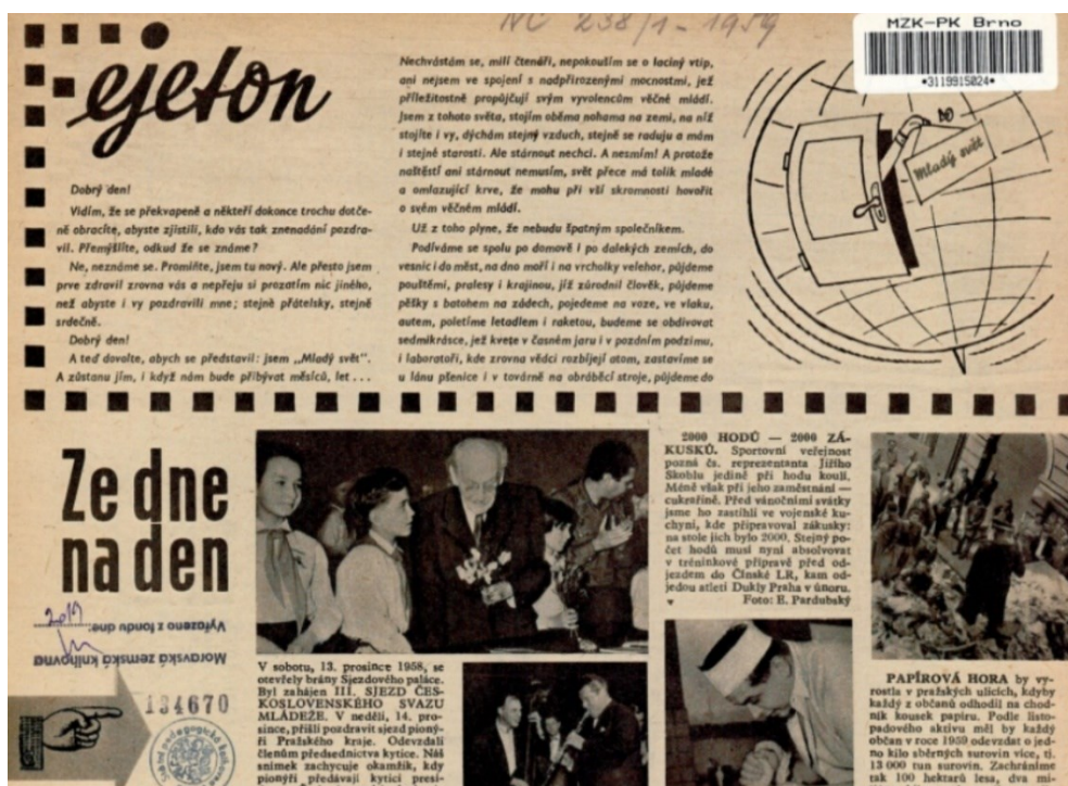
První číslo Mladého světa s pozdravem čtenářům.

Poměrně trefně zaměření Mladého světa vystihuje pozdrav čtenářům z prvního čísla: „Dobrý den! Vidím, že se překvapeně a někteří dokonce trochu dotčeně obracíte, abyste zjistili, kdo vás tak znenadání pozdravil. Přemýšlíte, odkud že