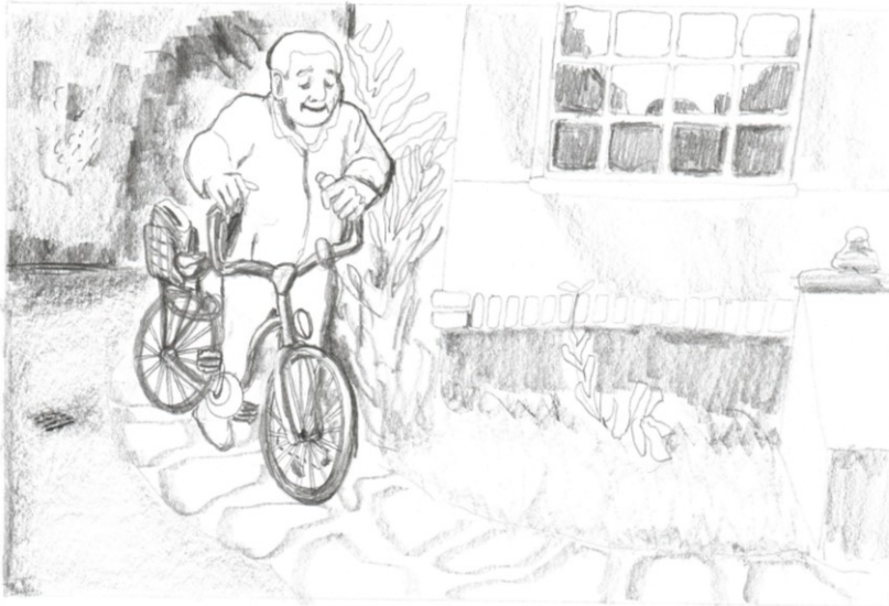
Obr. 1: kresba tužkou, vyobrazení dědečka s kolem.