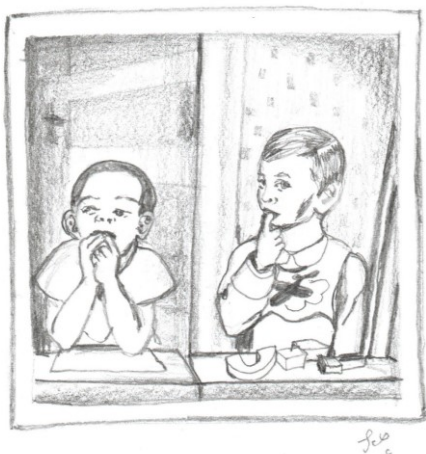
Obr. 10: kresba tužkou, vyobrazení dětství dědečka s jeho kamarádkou.