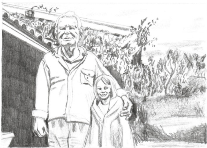
Obr. 5: kresba tužkou, vyobrazení dědečka se mnou.