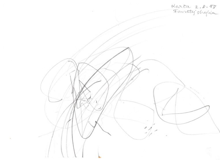
Obr. 8: kresba tužkou, moje dětská tvorba.