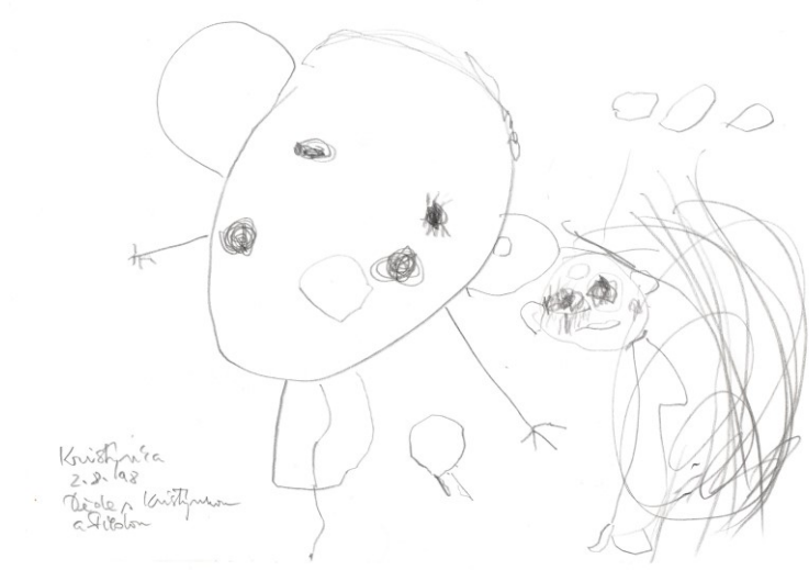
Obr. 7: kresba tužkou, dětská tvorba sestřičky Kristýny.