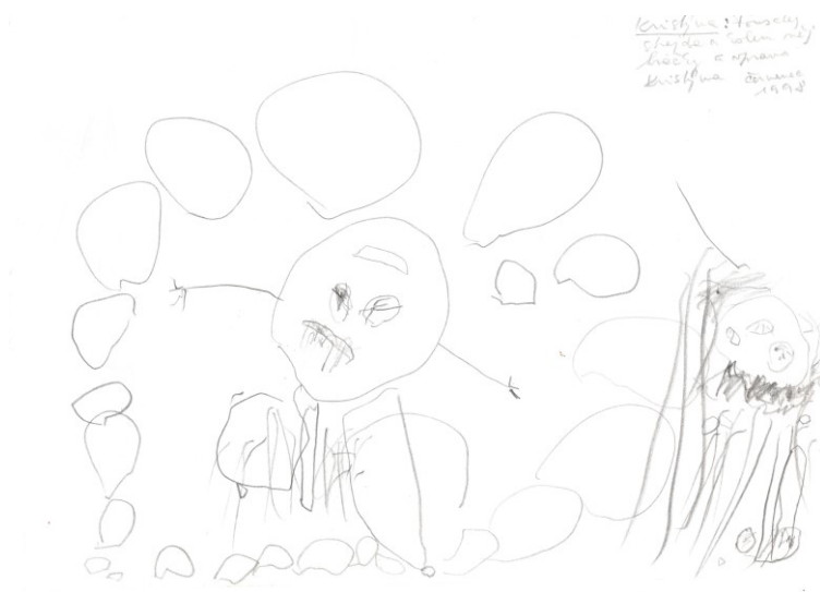
Obr. 6: kresba tužkou, dětská tvorba sestřičky Kristýny.