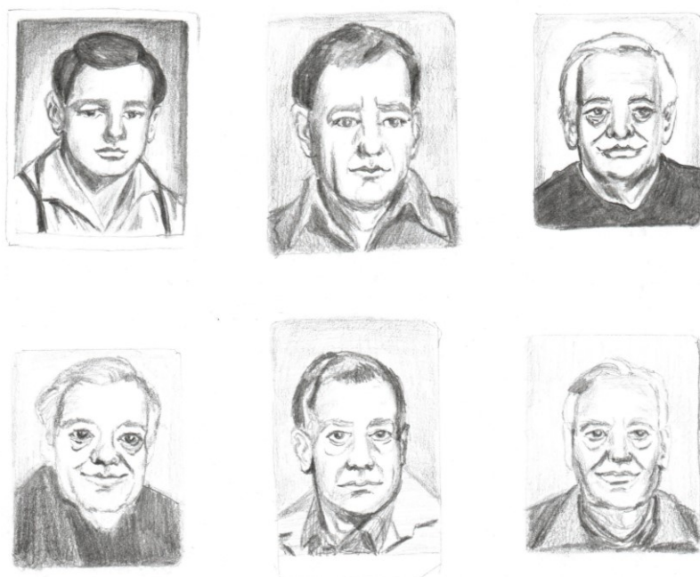
Obr. 2: kresba tužkou, vyobrazení dědečka na občanských průkazech.