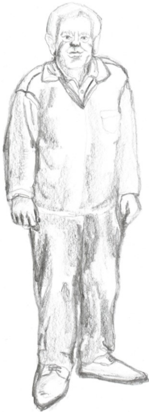
Obr. 3: kresba tužkou, vyobrazení dědečka a jeho postoje.