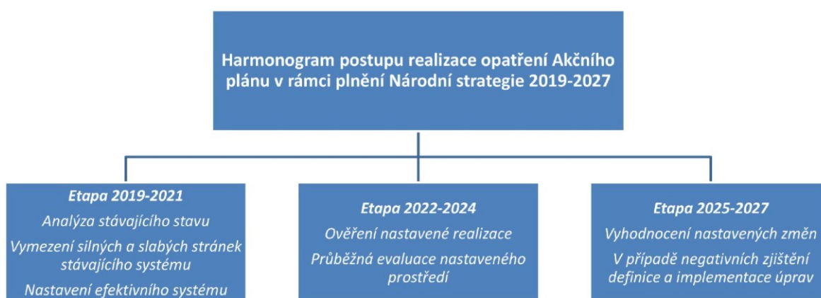
Tabulka č. 1 – Harmonogram postupu realizace opatření Akčního plánu (Zdroj: Akční plán primární prevence 2019-2021)

Dalším podkladem pro tvorbu té současné strategie byl závěr ze SWOT analýzy primární prevence rizikového chování, realizované krajskými koordinátory prevence ve spolupráci