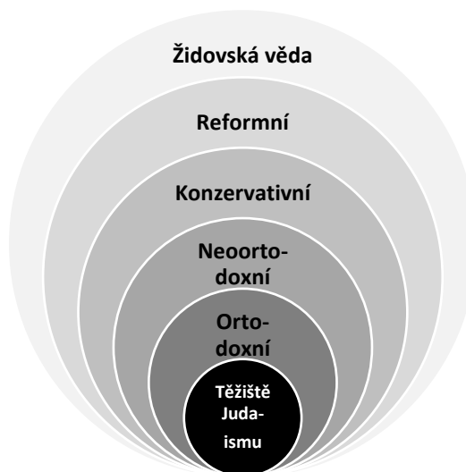
Obrázek č.3 Proudý Judaismu v 19. století

Následující obrázek je jakýmsi pokusem o grafické vyjádření pochopení situace v rabínském judaismu ve zkoumaném období. Těžiště rabínského judaismu zahrnuje úplný souhrn židovského učení obsaženého v Psaném Zákoně v Bibli, Ústním Zákoně v Mišně a Gemaře, společně