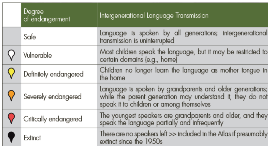
Obrázok č. 1: Stupne vitality jazyka podľa kritéria medzigeneračného prenosu (UNESCO, 2011)

pre vzdelávanie v jazyku a gramotnosť. Štádiá vitality na základe medzigeneračného prenosu sú uvedené v tabuľke (Moseley, 2010; UNESCO, 2011).