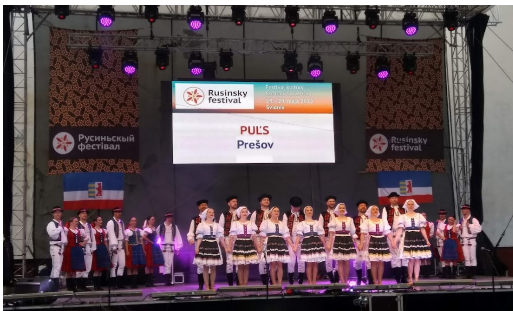
Obrázok č. 8: Vystúpenie folklórneho súboru PULS na Rusínskom festivale v roku 2022

Prvým podujatím, ktoré zorganizovala Okresná organizácia ROS vo Svidníku bol Betlehemský večer (po rusínsky Віфлеємський вечір/ Viflejemskej večur). Prvýkrát bol organizovaný v decembri 1993. Prvotným úmyslom bolo vytvorenie kultúrneho programu, v ktorom by sa kompletne využíval iba rusínsky jazyk – pri speve i konferovaní, zoznámiť mládež s koledami, piesňami a vianočnými zvykmi Rusínov a prepojiť ich tak so znalosťami staršej generácie. V súčasnosti sú medzi približne 200 účinkujúcimi deti z materských a základných škôl, sólisti a spevácke skupiny z mesta i širšieho okolia. Koncert je vysoko navštevovanou udalosťou, čoho dôkazom je pripravovaný jubilejný 30. ročník (Stronček, 2010).