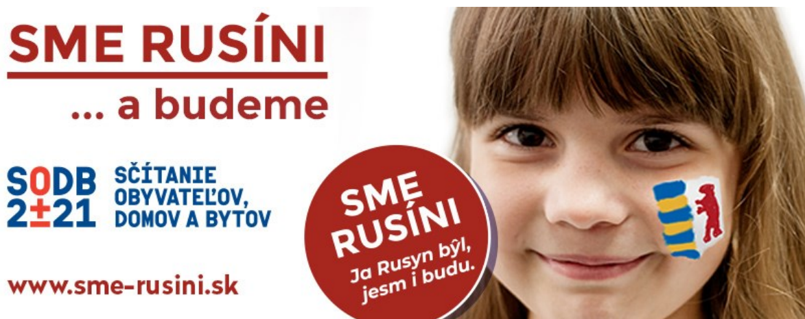
Obrázok č. 6: Plagát ku kampani „Sme Rusíni“ (Rusíni Slovenska, 2020)