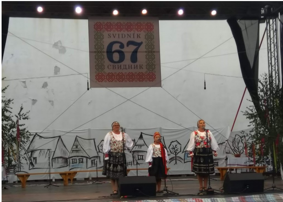
Obrázok č. 9: Vystúpenie časti folklórnej skupiny Poľana Jarabina na Slávnostiach kultúry Rusínov-Ukrajincov Slovenska v roku 2021

Rusínska vatra v Malom Lipníku (okres Stará Ľubovňa) je festival organizovaný OZ molody.Rusyny od roku 2010. Je to dvojdňové podujatie organizované počas jedného letného víkendu. Ide o „sesterské“ podujatie Lemkovskej vetry v poľskej Žduni. Spočiatku boli medzi vystupujúcimi hlavne kolektívy z regiónu Zamaguria. Postupom rokov prichádzali aj účinkujúci z celého regiónu Rusínov. Súčasťou programu sú hudobné vystúpenia, prednáška a beseda aj škola tanca. Vyvrcholením celého programu je pálenie vetry a ľudová zábava. Hoci ide o relatívne mladé podujatie, organizátori majú ambíciu vytvoriť z festivalu tradičnú súčasť leta na Zamagurí (Molody Rusyny, 2022).