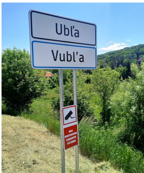
Obrázok č. 7: Ukážka dvojazyčného značenia obce Ubl'a

Vláda tiež v maximálnej miere poskytuje relevantné informácie v jazyku menšín internetovou formou. Či už prostredníctvom stránky Úradu splnomocnenca vlády SR pre národnostné menšiny, alebo pomocou internetového právneho a informačného portálu MV SR, kde sú zverejnené vybrané právne predpisy v jazykoch národnostných menšín. Pre transparentné poskytovanie informácií v jazyku národnostných menšín a kvôli udalostiam posledných rokov, bola vytvorená aj rusínska verzia stránky korona.gov.sk , ktorá poskytovala všetky dôležité a aktuálne informácie o ochorení COVID-19 a o prijímaných opatreniach.