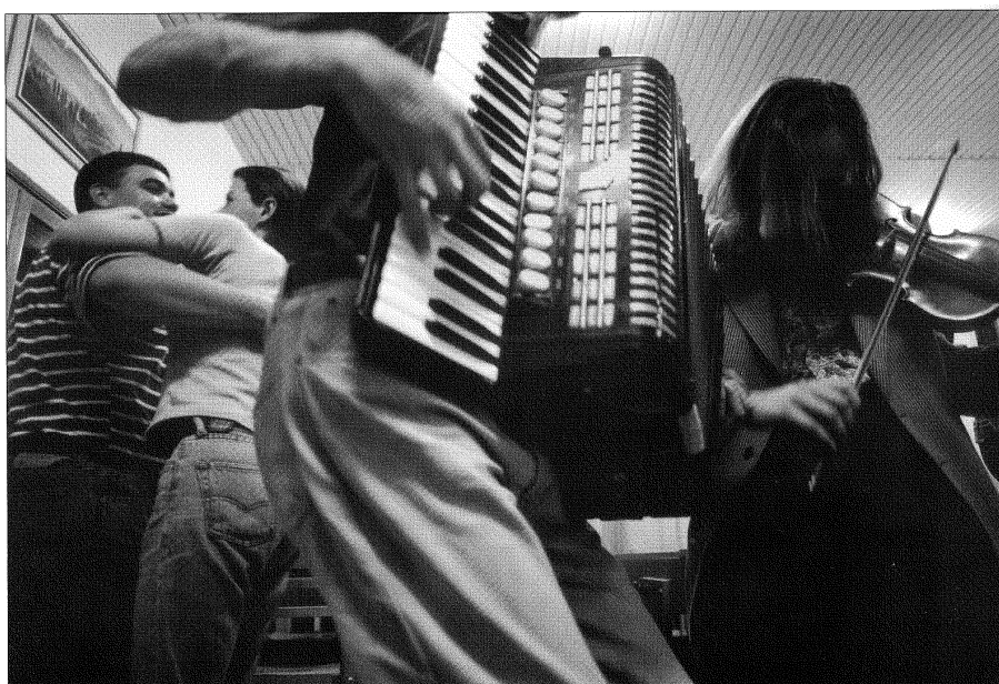
Obrázok č. 5: Zábava v Mikovej, 29. mája 1998 (autor Tomáš Leňo, Leňo 2000)