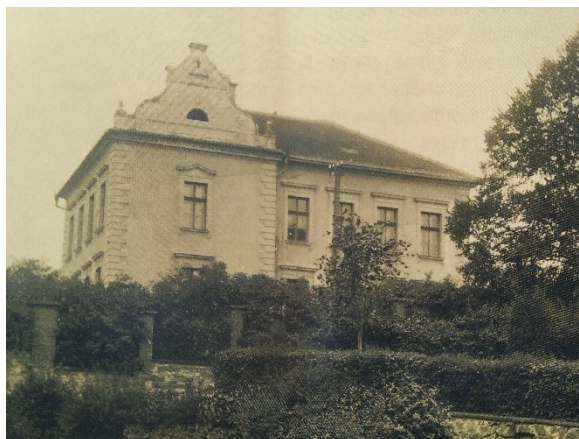
Obr.3 – druhá budova školy (pamětník I.K.)

strany učitelů a školní obce pořízeny až v roce 1908, na počest šedesátého výročí místní školy. V tom roce byly také opraveny hromosvody, renovovány záchody a pořízeny posunovací tabule, které nahradily ty nasazené na trojnožce. (Kronika obecné školy v Rynholci 1848-1933)