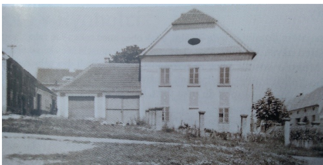
Obr.1 – první budova školy

Učit v pronajaté budově nebylo ideální z několika důvodů, které byly a jsou logické i z aktuálního pohledu. Stav budovy a třídy se nemůže bez souhlasu majitele měnit a uzpůsobovat a pronájem může kdykoliv skončit. A tak obec roku 1849 započala se stavbou školní