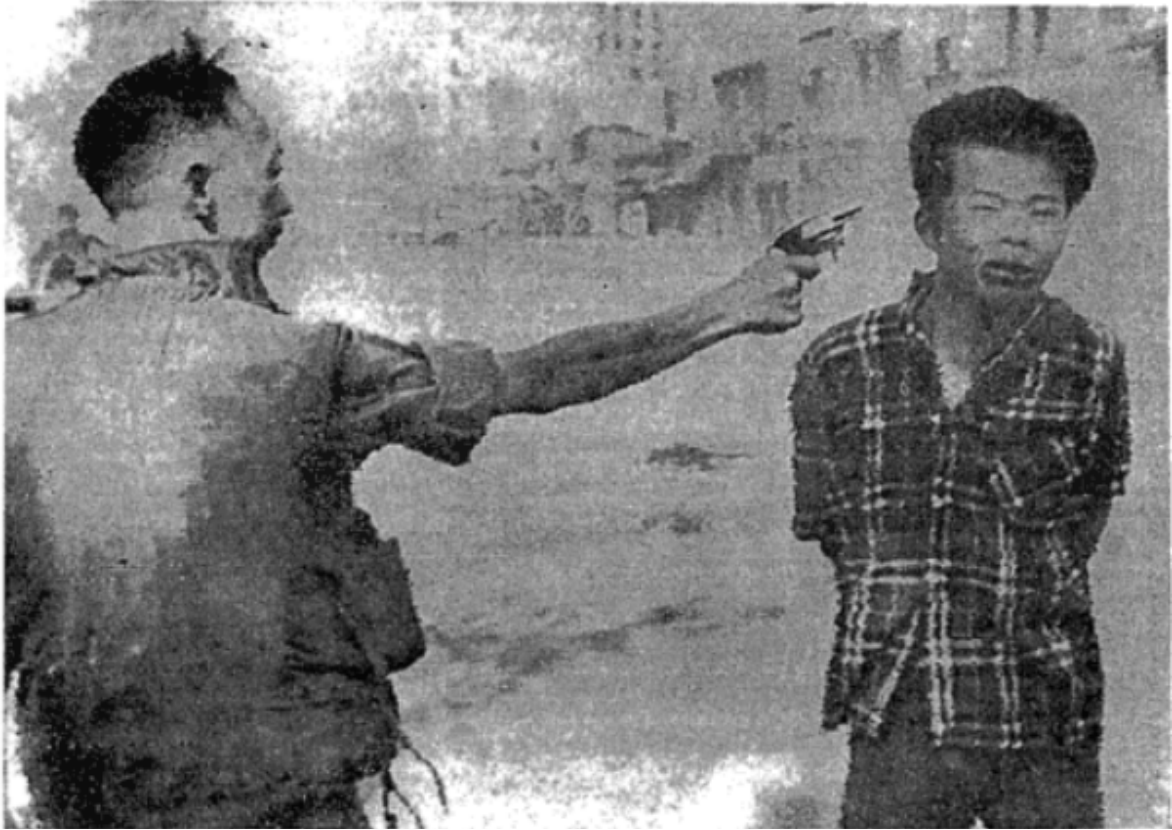
Generál Nguyen Ngoc Loan popravující důstojníka Vietcongu 86

„Zavraždili mnoho Američanů a mnoho našich lidí.“ New York Times cituje generála Loana u jedné z dalších fotografií, na které člen Vietcongu již popravený. Důvod, proč byl popraven, se ve článku neobjevuje, 87 avšak z historických pramenů víme, že rodina generála Loana byla Vietcongem při útoku zavražděna a jednalo se tím pádem o pomstu. 88