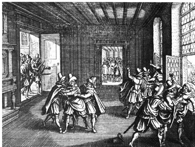
Pražská defenestrace 23.5. 1618