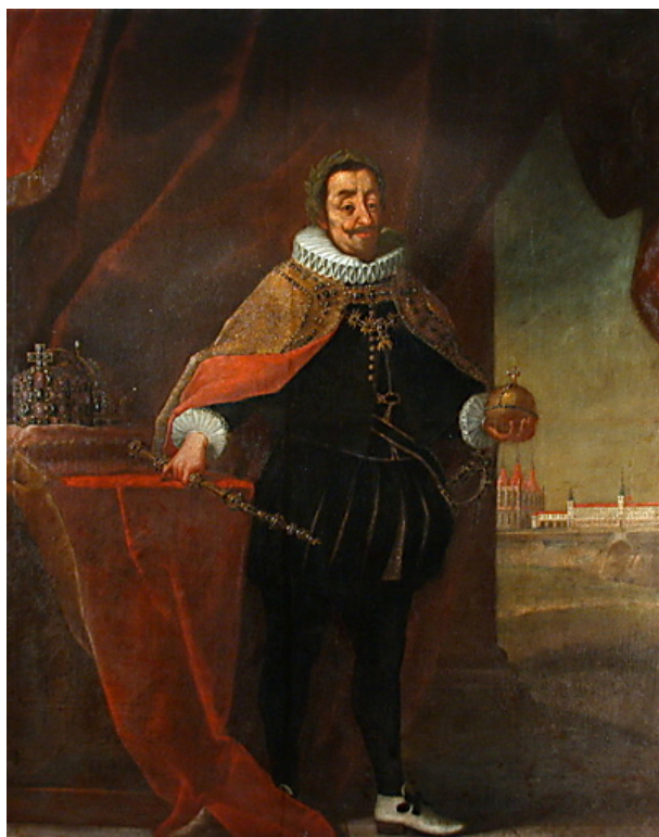
Cisár Ferdinand II.