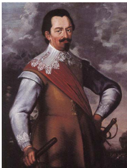
Albrecht z Valdštejna