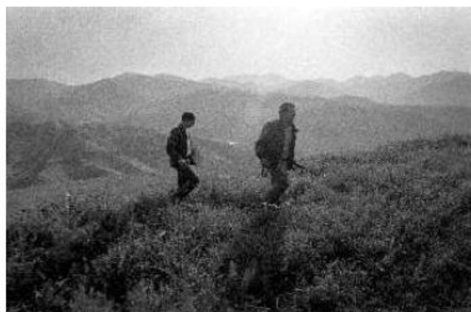
Náhorní Karabach (1992), Lačinský kondor, úsek, který byl vymezen na šířku doletu raket BM-21 Grad (tedy cca 20 km), bránili arménské vojáky, ale především všichni muži z Karabachu jako jedinou přístupovou cestu horami do oblasti Arcachu