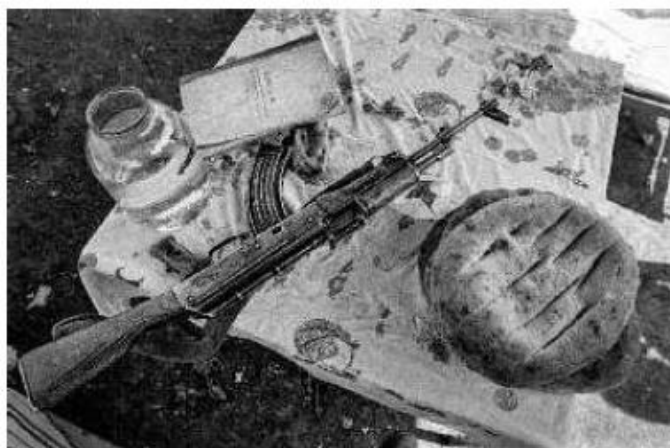
Náhorní Karabach (1992), Lačinský koridor, zátíší s chlebem a samopalem AK-47 na kontrolním stanovišti domobránců