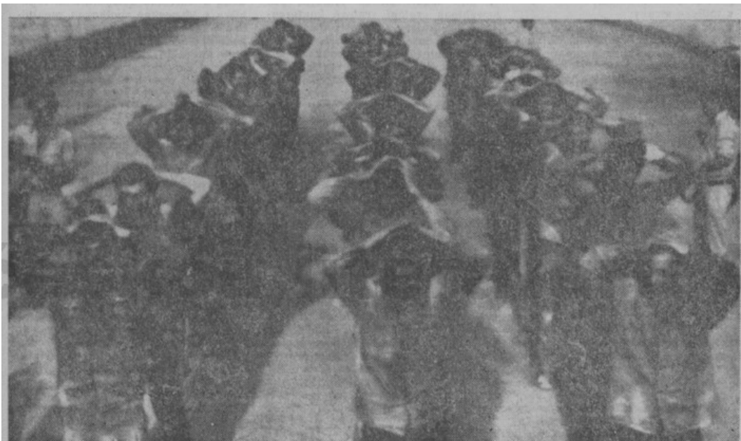
V úterý, čtvrtý den bojů na Středním východě, bylo zajato podle egyptského komuniké několik set izraelských vojáků. Na snímku jedna ze skupin izraelských zajatců.

Příloha č. 4: Fotografie zachycuje zajatce.