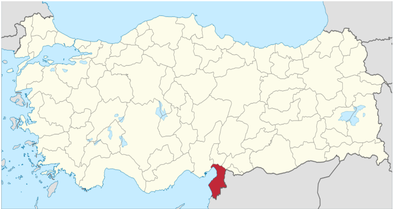
Příloha č.3 - Turecká provincie Hatay, kde došlo ke sestřelení Su-24M 133