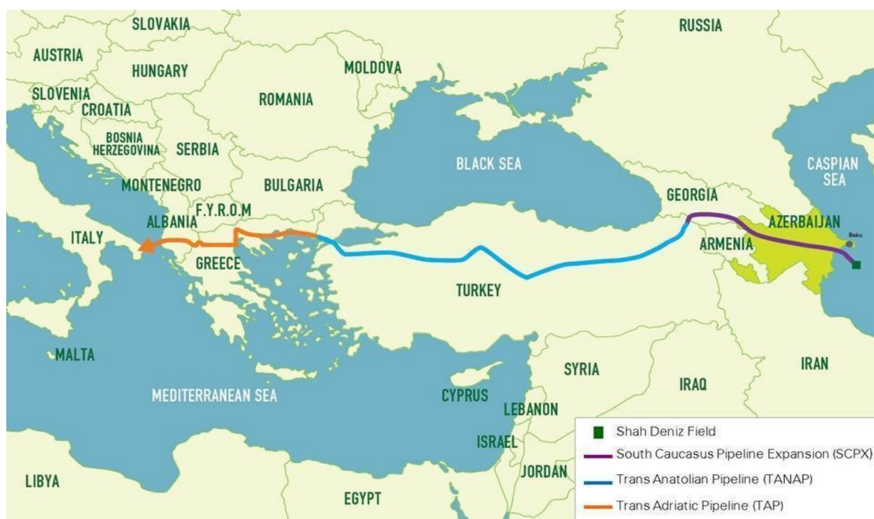
Příloha č. 6 - South Energy Corridor 136