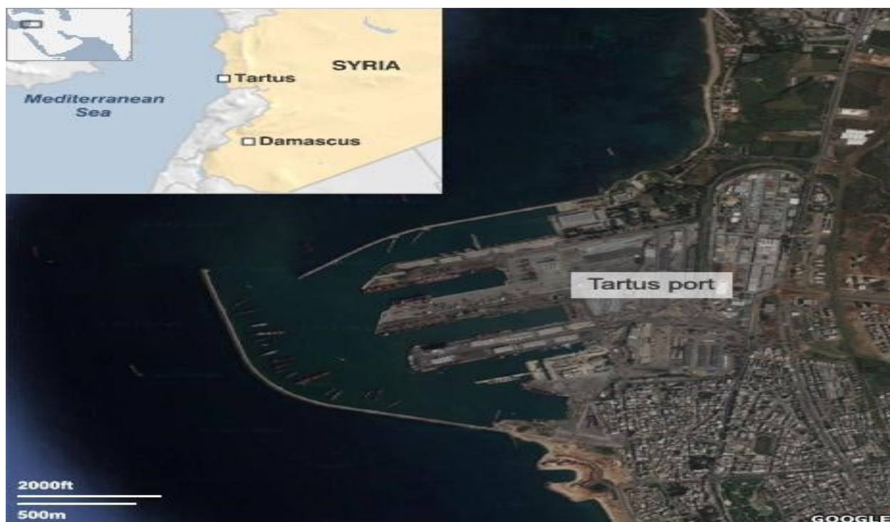
Příloha č.1 - Ruský přístav Tartus 131