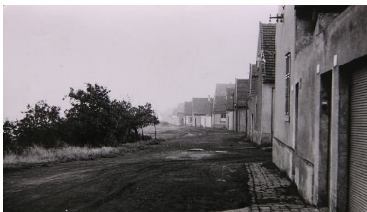
Nové Kladno s ořechovkou (60. léta 20. století).