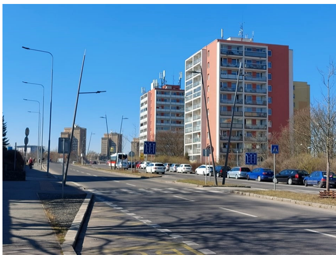
Pohled na západní část sídliště na Novém Kladně s věžáky v Rozdělově 2022.