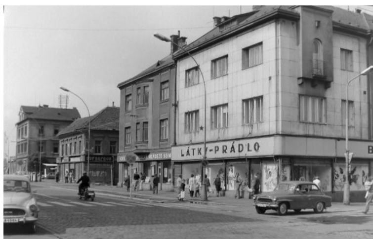
Obchody na Novém Kladně v 60. letech 20. století.