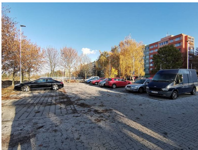
Parkoviště v západní části sídliště na Novém Kladně v roce 2020. Zdroj: https://kladensky.denik.cz/galerie/kladno-stechova-ulice-20201106.html?photo=1&fbclid=IwAR1sKM3tSrSxh3HQQe9TpuuUJDxxOxm-AWbR-x-rVdf9iIyPtjO_YzjZpas .