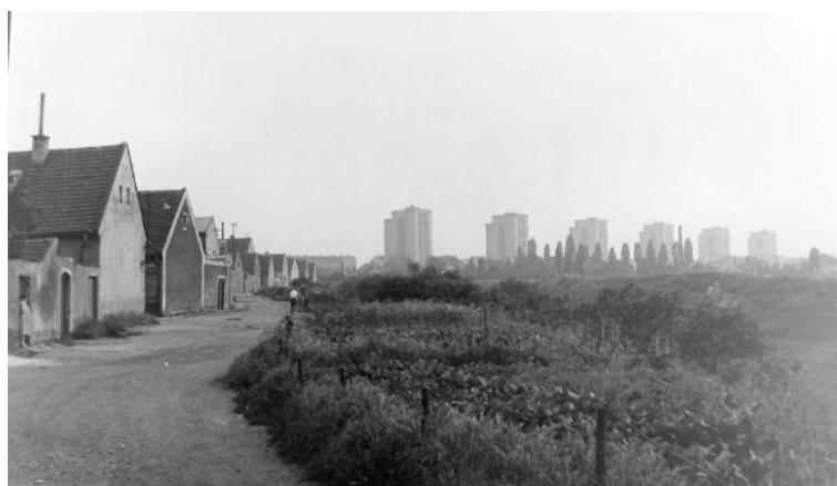
Nové Kladno s Ořechovkou a Rozdělovem v 60. letech 20. století.