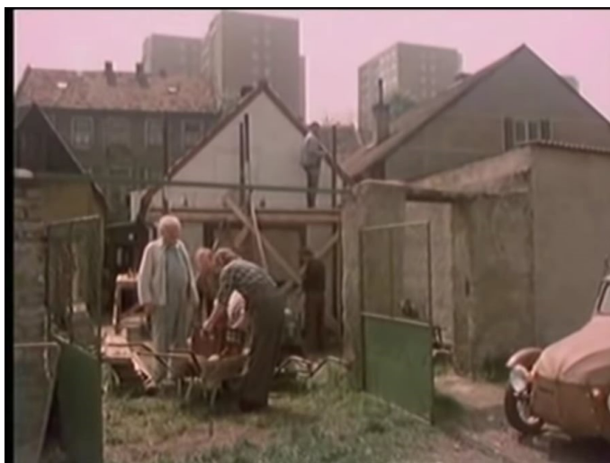
Pohled z Podprůhonu na sídliště na Novém Kladně