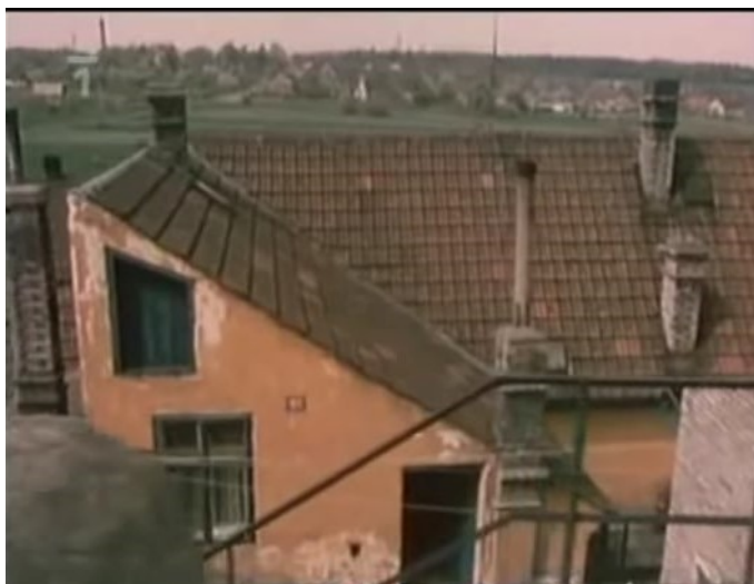
Pohled na opadané omítky v Podprůhonu v 80. letech 20. století.