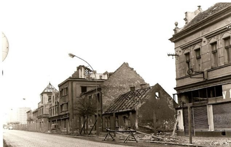
Asanace Nového Kladna na konci 60. let 20. století.