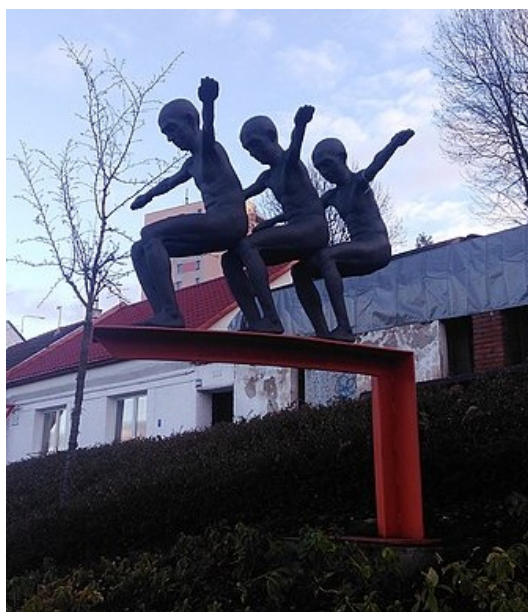
Socha poletime (Podprůhon 2021).