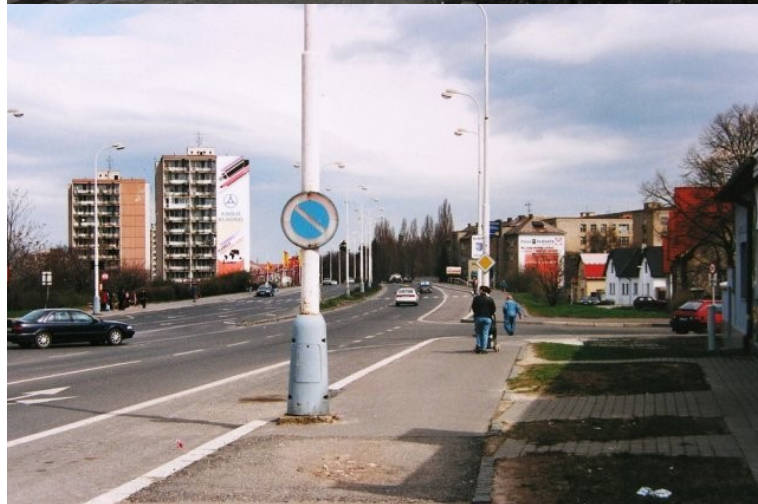
Pohled z Rozdělova na Nové Kladno (70. léta 20. století, 1983 a 2000)