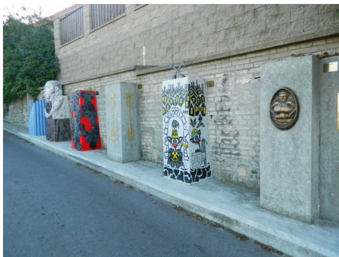
Strážci Podprůhonu 2020