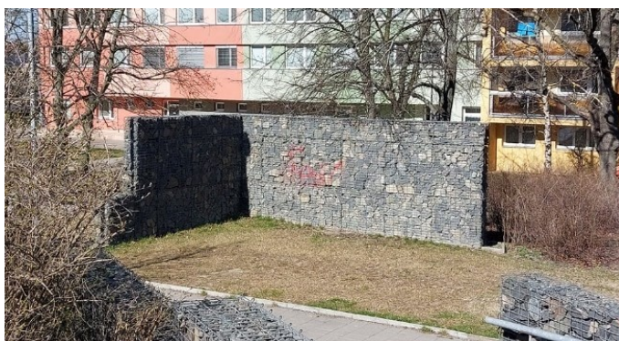
Torzo bývalého altánku na sídlišti na Novém Kladně.