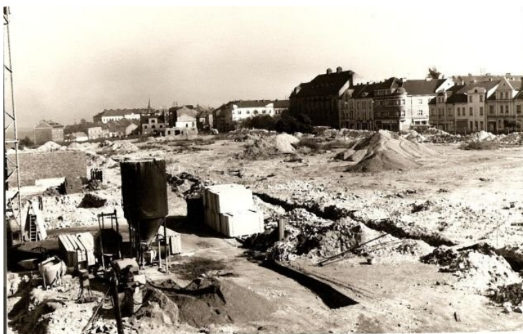
Asanace Nového Kladna na začátku 70. let 20. století