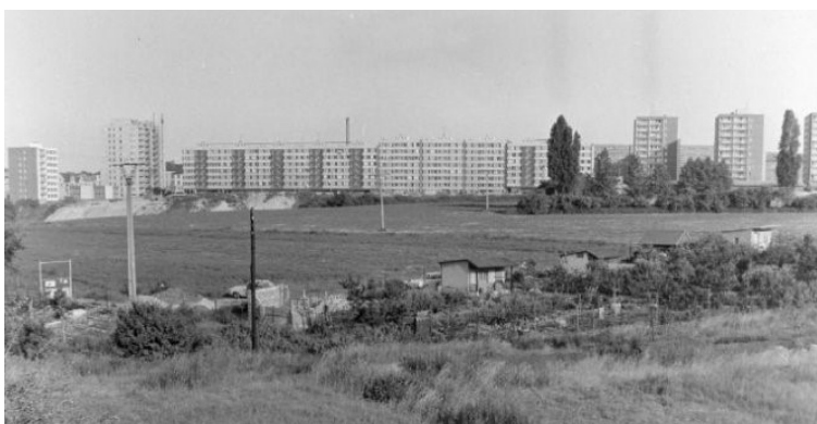
Pohled na západní část sídliště na Novém Kladně v 70. letech 20. století.