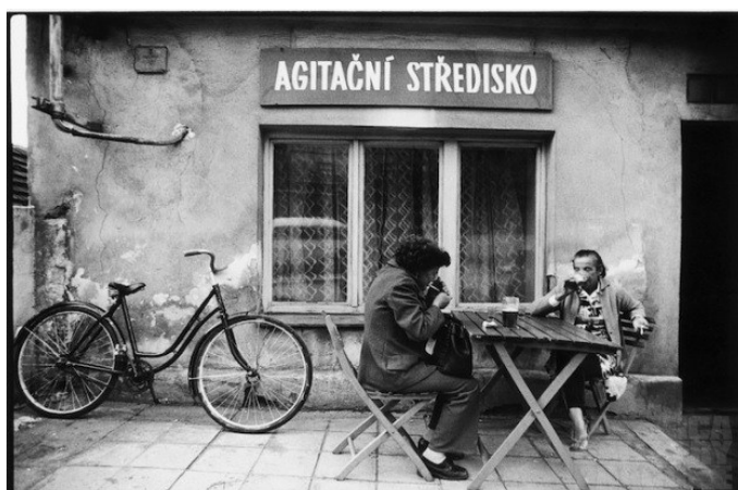
Hospoda u Kulaté báby v Podprůhonu 80. léta 20. století