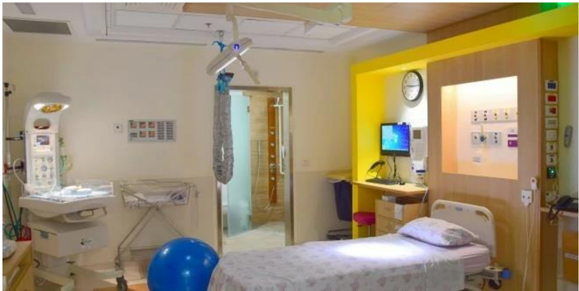
Obrázek 4 – Porodní pokoj