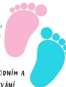
Obrázek 6 – Letáček předporodního kurzu