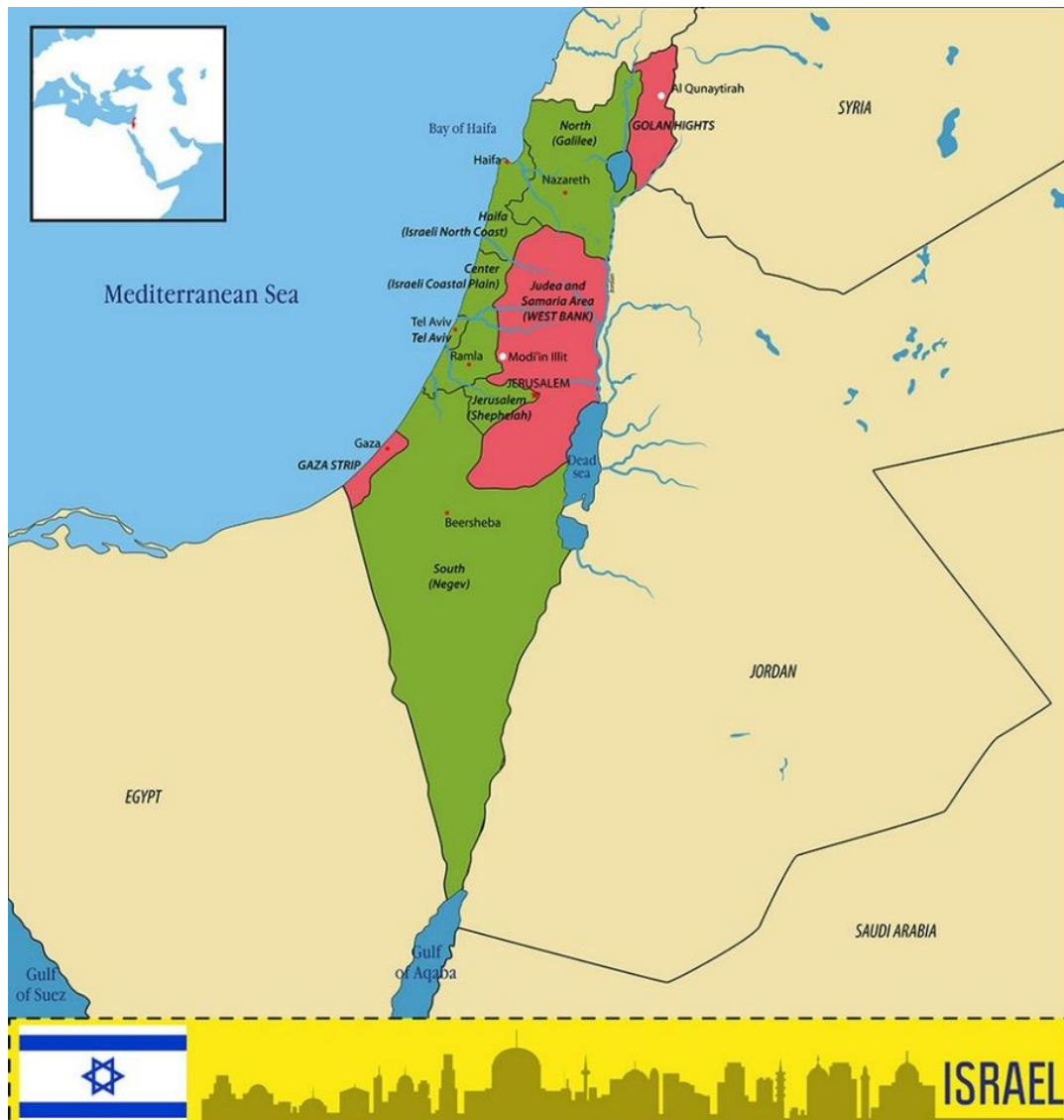
Obrázek 1 – Mapa Izraele