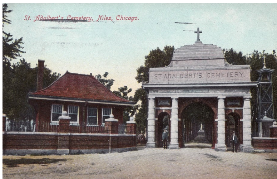
Příloha č. 2; Dobová pohlednice česko-polského hřbitova sv. Vojtěcha v Chicagu.