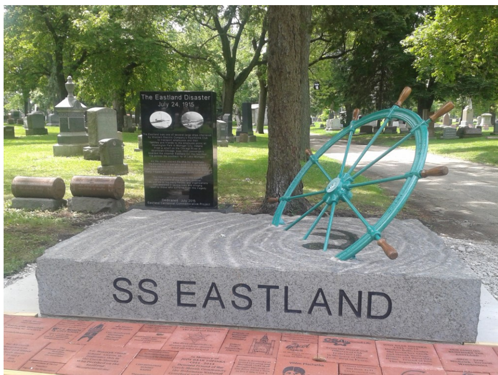
Příloha č. 15; Pomník upomínající na tragédii parníku Eastland na Českém národním hřbitově. Odhalen byl v roce 2015 k 100. výročí od události.