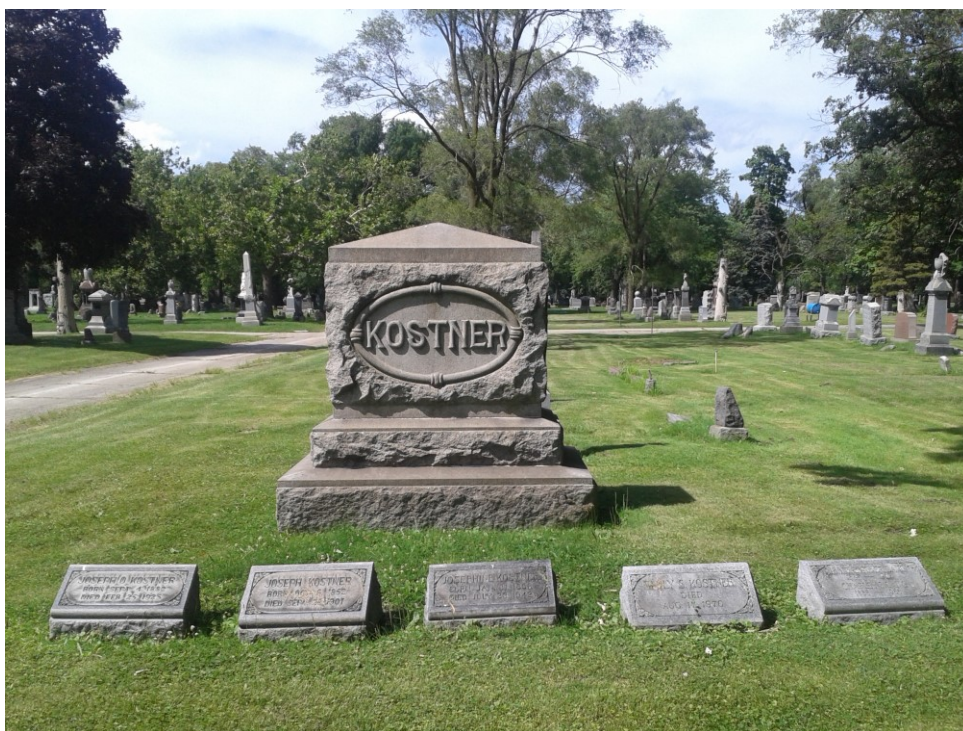
Příloha č. 14; Hroby rodiny Kostnerových na Českém národním hřbitově v Chicagu.