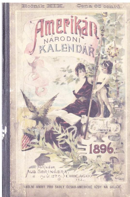
Příloha č. 1; Přebal Amerikánu, národního kalendáře pro rok 1896, který vycházel v nakladatelství Augusta Geringera.