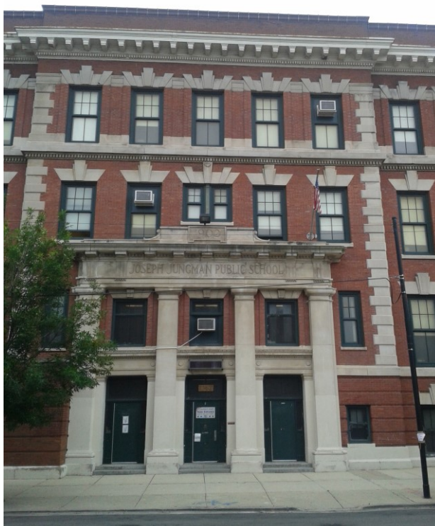
Příloha č. 12; Jungmannova škola ve čtvrti Plzeň (foto: Jaroslav Kříž, 2015).