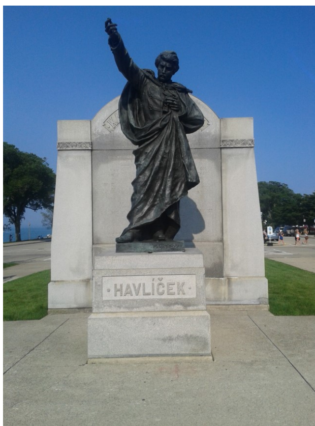
Příloha č. 16; Socha K. H. Borovského nedaleko centra Chicaga (foto: Jaroslav Kříž, 2015).