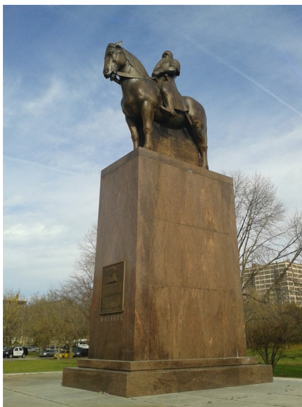
Příloha č. 18; Socha Blanického rytíře v areálu University of Chicago.