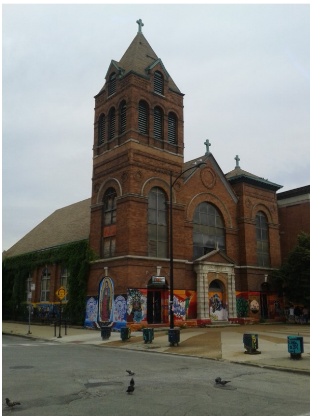
Příloha č. 11; Kostel sv. Víta v chicagské Plzni.