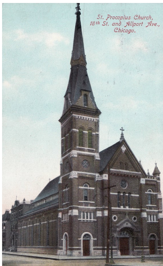
Příloha č. 9; Pohlednice s vyobrazením kostela sv. Prokopa z čtvrti Plzeň.