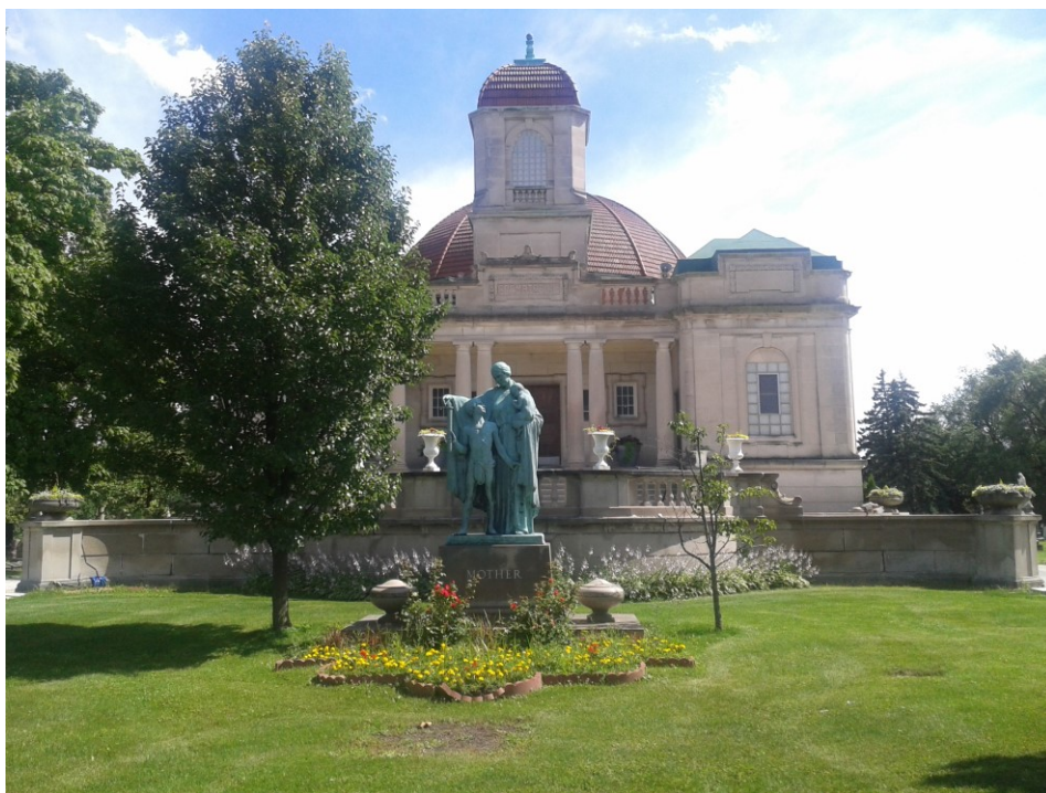
Příloha č. 13; Socha Matka před kolumbáriem na Českém národním hřbitově v Chicagu.