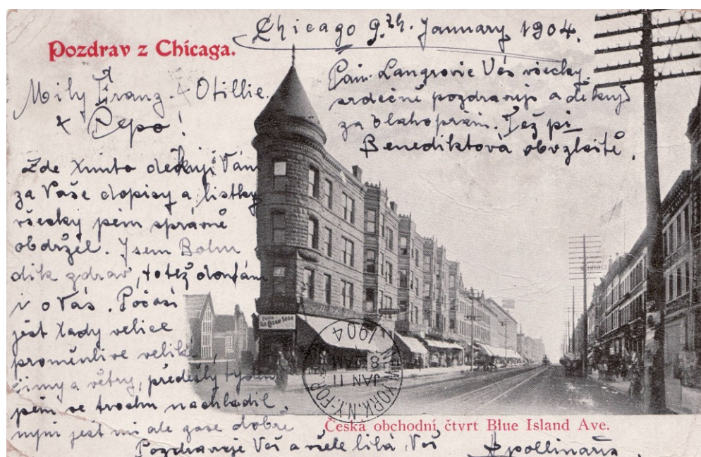
Příloha č. 4; Pohlednice zachycující obchodní tepnu české Plzně v roce 1904.