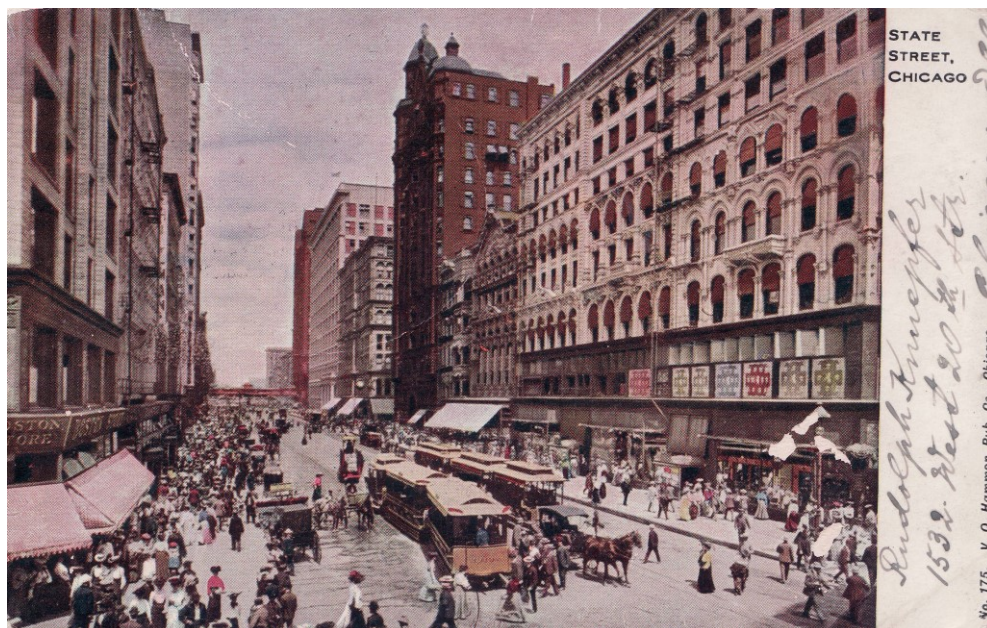
Příloha č. 5; Centrum Chicaga na počátku 20. století na historické pohlednici.