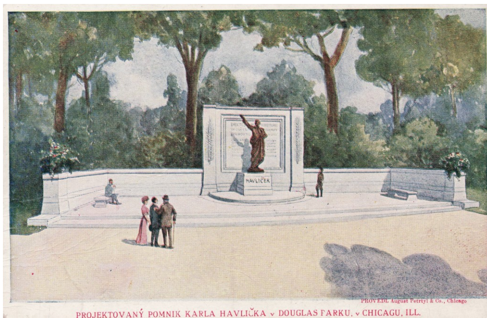
Příloha č. 6; Návrh pomníku Karla Havlíčka Borovského na historické pohlednici.