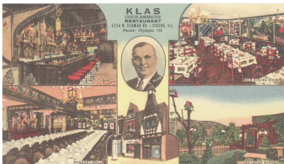
Příloha č. 8; Reklamní pohlednice na restauraci Klas z roku 1922 (archiv autora).