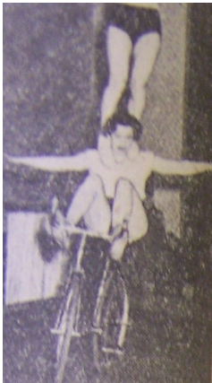
a Kurandová ze Spartaku Praha jsou několikanásobnými přezdívkou dvojice. K těmto úspěchům a především vytrvalosti přispívá kladnost v přípravě.

Proto náš lid s radostí uvítá sovětské soudruhy jako představitel silné, pevné a jednotné Komunistické strany Sovětského svazu, která neustále dokazuje svou věrnost leninským principům boje za socialismus. Otevře svou náruč do široka tím spíše, že se nyní znovu přesvědčil, jak bratrská sovětská strana rozhodně a neochvějně stojí na straně naší vlasti.