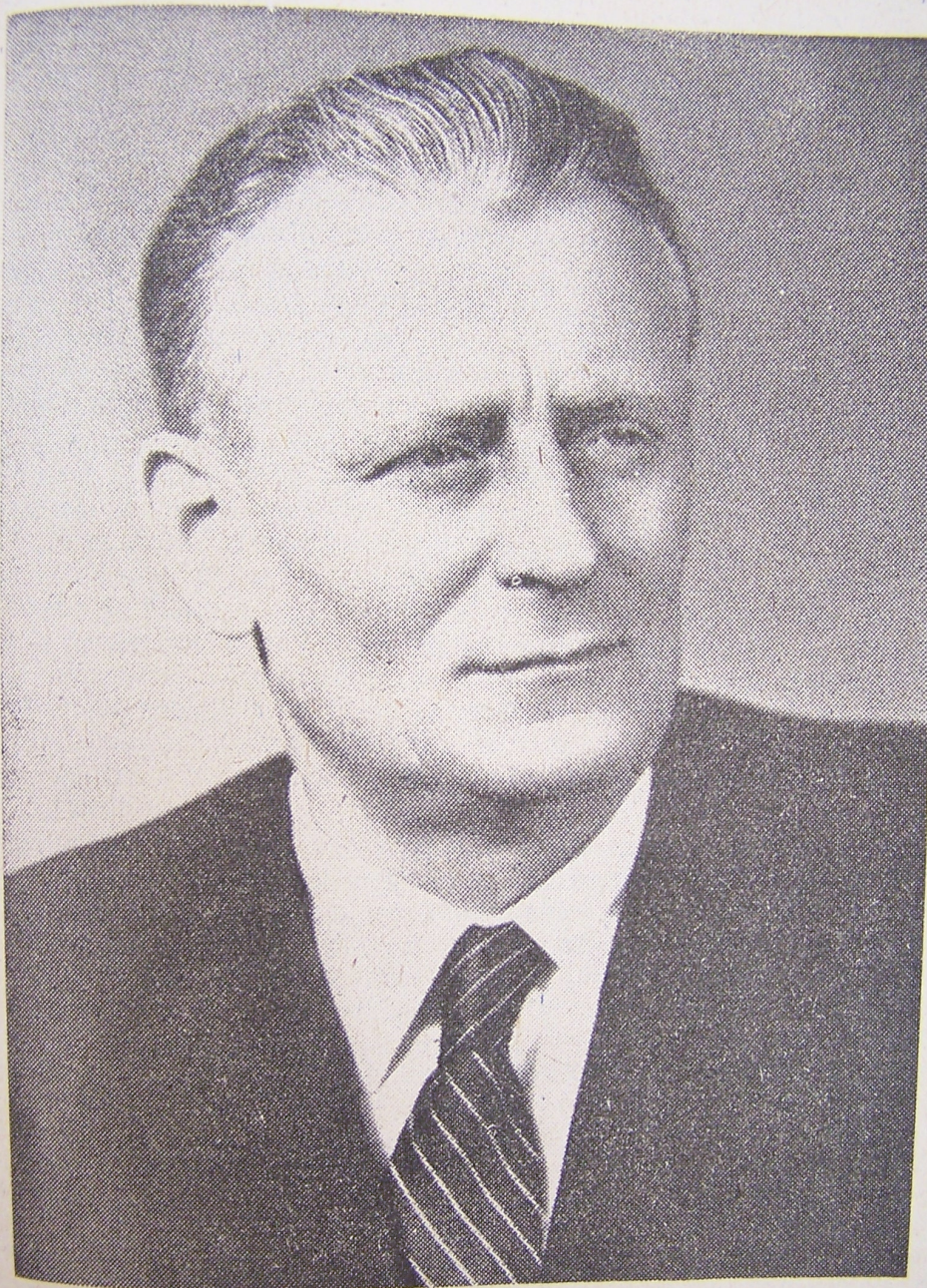
ANTONÍN NOVOTNÝ, PRVNÍ TAJEMNÍK ŮV KSČ A PRESIDENT REPUBLIKY ČESKOSLOVENSKE