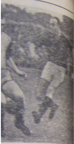
utkární Dynama Praha—Sport Sokolovo