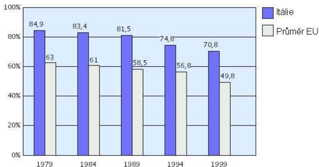
Graf č. 3 Itálie - Vývoj volební účasti ve volbách do Evropského parlamentu