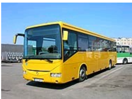
Příloha 7 - Nový bibliobus