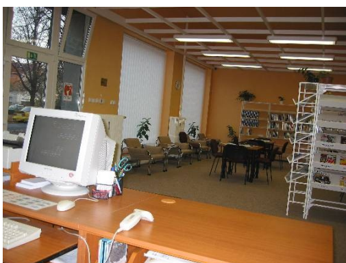
Příloha 5 - Hudební a internetová knihovna