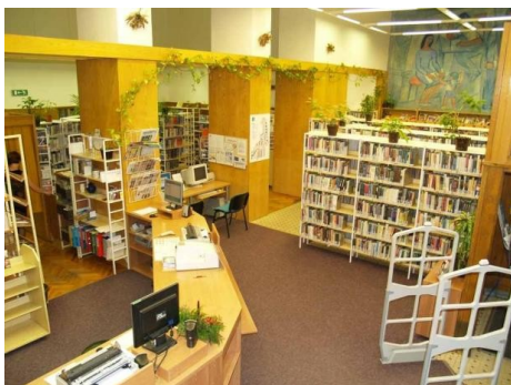
Příloha 3 - Ústřední knihovna pro dospělé