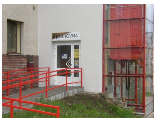
Příloha 6 - Obvodní knihovna Lochotín