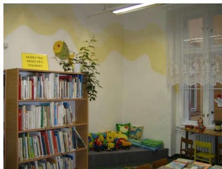
Příloha 4 - Ústřední knihovna pro děti a mládež