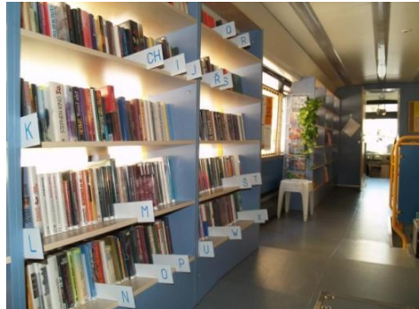
Příloha 8 - Interiér nového bibliobusu