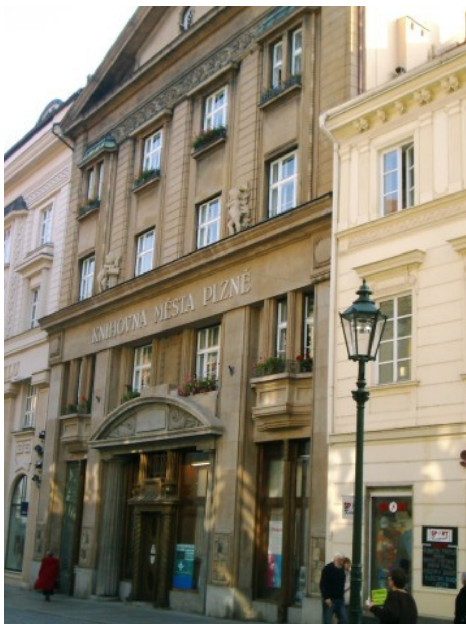
Příloha 2 - Knihovna města Plzně