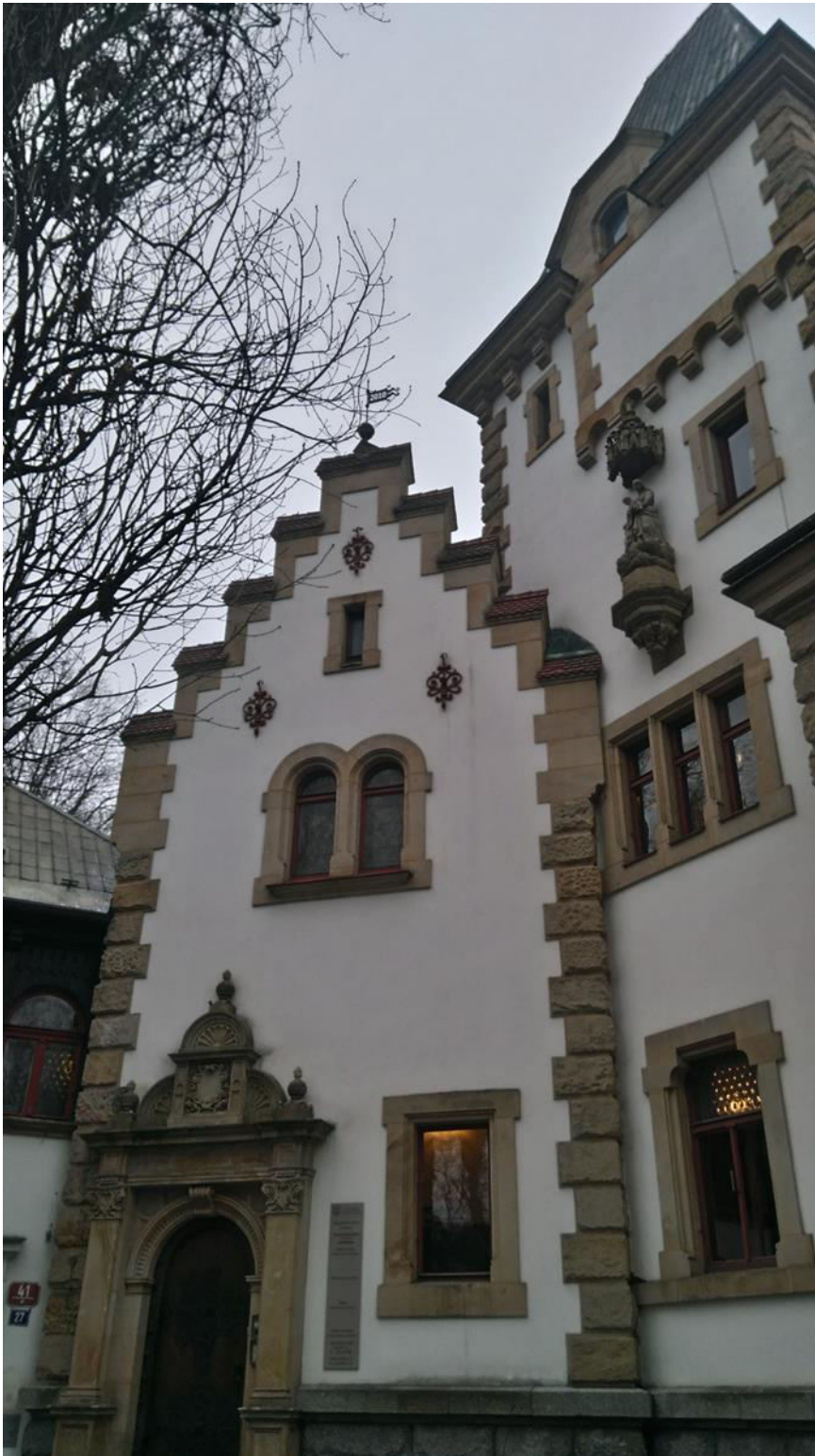
Pohled na přední štít s pěkným portálem.