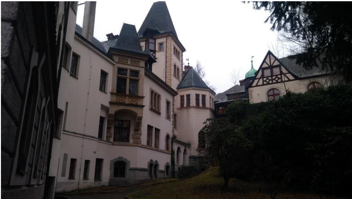
Zadní část budovy (foceno z dvorku)