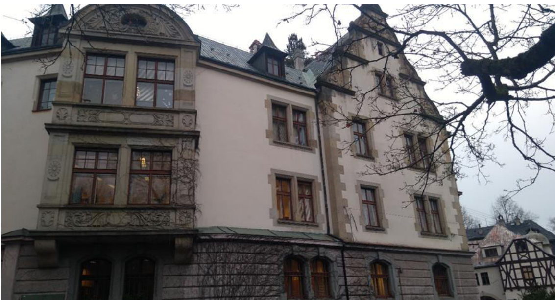
Pohled na jednu z předních částí.