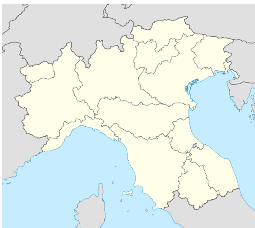
Příloha č. 2: Rozsah Padánie podle Ligy Severu 81

V proklamaci nezávislosti Padánie, která byla zmíněna v úvodu této kapitoly, je Bossim v celku jednoznačně popsán rozsah Padánie. Ta se skládá z: Emilie, Furlánska, Ligurie, Lombardie, Marche, Piemontu, Romagny, Jižního Tyrolska-Horního Adige, Toskánska, Tridentska, Umbrie, Údolí Aosty, Benátska a Julského Benátska. 80