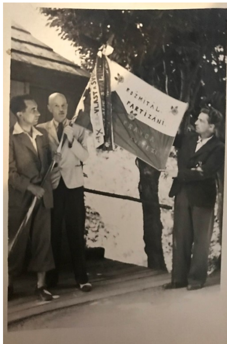
Obrázek č. 10