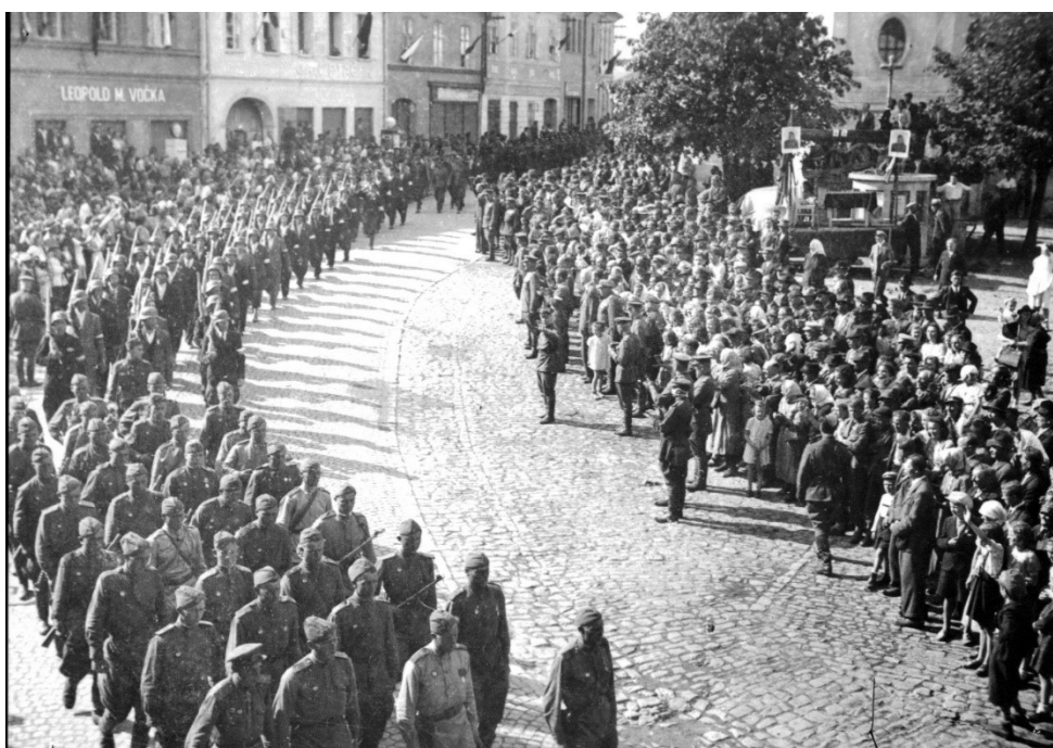
Obrázek č. 13