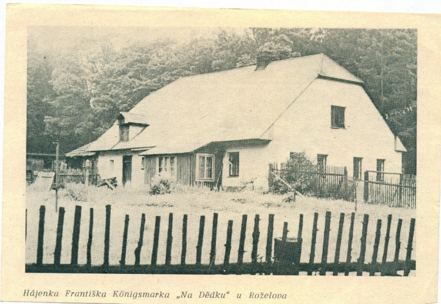
Hájenska Františka Königsmarka „Na Dědku“ u Roželova