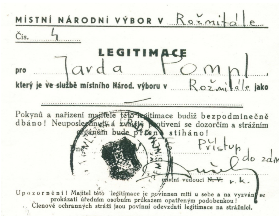
Obrázek č. 14