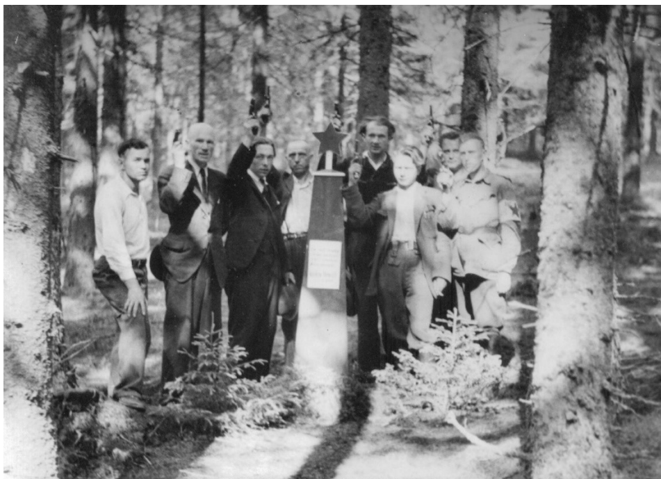
Obrázek č. 15