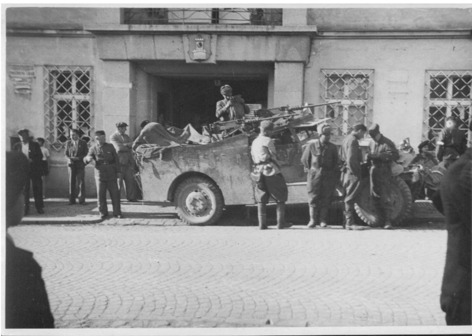
Obrázek č. 12