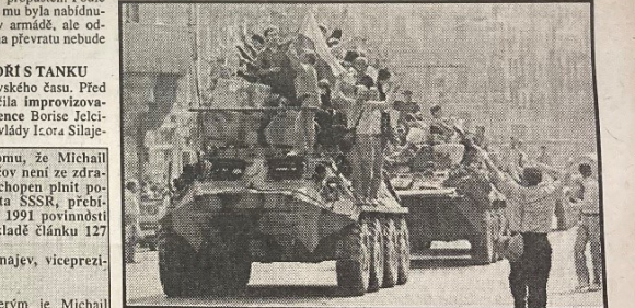
SCÉNY Z MOSKVY 19. srpna 1991 československým členům snadno připomenou výjevy z Prahy 21. srpna 1968. Tentokrát jsou na obou stranách Rusové...

PARÍŽ - Spiklenci, kteří svrhli Michaila Gorbačova, se jej pokusili přimět k podepsání vlastní demise. Zpráva o tom v pondělí večer vysílala francouzská televizní stanice TF 1, avšak nebyla potvrzena z jiných zdrojů. Reportéři TF 1 uvedli, že pučisté v noci ze soboty na neděli zvláštním letadlem přivezli Gorbačova z dovolené do Moskvy, kde na něj vyvíjeli tlátek. Ten však odmítl podepsat připravené prohlášení o demisi. Poté byl opět odvezen do svého letního sídla u Černého moře.