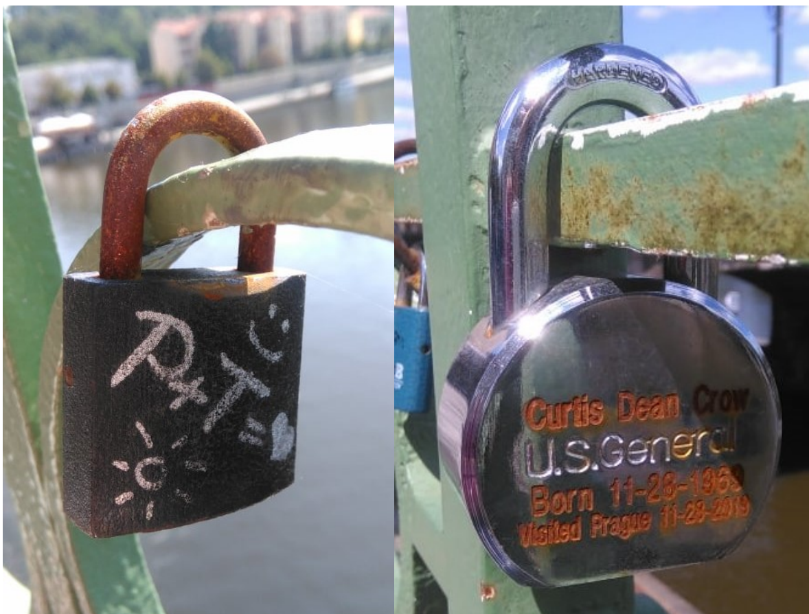
Obrázek 3: Zámek vyjadřující partnerskou lásku, železniční most u Vyšehradu, 12. 8. 2020, fotografie autorky.