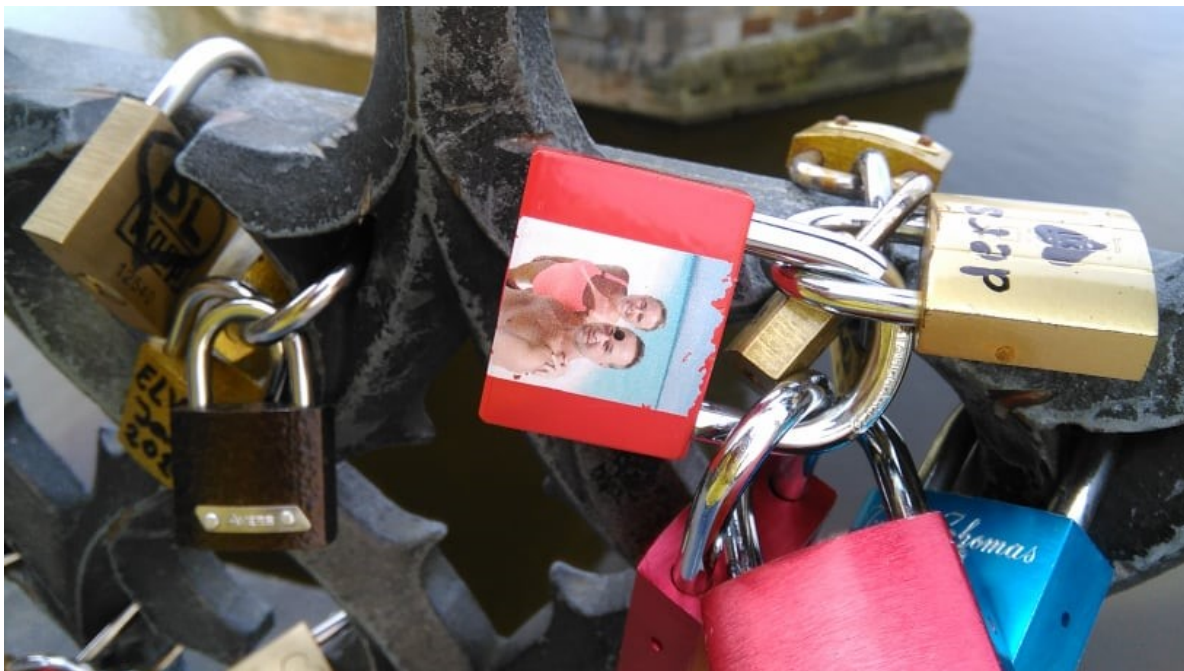
Obrázek 2: Zámky lásky na Křižovnickém náměstí, 15. 4. 2020

Zámky, které se používají jako zámky lásky, se většinou zamykají na klíč. V minimální míře se též vyskytují zámky s číselným kódem. Zde však již dochází kvůli absenci klíče k posunu jejich symbolického významu. Ojedinele se můžeme setkat i se zámky atypickými. 39