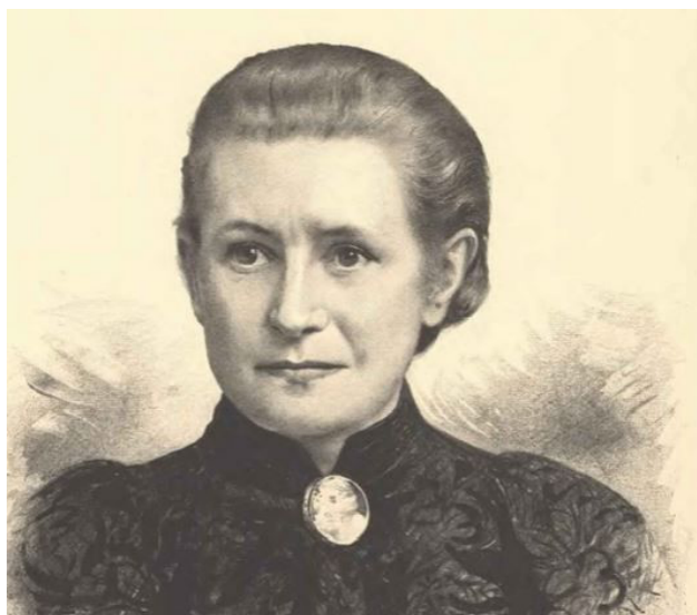
Příloha č. 7 – František Xaver Prusík