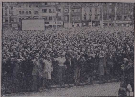
Na Hlavním náměstí v Plzni se konala v úterý odpovečně mohutná manifestace všech pracujících vratech českého lidu z Plzně a celého plzeňského kraje, na níž měl významný projev ministr lidové osvěty Emanuel Moravec. Ověřte: Českos. ČTK.

Jak již bylo oznámeno zvláštní zprávou, zasadily svazky německého letectva a jednotky německého válečného námořnictva v součinnosti s italskými letectvy a námořními obrannými silami těžké srážky britskému válečnému letectvu a námořnímu zásobovací loďné dopravě ve Středozemním moři. V době od 13. do 15. června byly ze silně zajištěných britských konvojů potopeny německými letectvy a námořními obrannými silami čtyři křižníky a torpedoborce, dva strážní lodě a šest obchodních lodí celkem o 56.000 brt. Kromě toho byl jeden torpedoborec a osm obchodních lodí zasaženo torpedy a zapáleno nebo tak vážně poškozeno, že jest počítat s jejich ztrátou.