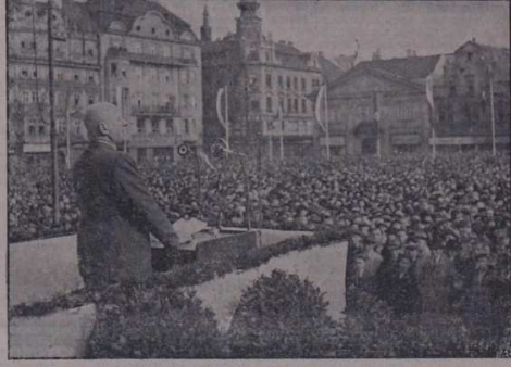
Ministr lidové osvěty Emanuel Moravec při projevu

Na úspěchu má dále podíl ponorka kapitánleutnanta Reschkeho, která potopila jeden nepřátelský křižník. U anglického jižního pobřeží zasáhlo letectvo za denních i nočních stůlků pumami tři obchodní lodě střední velikosti a potopilo je. U Brightonu a u Portlandu byly těžce zasaženy objekty důležité pro válku. Britské letectvo podniklo uplynulé noci rušivé nálety na západoněmecké území. Noční stíhačky a protiletadlové dělostřelce sestřelily devět z útočících bombardérů.