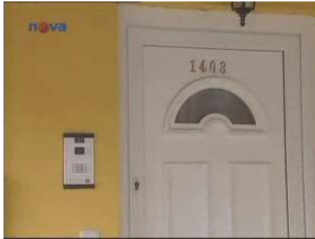
Obrázek č. 5. 4. 6. Záběr na dům Maueroových v Kuřimi

V čase mezi 12. a 21. květnem je hlavním tématem reportáží pátrání po Anně a tomu také odpovídá záběrová skladba. Kromě výše zmíněných záběrů převládají zejména obrazové materiály zachycující policisty při pátrání. Valná většina z nich však pochází hned z prvního dne pátrání, tedy z 12. května. Stáří těchto záběrů přitom není nikde označeno a divák tak nabere dojem, že jsou aktuální (v tomto případě to nemá žádný vliv na předávané sdělení – pátrání totiž stále probíhá).