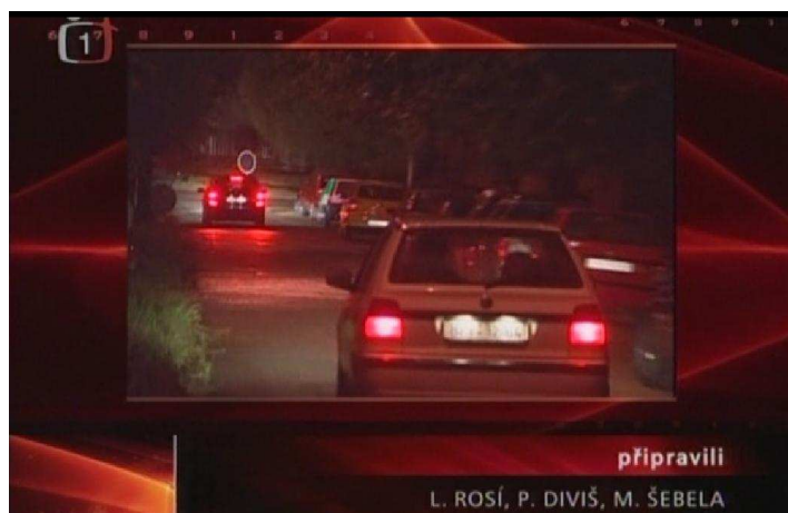
Obrázek č. 6. 4. 3. Záběry z prohledávání brněnských bytů Policií ČR

Zajímavý obrazový materiál tvoří příspěvek z 18. května, kdy policie začíná kvůli případu prohledávat brněnské byty. Příspěvek je sám o sobě připraven reportážní formou, což záběry jen podtrhují. Redaktoři zachytili předešlé noci několik policistů přímo v akci na brněnských ulicích. Samotný fakt, že záběry zachycují policisty během noční akce, podtrhuje dramatickost situace. Ten samý obrazový materiál je poté užíván pravidelně jako reprezentace policejního pátrání. Konkrétně bylo jeho užití zaznamenáno ještě čtyřikrát.