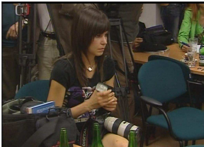
Obrázek č. 6. 4. 4. Záběry z tiskové konference ministryně Džamily Stehlíkové

pochopitelná. Její velkou část tvoří záběry zachycené elektronickou chůvičkou a záběry plačící Kláry Mauerové. Zbytek zobrazuje novináře čekající na příchod ministryně Džamily Stehlíkové.