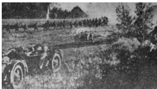
Boj proti bolševickému světovému nepříteli. Německé Oddíly naráží při vstupu do vesnice na nepřitele a ihned jej drtí.

SS-PK-Ege, Polední list, 29. 6. 1941, roč. 15, č. 176, s. 2