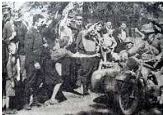
Obyvatelstvo bývalého polsko-litevského pohraničního území pozdravuje vstupující německé oddíly.