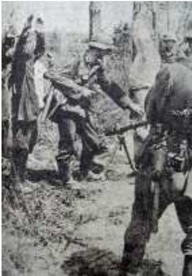
Po tvrdošijném odporu

PK-Kipper, Polední list, 29. 6. 1941, roč. 15, č. 176, s. 2