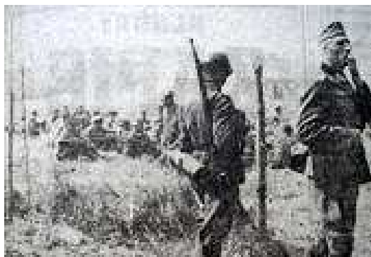
Sovětoruští zajatci v jednom z provisorních zajateckých táborů.

PK-Vorpahl, Polední list, 29. 6. 1941, roč. 15, č. 176, s. 2