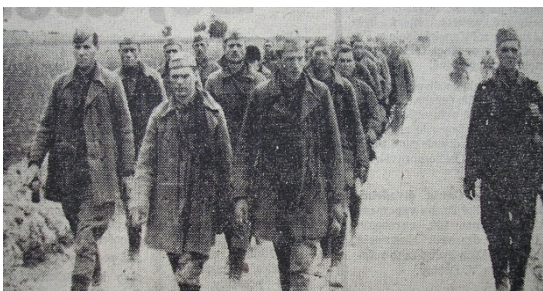
První nekonečné zástupy vojáků

Fotografický materiál včetně popisků týkající se Sovětského svazu a otištěný v Poledním listu, Večerním Českém slově a Venkově ve dnech 16. 6. 1941 – 14. 7. 1941