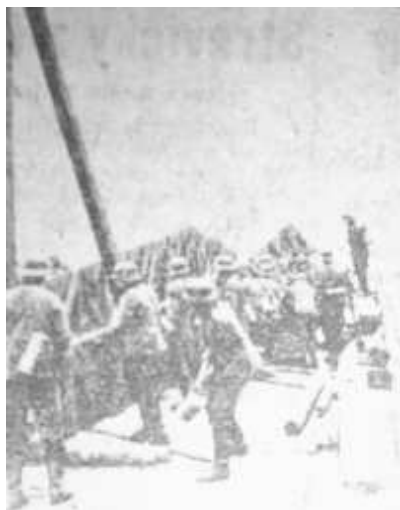
Mosty a silnice se opravují

ČTK-Weltbild, Polední list, 27. 6. 1941, roč. 15, č. 174, s. 1