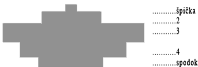
Obrázok 1: Usporiadanie podľa spoločenského rebríčka (viď tab. 5)