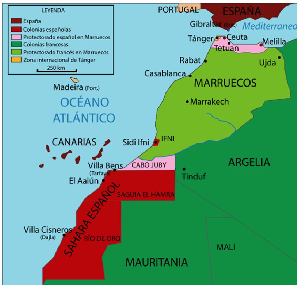
Mapa č. 1. Španělská území v severní Africe 1934-56