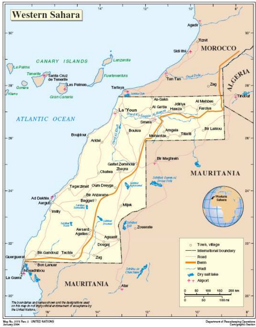
Mapa č. 2. Západní Sahara