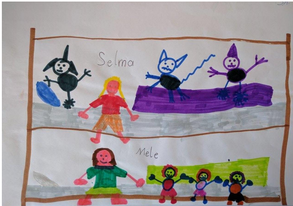
Anhang E: Bild zum Monsterhund von einem 7-jährigen Mädchen aus der 2. Klasse