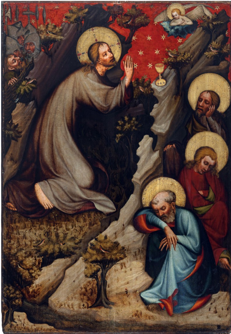
Obrázek 1: Mistr Třeboňského oltáře – Kristus na hoře Olivetské (NG v Praze, kolem roku 1380)