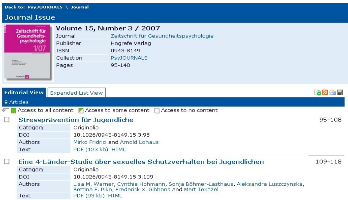
Obr. č. 2 Část obsahu časopisu Časopis psychologie zdraví