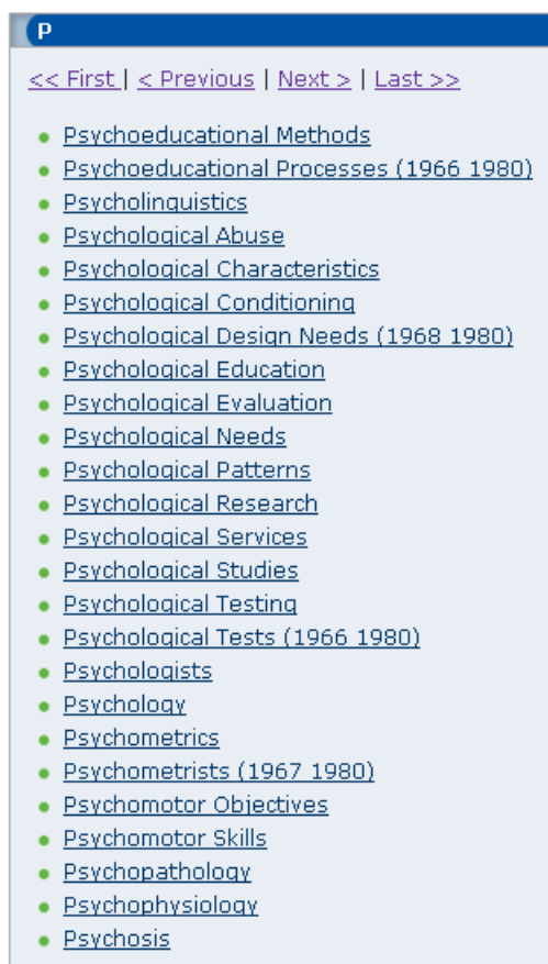
Obr. č 5 Tezaurus : ERIC

Uživatelé byli zvyklí donedávna považovat produkt ERIC za databázi, na webové stránce se však Centrum definuje jako digitální knihovna pro výzkum a informace ve vzdělávání. Jsou poskytovány záznamy nejrůznějších typů literatury v počtu více než 1,2 mil. citací od roku 1966 a více než 115 tis. úplných textů dokumentů v PDF [ERIC, 2007] s celosvětovým záběrem. Uživatelské rozhraní je komfortní, s jemným rozlišením typů dokumentů, je poskytována možnost vlastního nastavení ( My Eric ). Systém nabízí tezaurus, což velmi usnadňuje vyhledávání. Výběr termů v tezauru ukazuje obrázek č. 5.