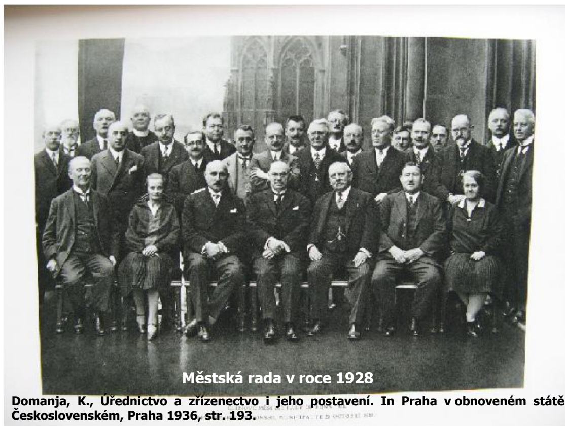
Městská rada v roce 1928

Domanja, K., Úřednictvo a zřízení a jeho postavení. In Praha v obnoveném státě Československém, Praha 1936, str. 193.