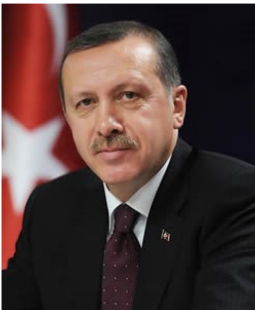
Příloha č. 3: Portrét Recepta Tayyipa Erdoğana (obrázek)