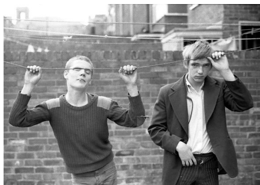
Obrázek 5: Youth Unemployment. Foto: Tish Murtha (1981)