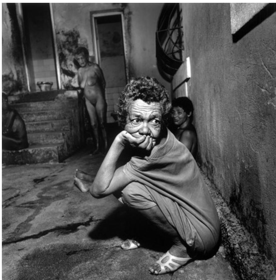
Obrázek 11: Madness . Foto: Claudio Edinger (1989)

Edinger poté pokračoval s fotografováním v brazilském ústavu pro choromyslné v São Paulu. Výsledný dokument pojmenoval Madness 82 Na přelomu osmdesátých a devadesátých let nebyla v Brazílii zdravotní péče zdaleka na dnešní úrovni, a tak byl svědkem špíny a chaosu v ústavu, který připomínal vězení. 83 „Nebyl jsem tam, abych tyto lidi odhalil. Odcházel jsem z té instituce s myšlenkou, že kdyby mé fotografie aspoň trochu povzbudily výzkum duševních nemocí, byl bych šťastný,“ 84 říká Edinger. Také nikdy nevyfotil nikoho, kdo se přímo bránil odmítavými gesty.