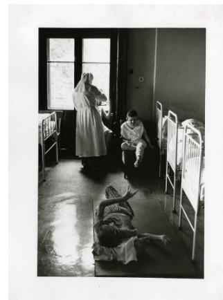
Obrázek 7: Ústav oligofrenních dětí.