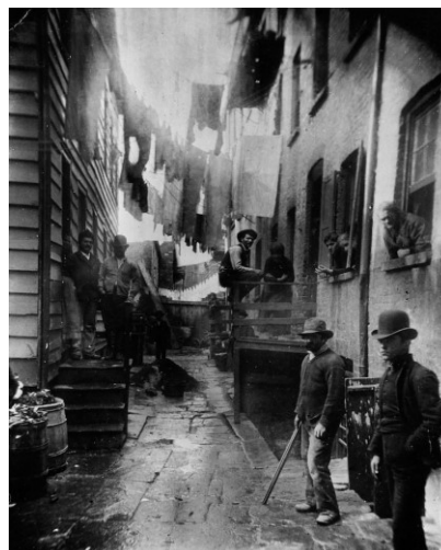
Obrázek 2: Bandit's Roost . Foto: Jacob Riis (1888)