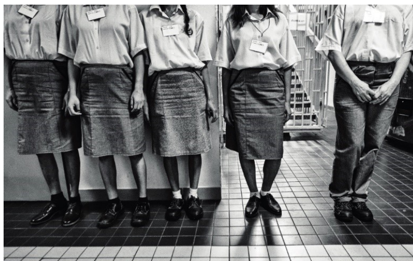
Obrázek 9: Světlušky.