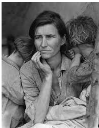
Obrázek 1: Migrant Mother . Foto: Dorothea Lange (1936)