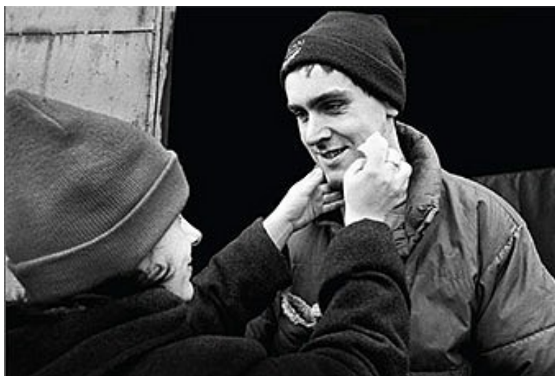
Obrázek 8: Jedno světlo. Foto: Jindřich Štreit (2011)

Předloni se sociální fotografie Jana Jirkovského umístila na třetím místě soutěže Czech Press Photo v kategorii Každodenní život. Na obrázku je zachycena canisterapie v domově důchodců. Autor dlouhodobě dokumentuje pražské otužilce a život v Centru sociálních služeb Tloskov. 62 S charitou spolupracuje například i fotograf a teoretik Tomáš Pospěch.