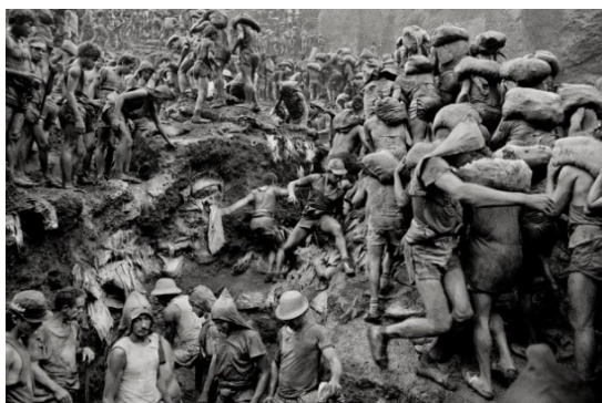
Obrázek 4: Gold. Foto: Sebastião Salgado (1986)

Dále se sociální fotografii věnuje například Manuel Rivera-Ortiz, který také cestuje do rozvojových zemí. Fotograf Anik Rahmann se ze začátku věnoval focení Indie a Nepálu, ale postupně přešel k pouliční fotce. Mezi jeho nesilnější projekty patří Puppet Show 28 , který obsahuje snímky obětí násilných demonstrací v Bangladéši. V roce 2020 se zaměřil na fotografování každodenní reality během pandemie koronaviru. Na podzim dokumentoval nepokoje a demonstrace, související s prezidentskými volbami v USA. Významnou osobou současné doby byla i Tish Murtha, která zemřela před osmi lety. Její nejvýznamnější knihou byl projekt Youth Unemployment 29 , ve kterém se zabývala zoufalou situací mladých lidí v Newcastleu. Série pochází ze sedmdesátých. let, ale publikována byla až v roce 2017.