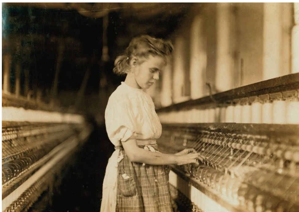
Obrázek 10: Child Labour. Foto: Lewis Hine (1911)

Jako příklad autoři uvádí sociální fotografie pracujících dětí Lewise Hina. Tyto snímky byly na levném novinovém papíře rozesílány veřejným činitelům a institucím. Měly vyvolat dojem, že dětská práce je nepřipustná. Kdyby se ale stejné fotografie vystavovaly v galerii, hodnotilo by je publikum z estetického a formálního hlediska. Lidé by nevnímali chudé děti, ale zajímavý námět. 79