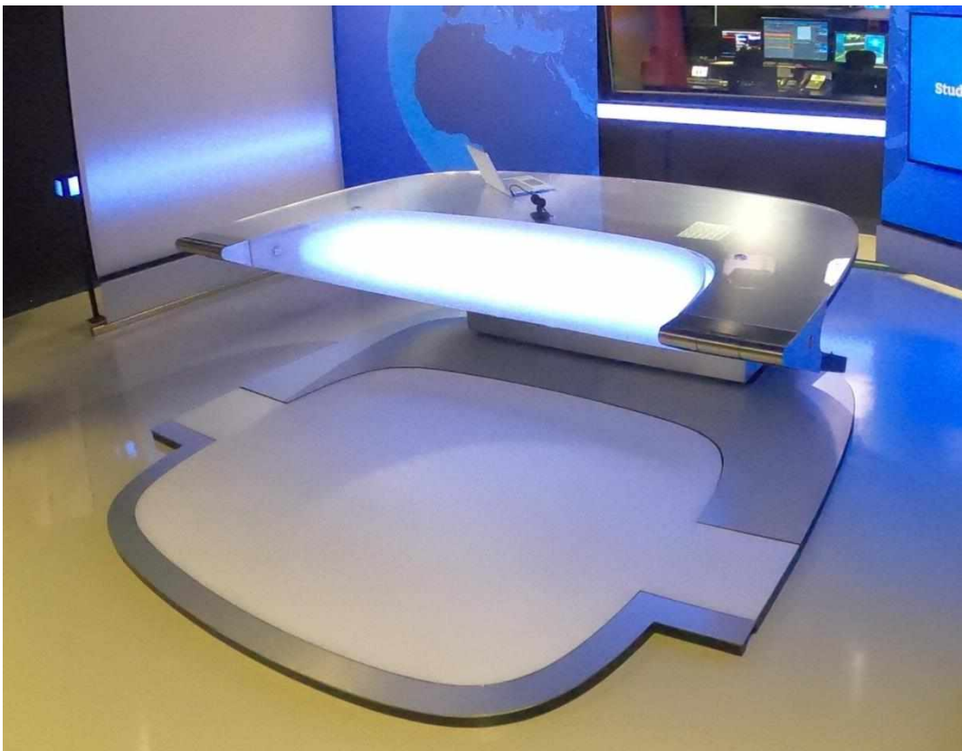
Příloha č. 10: Moderátorský stůl (TS České Budějovice)