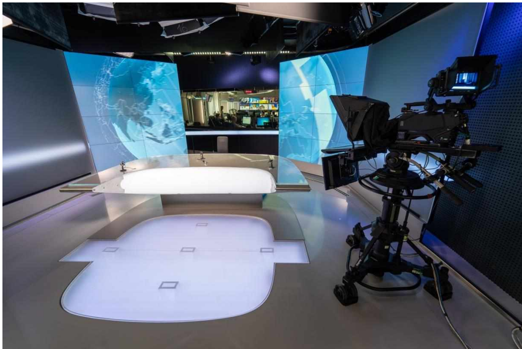
Příloha č. 1: Televizní studio SK 9 Praha – předloha pro regionální studia