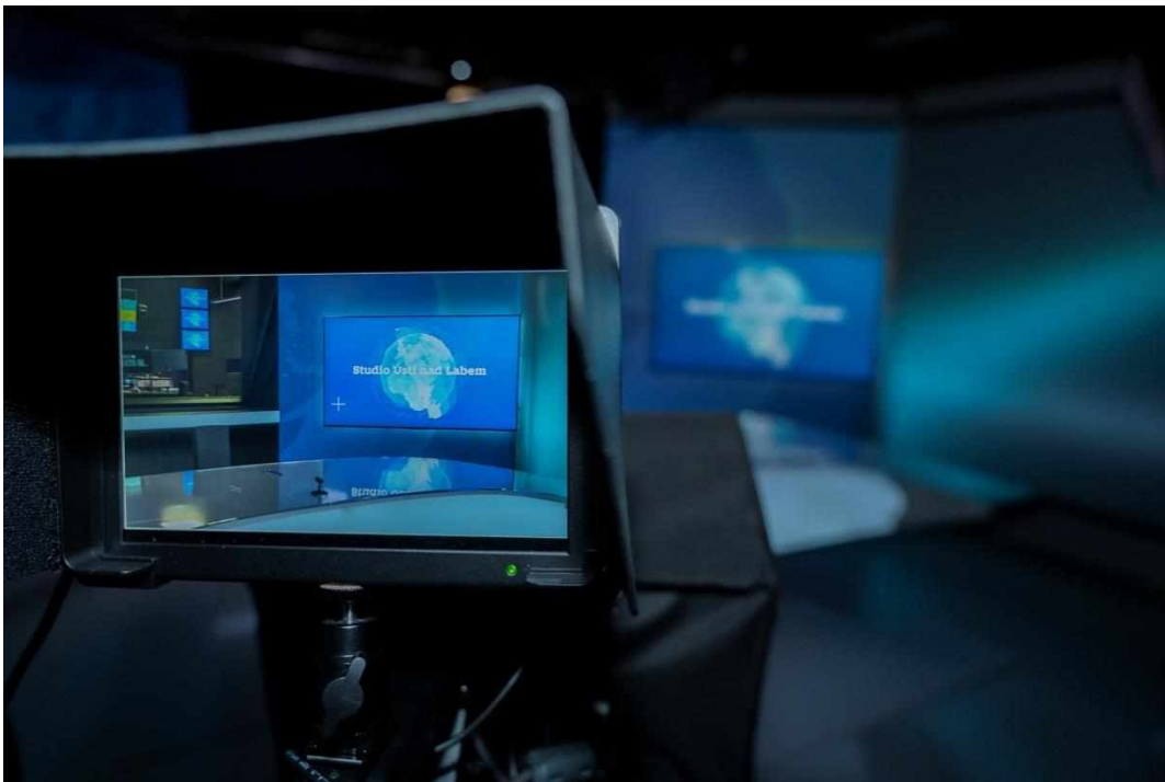
Příloha č. 12: Pohled kamery – na rozdíl od TS v Praze, Brně a Ostravě jsou regionální studia místo orionů vybavena velkoplošnými obrazovkami (TS Ústí nad Labem)