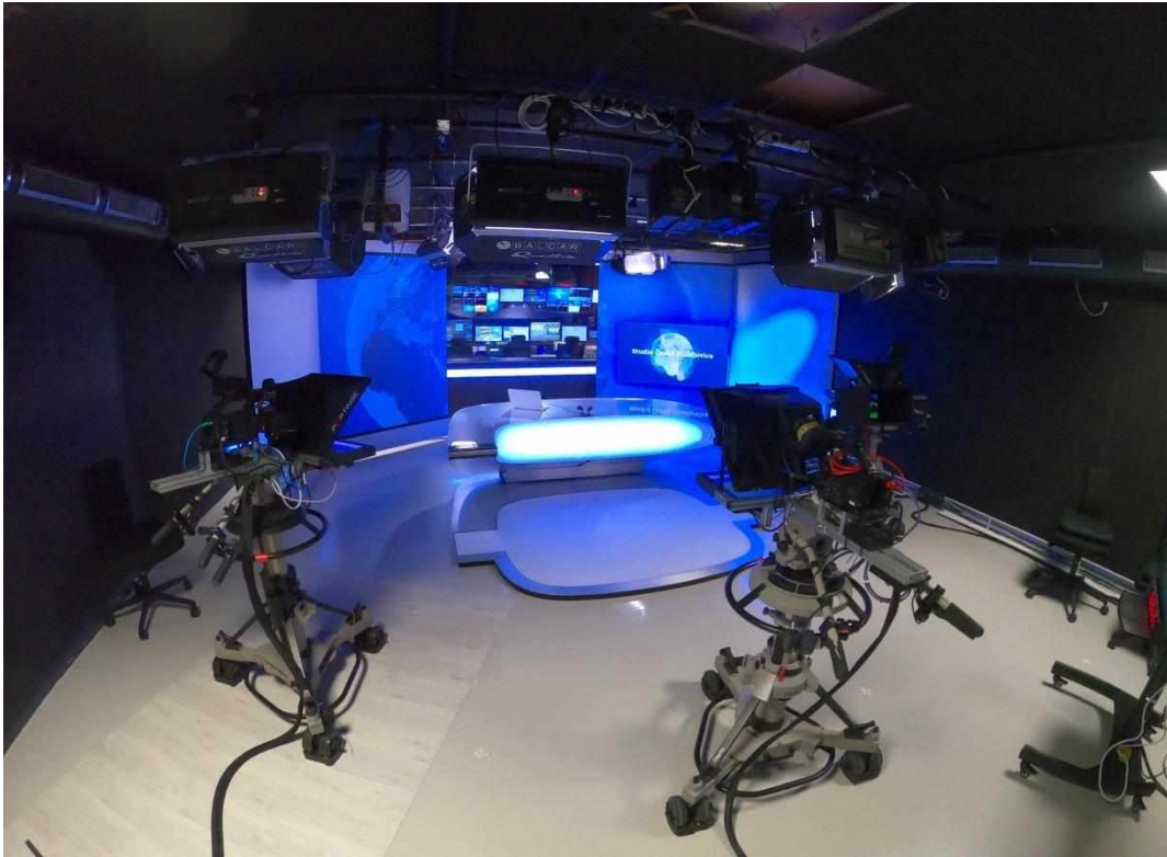
Příloha č. 3: TS České Budějovice – postavení kamer