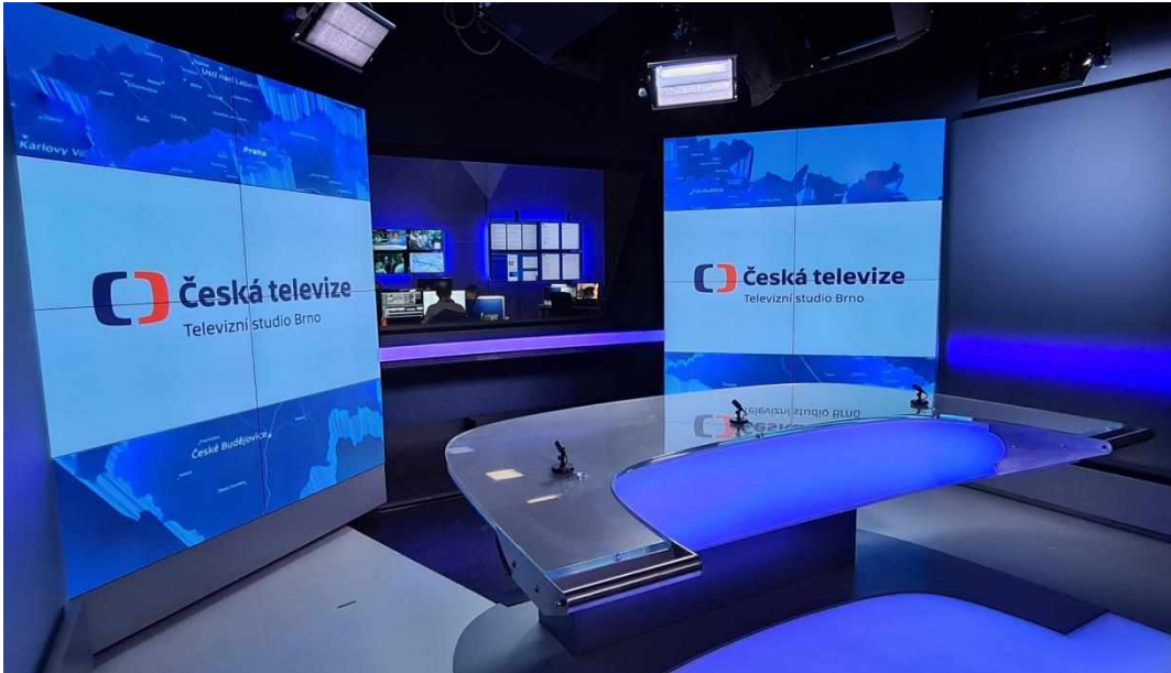
Příloha č. 9: Televizní studio Brno