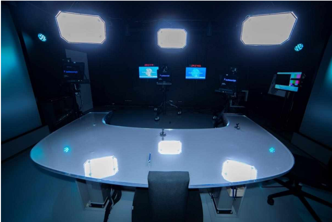
Příloha č. 5: TS Ústí nad Labem – pohled z režie