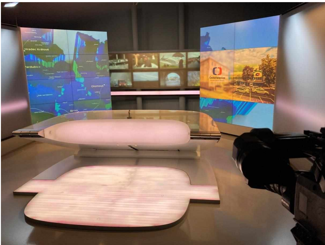
Příloha č. 8: Televizní studio Ostrava