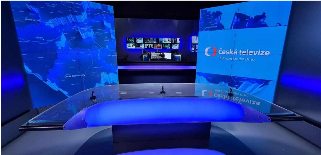
Příloha č. 11: Oriony v TS Brno