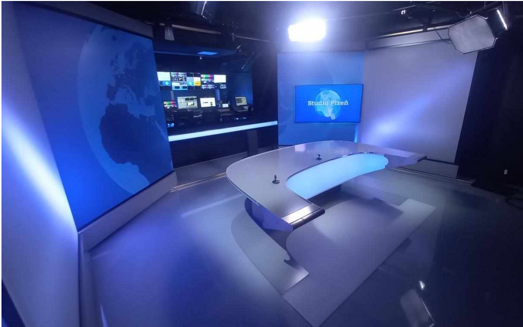
Příloha č. 7: Televizní studio Plzeň