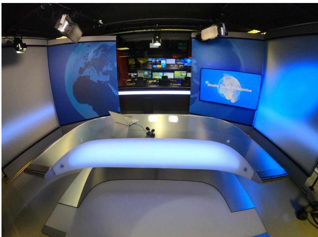
Příloha č. 2: Televizní studio České Budějovice