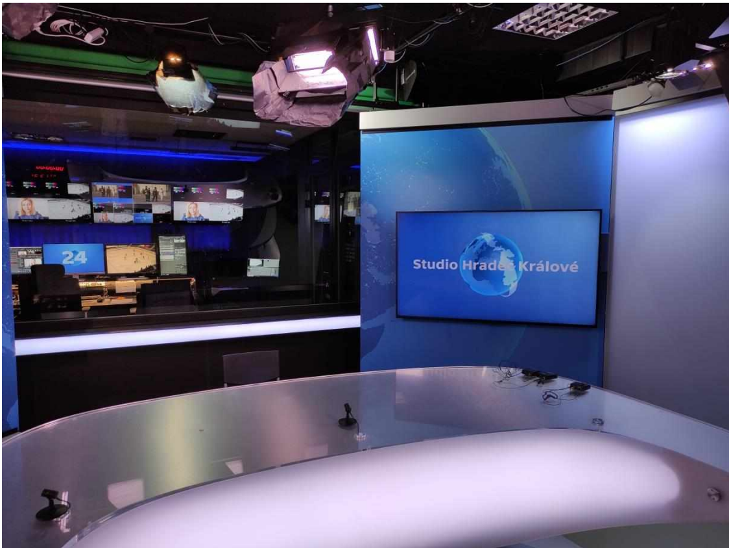
Příloha č. 6: Televizní studio Hradec Králové