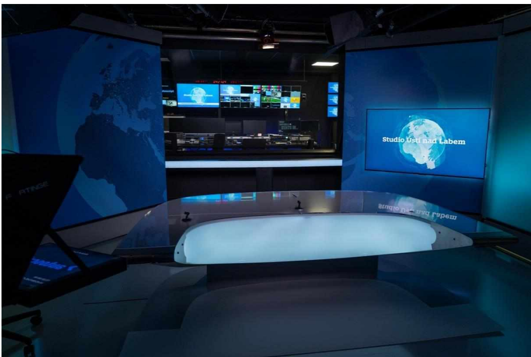
Příloha č. 4: Televizní studio Ústí nad Labem