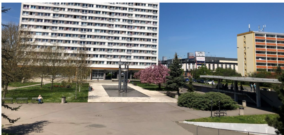
Obr. č. 23: Centrální část náměstí za slunného dne (květen, 2021)