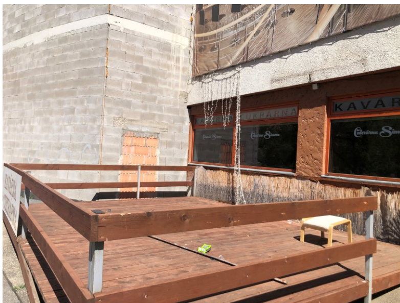
Obr. č. 26b: Prázdné prostory KCN: bývalá cukrárna