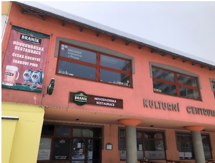
Obr. č. 16: Vizuální smog na budově kulturního centra