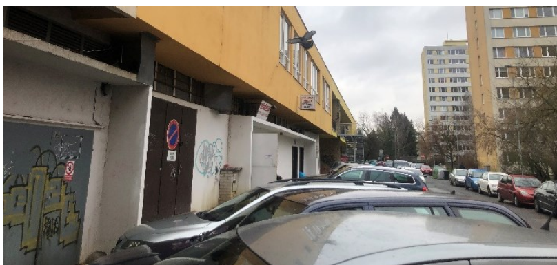
Obr. č. 11: Parkování v ulici Jílovská