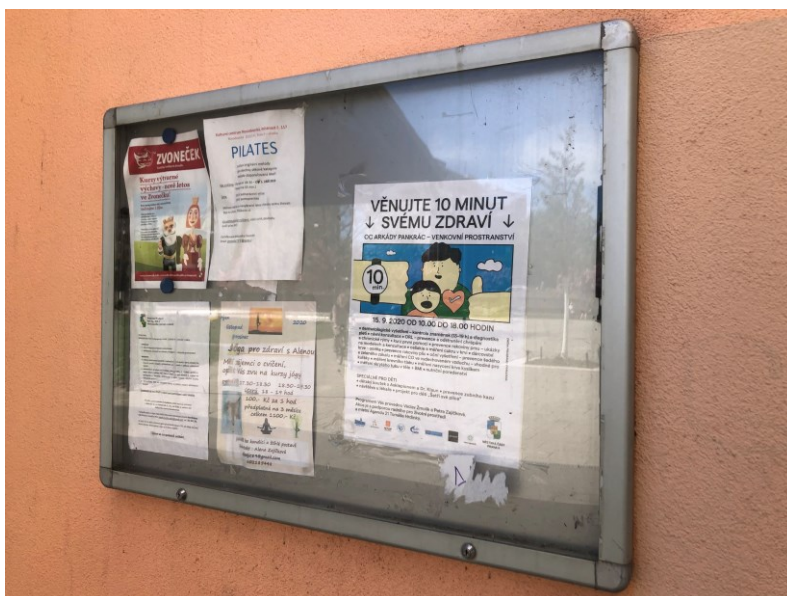
Obr. č. 27: Informační tabule kulturního centra Novodvorská