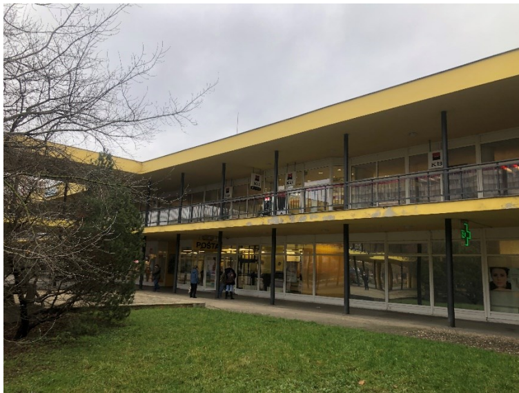
Obr. č. 2: Pasáž a horní pasáž