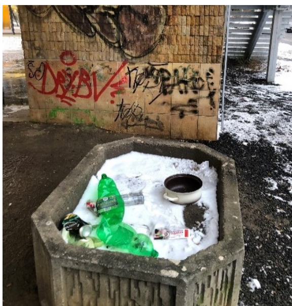
Obr. č. 15b: Betonové květináče v pasáži