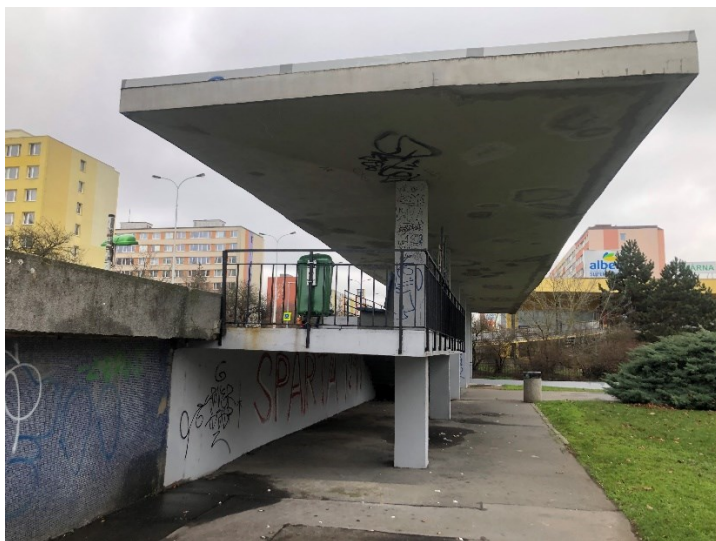
Obr. č. 19b: Betonové struktury v prostoru zastávky