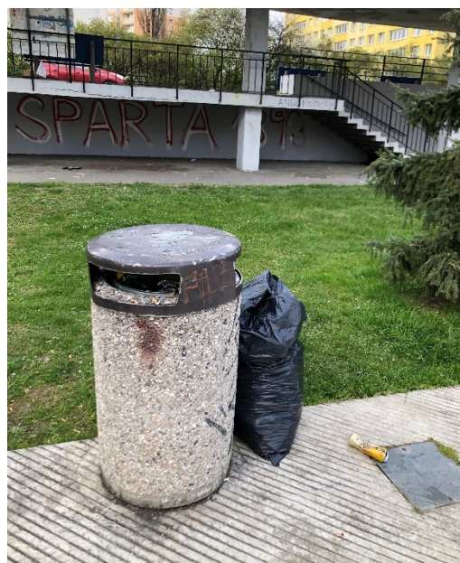
Obr. č. 13: Stav odpadkových košů v centrální části náměstí