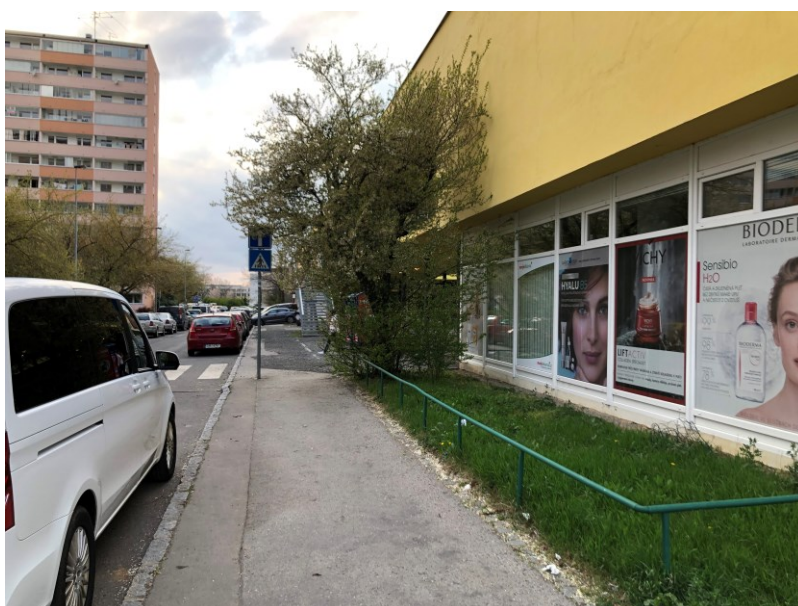
Obr. č. 6: Výloha lékárny, tyčová konstrukce