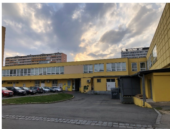
Obr. č. 9: Ulička mezi poštou a drogerií (vlevo), parkoviště za poštou (vpravo)