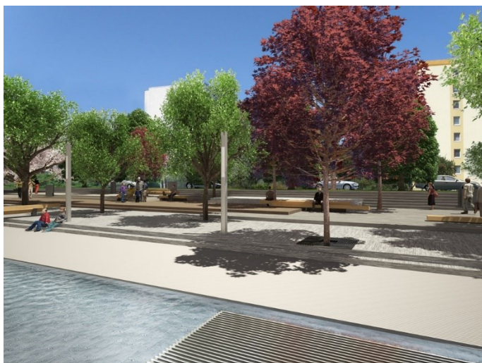
Obr. č. 24: Vizualizace celkového záměru - relaxační zóna (2010); zdroj: www.archiweb.cz/b/rekonstrukce-namesti-novodvorska-1-etapa