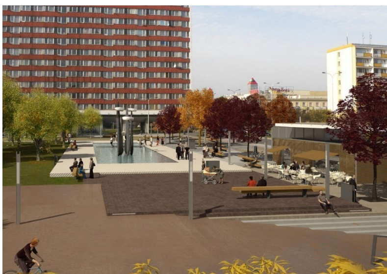
Obr. č. 22: Vizualizace centrální části náměstí po jeho revitalizaci (2010)