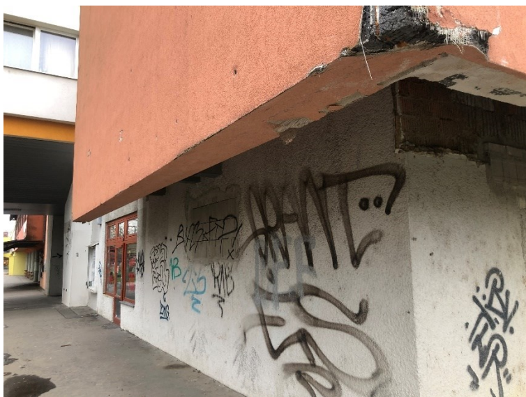
Obr. č. 7: Cesta na náměstí směrem od městského úřadu (na obr. Kulturní centrum Novodvorská)