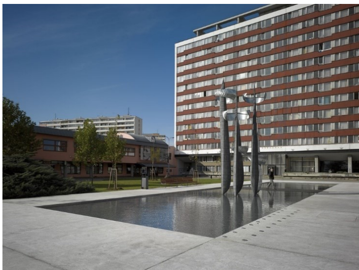
Obr. č. 18a: Snímek po rekonstrukci (2010); zdroj: www.archiweb.cz/b/rekonstrukce-namesti-novodvorska-1-etapa