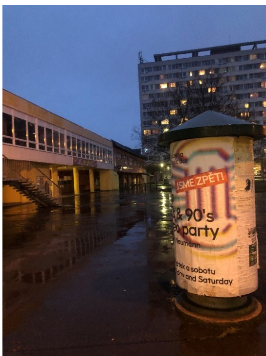
Obr. č. 20: Reklamní budka, tzv. outdoor reklama