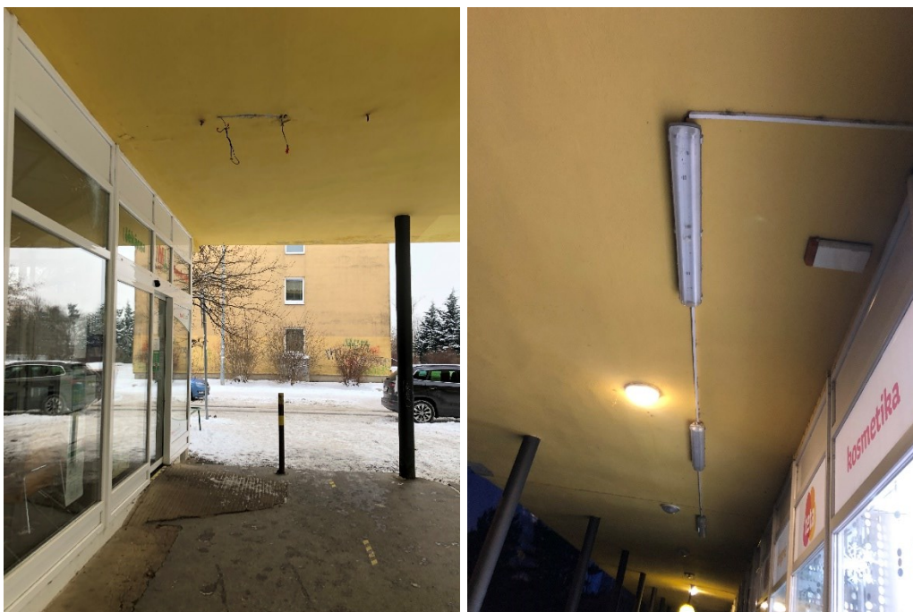
Obr. č. 3: Osvětlení před lékárnou (vlevo), osvětlení před drogerií (vpravo)