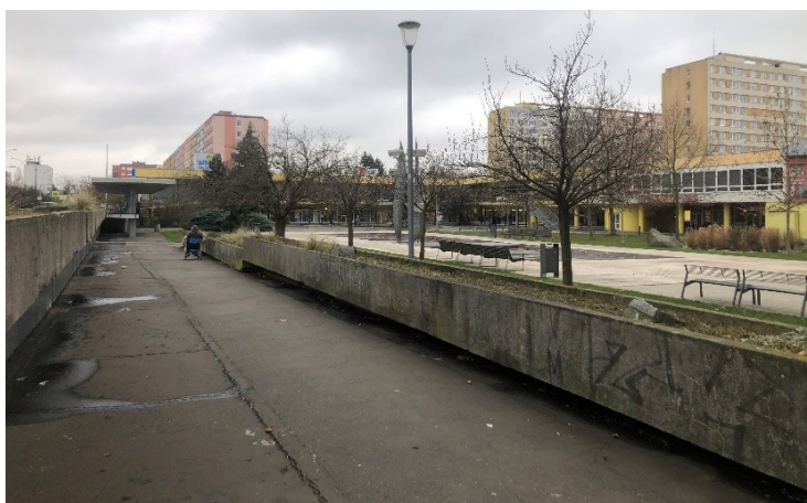
Obr. č. 19a: Betonové struktury v prostoru zastávky