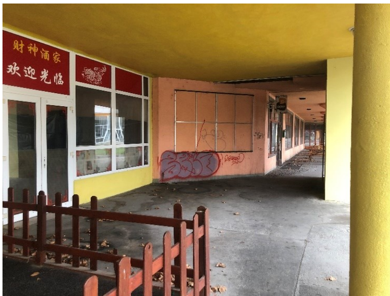
Obr. č. 17: Ulička v prostoru předzahrádek