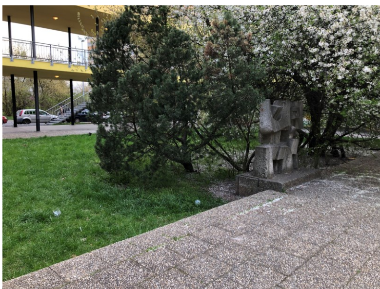
Obr. č. 4: Plastika a plácek před poštou