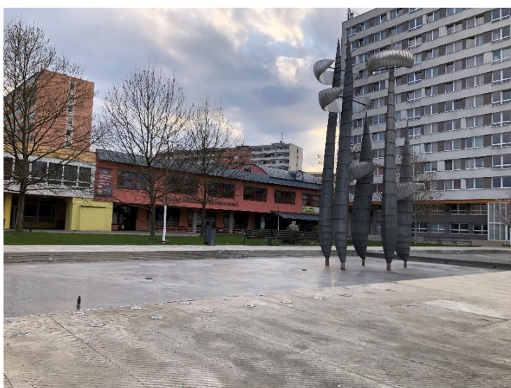
Obr. č. 18b: Snímek současného stavu (2021)