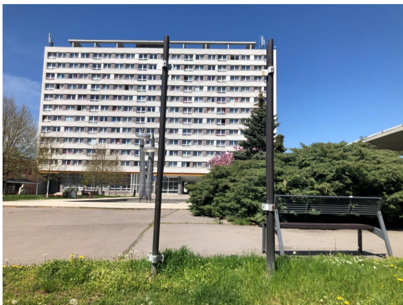
Obr. č. 21: Nejspíš bývalý reklamní nosič