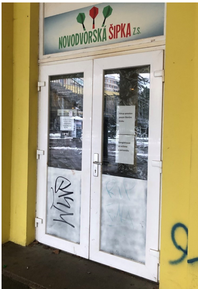
Obr. č. 28: Vstupní dveře do spolku Novodvorské šipky