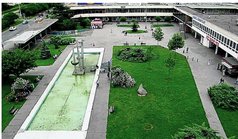
Obr. č. 18: Snímek před rekonstrukcí (2009)