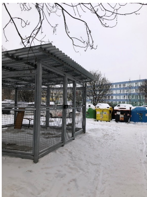
Obr. č. 12: Klece na klíč v ulici Jílovská