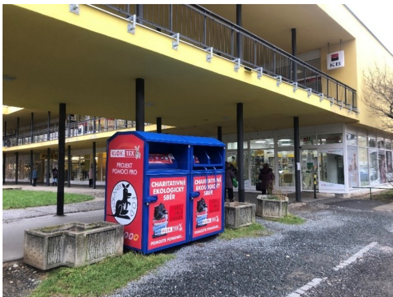
Obr. č. 14b: Umístění kontejnerů na použitý textil – ulice Jílovská