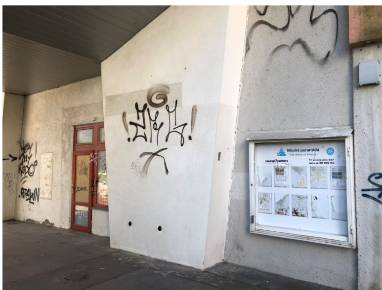
Obr. č. 26a: Prázdné prostory KCN: bývalé papírnickví