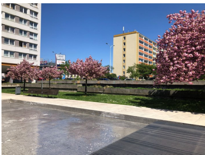
Obr. č 25: Prostorová praxe - relaxační zóna (květen, 2021)