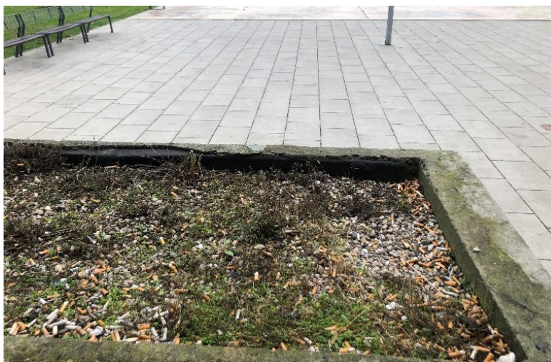
Obr. č. 15a: Betonové květináče v centrální části náměstí