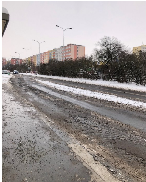
Obr. č. 10: Současný stav ulice Novodvorská