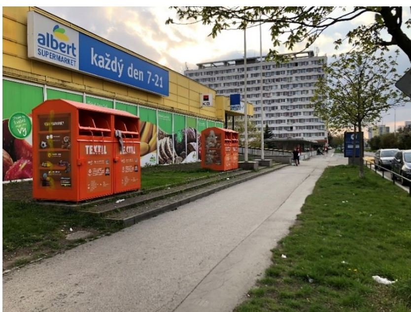
Obr. č. 14a: Umístění kontejnerů na použitý textil – ulice Novodvorská