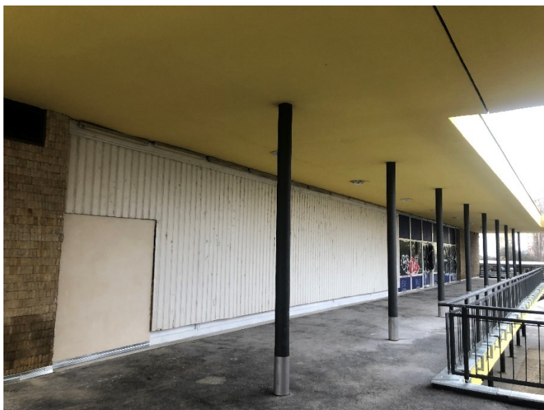
Obr. č. 5: Prostory před bývalým casinem v horní pasáži