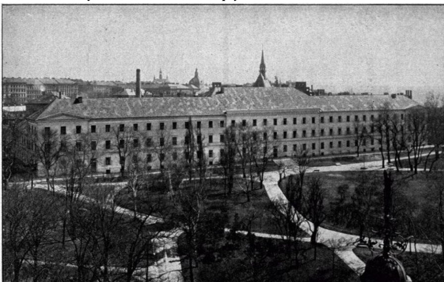
Příloha 2 – Nový dům, česká a německá psychiatrická klinika

Zdroj: Frabša a Heveroch, 1926, str. 105