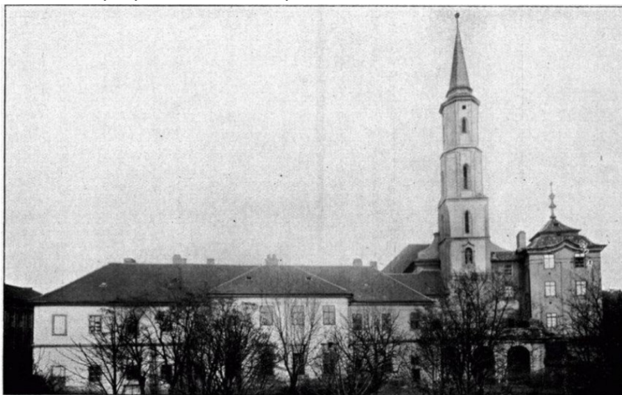
Příloha 1 – Bývalý klášter sv. Kateřiny