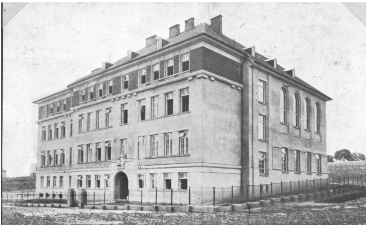
č. 14 Hlavní dům Družiny Brno–Lerchova 65, který sloužil taktéž jako místo, kde se nacházel ústav pro mentálně postižené děti.