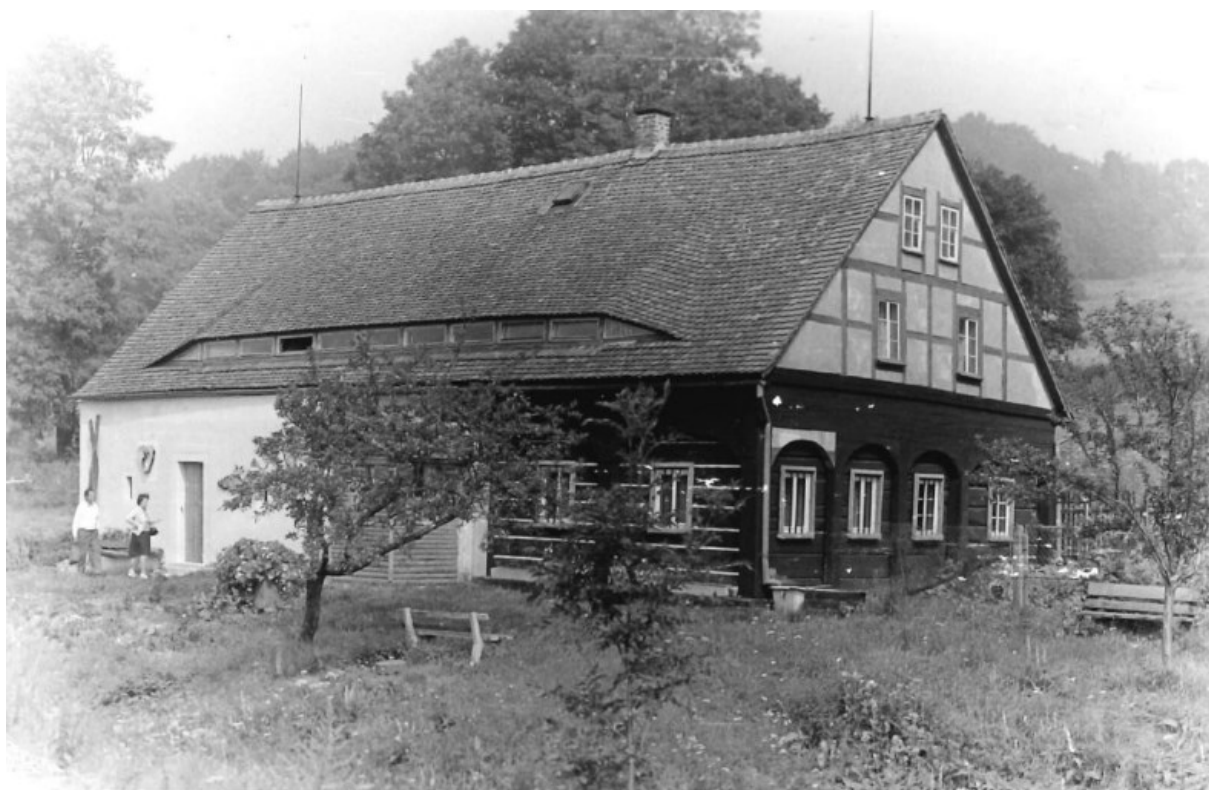
č. 22 Dům Dolní Podluží plnil stejný účel jako v Krásné Lípě.