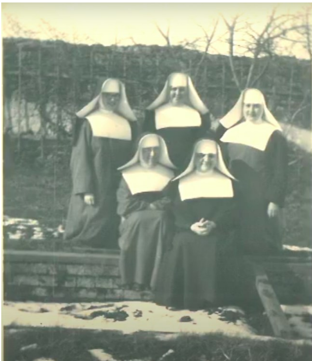
č. 24 Vyobrazení původního řeholního šatu sester. Fotografie zachycuje sestry v zahradě na Velehradě.