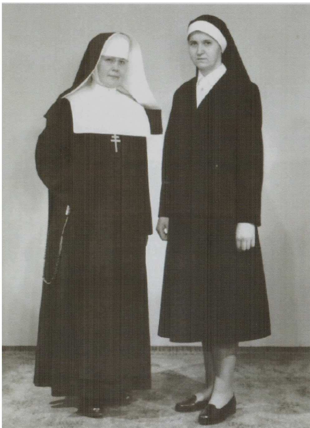
č. 32 V roce 1967 došlo ke změně řeholního oblečení sester. Na fotografii je zachyceno původní (vlevo) a nové řeholní oblečení (vpravo).