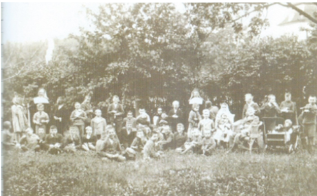
č. 23 Sestry ve velehradské zahradě spolu s postiženými chlapci.