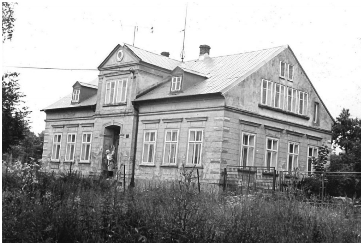
č. 21 Dům sester v Krásné Lípě, který zakoupily pro rekreaci a návštěvu svých rodin.