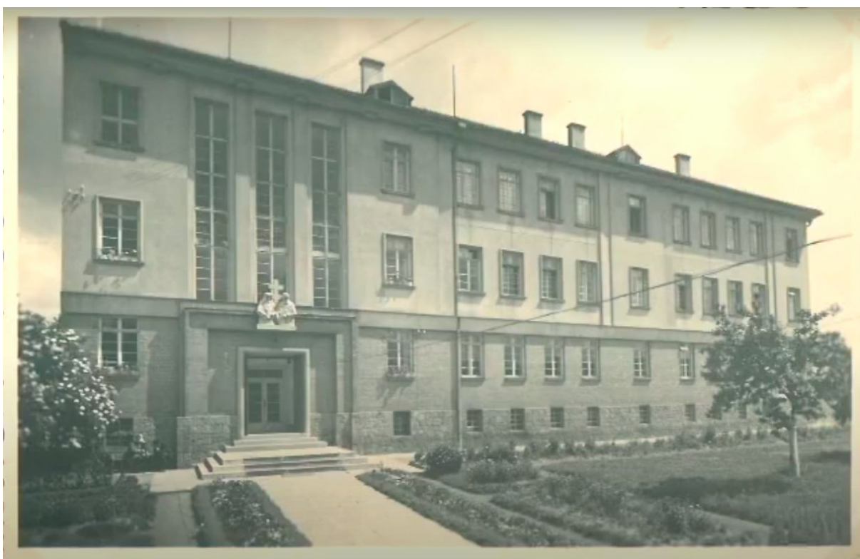
č. 17 Pohled z jihozápadní strany na dům sester na Velehradě.