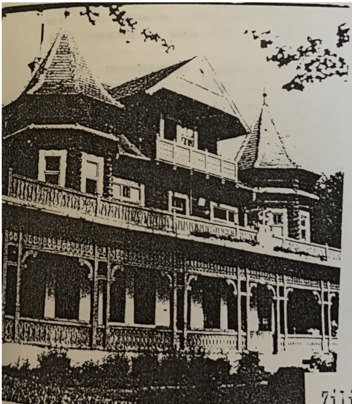
č. 20 Vila na Boriku, ve které působily sestry jako pečovatelky (1938–1957).