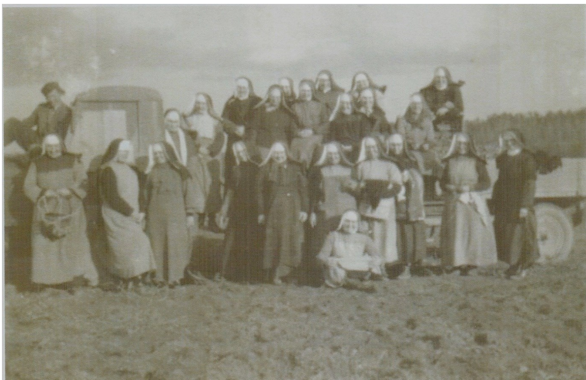
č. 25 Sestry při sběru brambor v Bílé Vodě v roce 1950. Jednalo se o první placenou práci, kterou zde sestry vykonávaly.