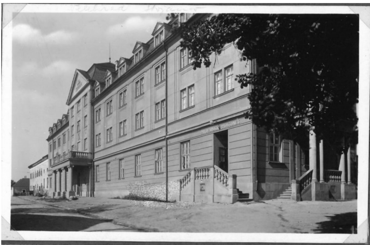
č. 15 Velehrad–Stojanov, který sloužil jako exerciční dům, později zde byl taktéž ústav pro sociálně znevýhodněné děti.