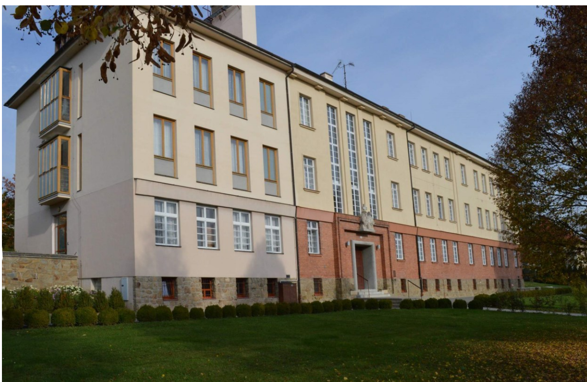
č. 34 Přístavba části budovy na Velehradě–Hradištská 142 v roce 2000.