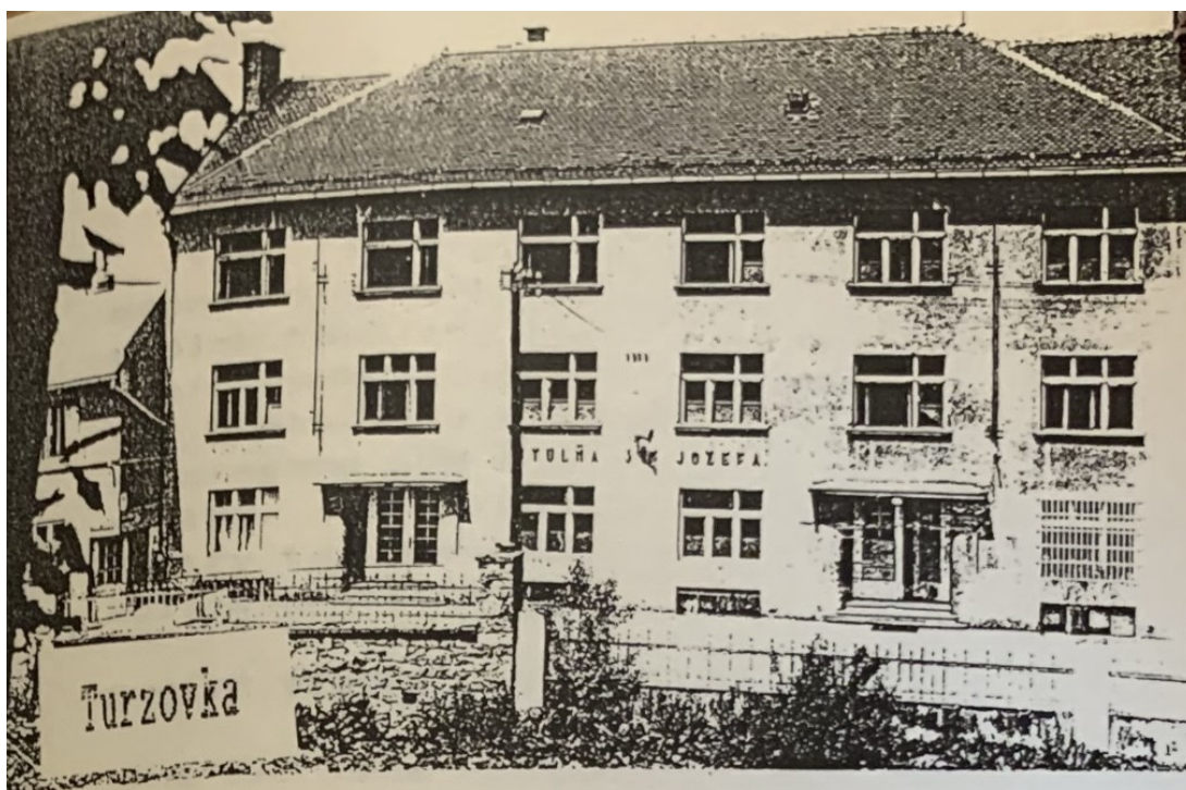
č. 19 „Starobinec sv. Josefa“, který sloužil také i pro sirotky, o které se zde sestry staraly od roku 1938.