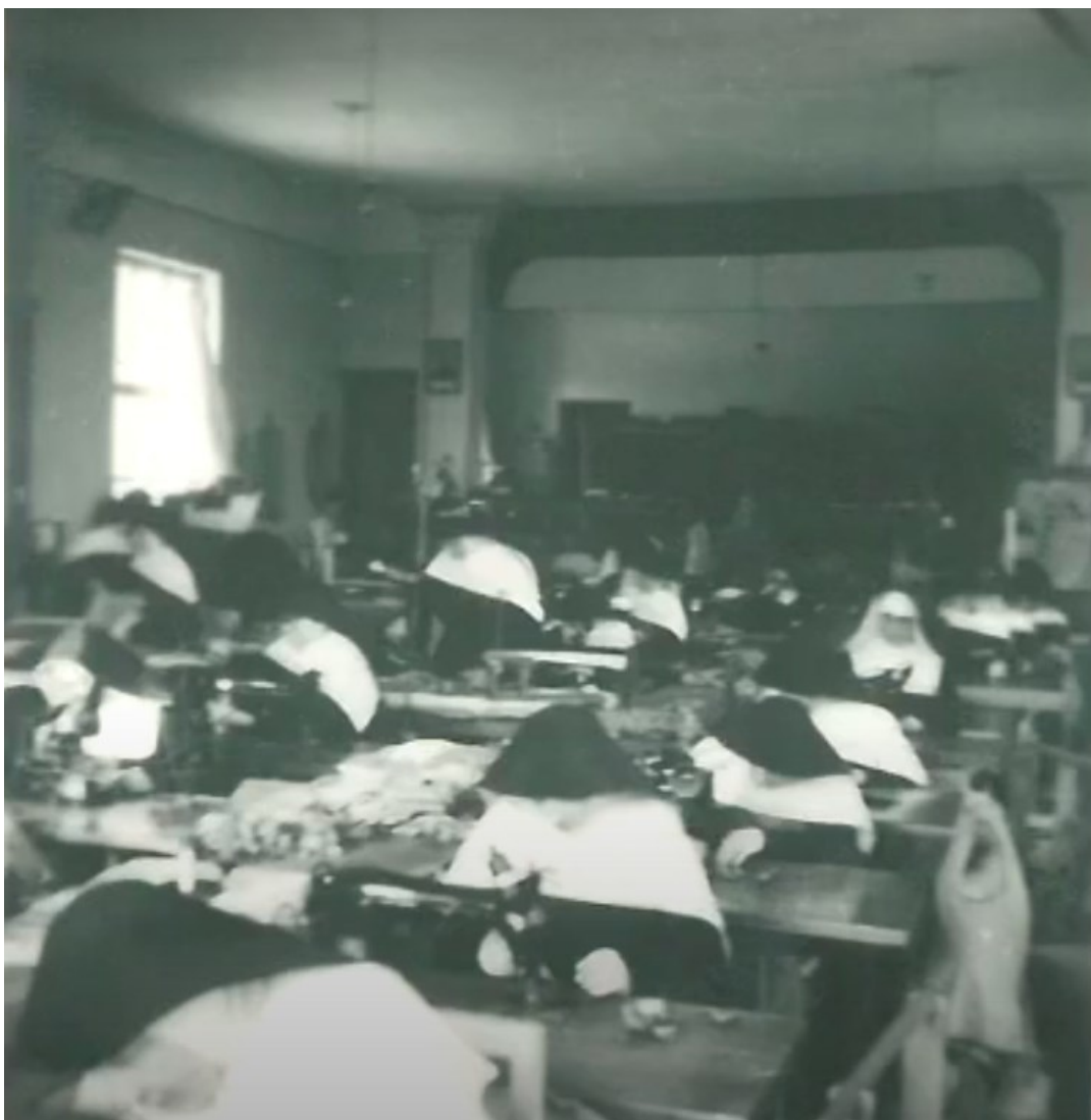
č. 29 Fotografie zachycuje sestry při práci v období internace v Bílé Vodě.