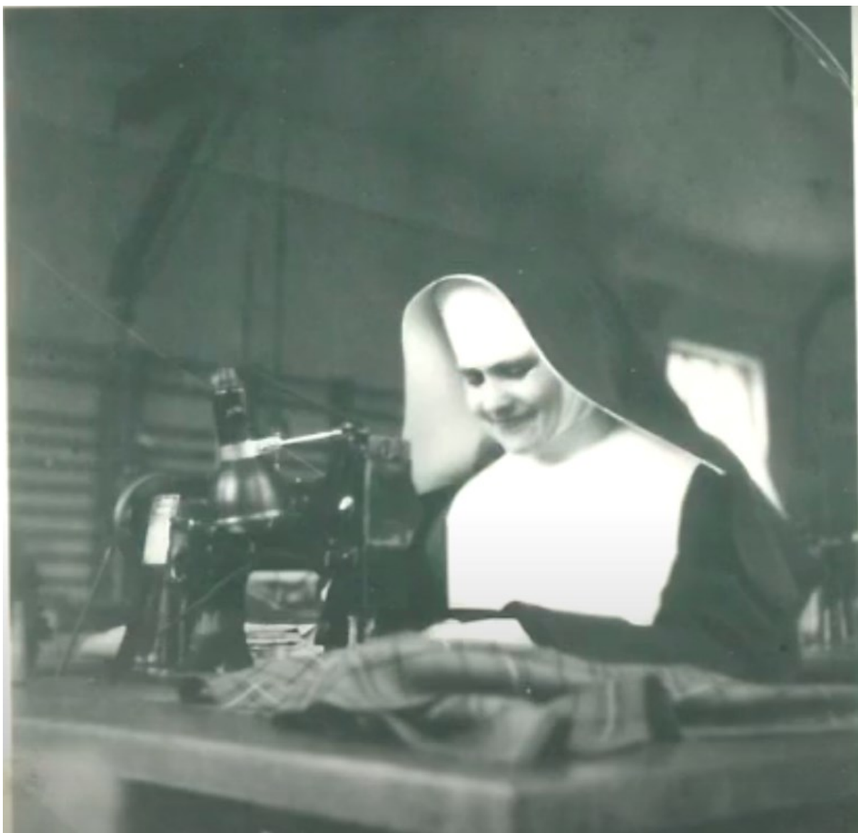
č. 27 Fotografie zachycující sestru při práci pro OP Prostějov v 50. letech 20. století.