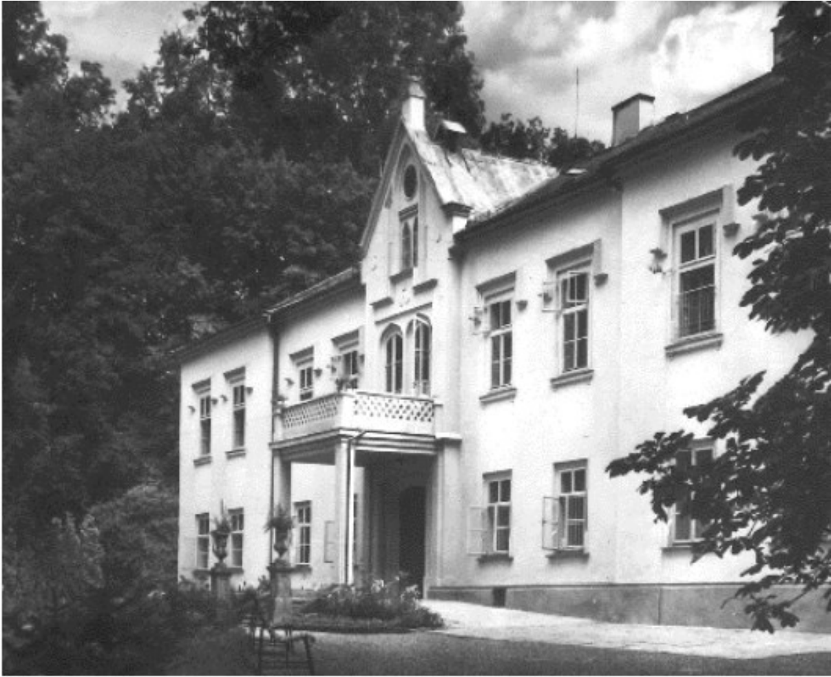
č. 13 „Ústav pro slabomyslné děti“ ve Skaličce, kde sestry působily od jeho založení až do doby, kdy sestry odcházejí do důchodu (1988).