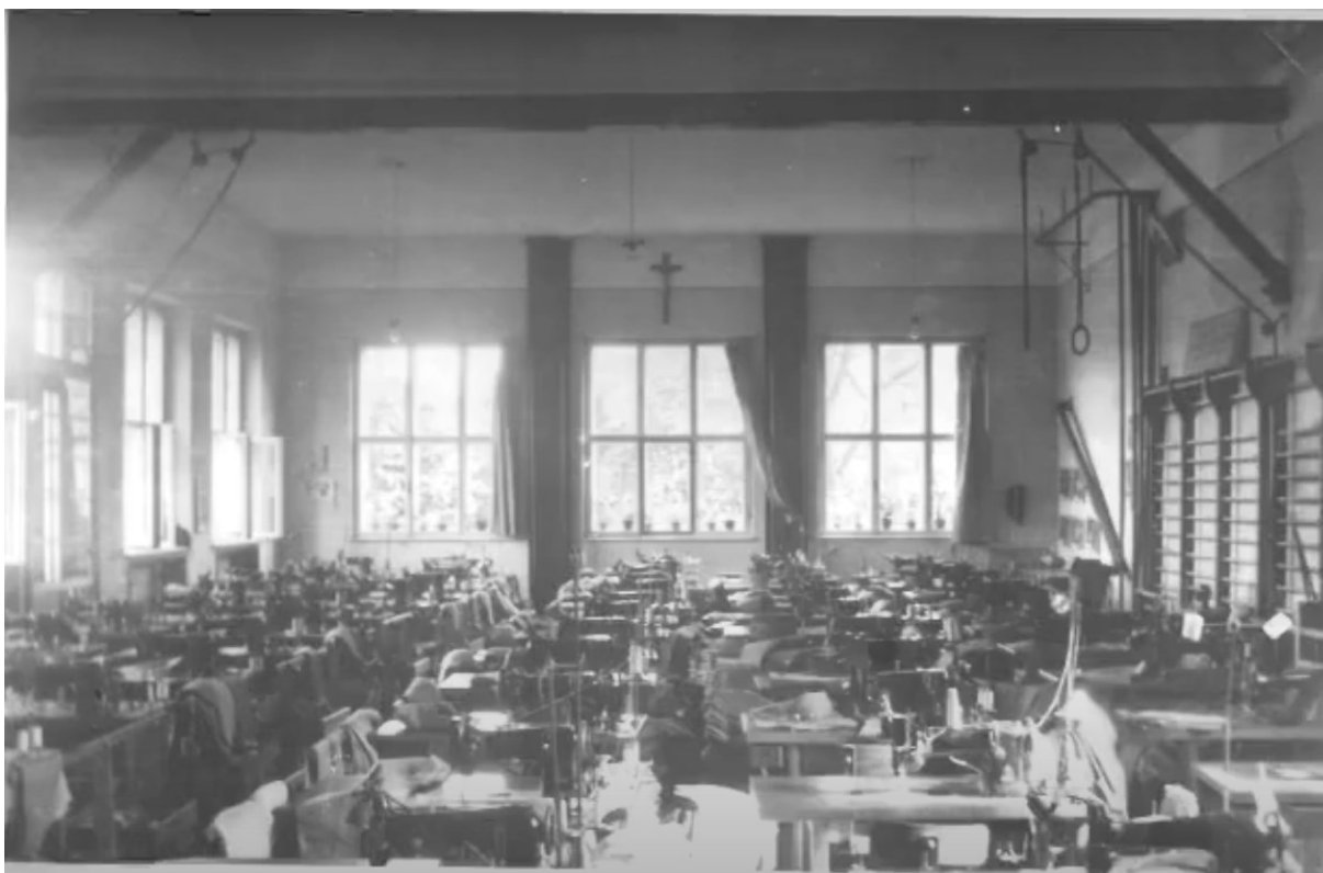
č. 28 Fotografie tělocvičny, ve které cyrilky spolu s ostatními sestrami šily oblečení pro OP Prostějov. Každá sestra měla přidělený svůj šicí stroj, na kterém šila oblečení.