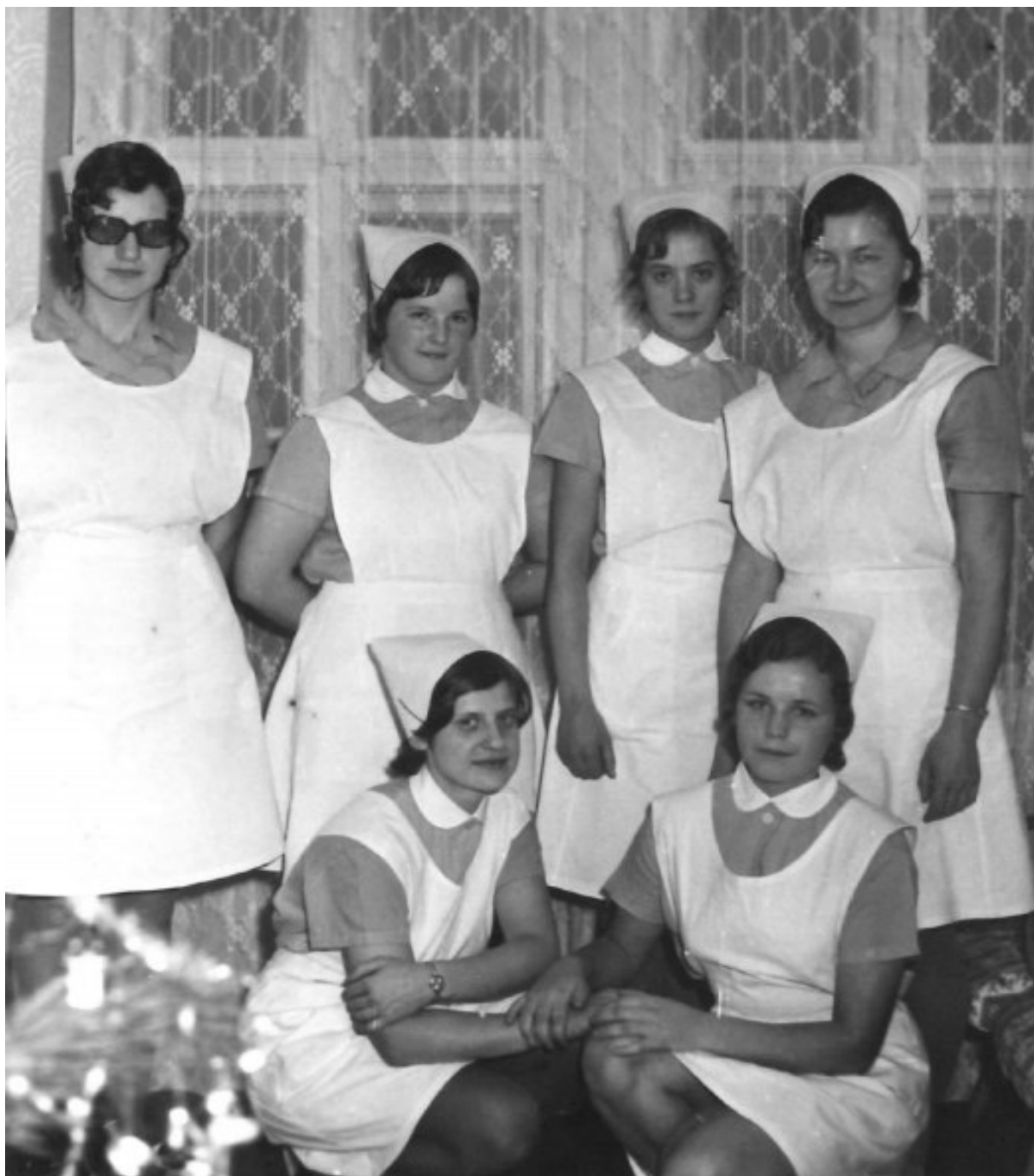
č. 31 Sestry v civilním oblečení na Velehradě v 70. letech.